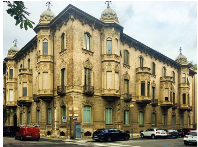
Figura 6. Edificio di corso Montevecchio 38, Torino, sede di Scienza Nuova.

Definito questo quadro, necessariamente schematico, in cui la figura dell'ingegnere politecnico era saldamente ancorata a una prospettiva d'azione definita a scala territoriale,