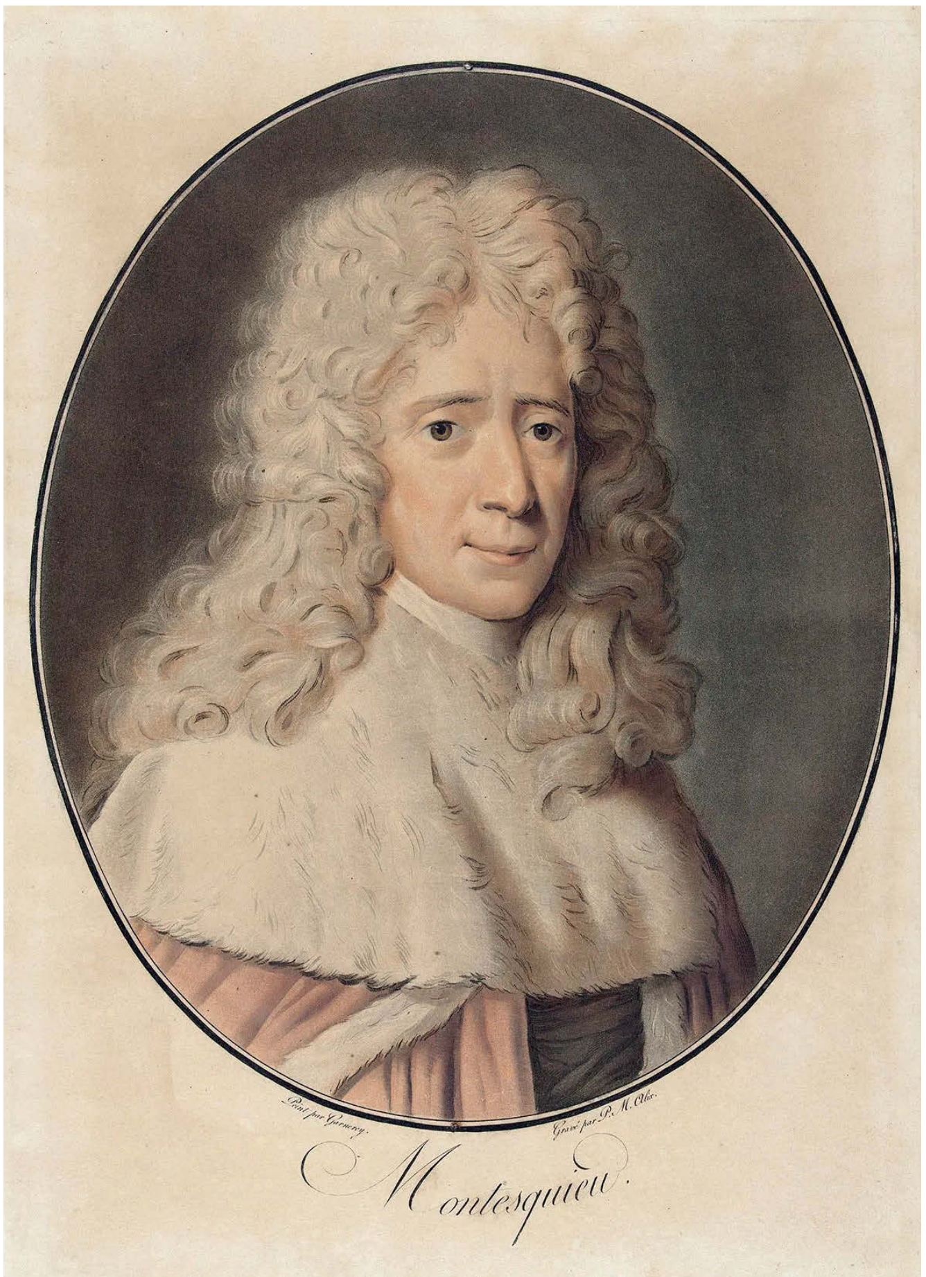
fig. 3 - Montesquieu ( https://www.britannica.com/biography/Montesquieu#/media/1/390782/241684 - su concessione di Rijksmuseum, Amsterdam).