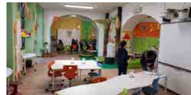
Un paesaggio didattico allestito presso il Circolo Didattico di San Filippo a Città di Castello (PG)