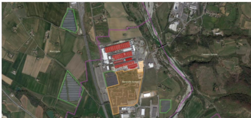
Fig. 1. Campi fotovoltaici (verde) tra aree dismesse (beige, cross), impianti su coperture (rossa) e su parcheggi (cream).