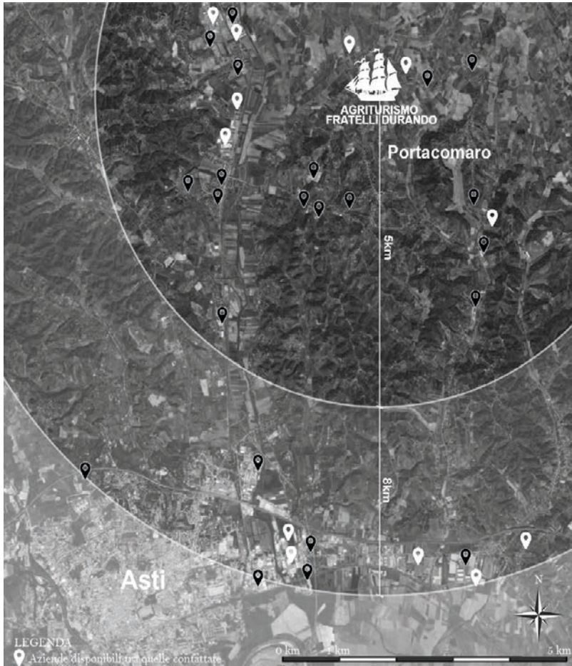
Aziende contattate in fase di harvesting: in bianco le aziende disponibili a fornire scarti tra cui legno, tessuti, metallo [J. Gasparotto, A. Gino].

chi circolari a livello internazionale. I progetti individuati sono stati schedati mettendo in evidenza: utenti prevalenti (adulti/bambini), materiali impiegati (materiali riciclati, materiali di scarto, materiali vergini), attività previste (ludico-ricreative, sportive, didattiche) e modalità di comunicazione della circolarità (implicita e/o esplicita).