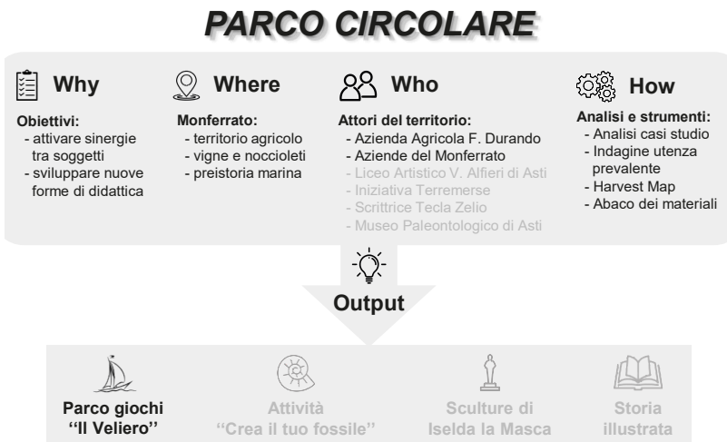
Figura 1. La ricerca in sintesi: il Parco Circolare è uno degli output del progetto, che comprende altri esiti strumentali alla sensibilizzazione degli utenti [J. Gasparotto, A. Gino].

La transizione verso l'economia circolare [Circular Economy Action Plan, 2020], rappresenta un'azione chiave dell'Agenda 2030 (2015) e del Green Deal (2019) al centro dell'agenda politica internazionale. Una molteplicità di settori strategici pubblici e privati sono chiamati a confrontarsi sull'economia circolare. Il settore delle costruzioni è considerato strategico non solo perché responsabile di enormi quantità di emissioni e di rifiuti, ma anche perché è in grado di assorbire rifiuti e scarti - anche di altri settori - e valorizzarli, allungarne la vita utile, secondo logiche di riduzione dell'impatto ambientale. Una visione dell'economia circolare che fonda il concetto di reintroduzione e valorizzazione di risorse sottoutilizzate e/o sprecate nell'attuale modello di sviluppo può essere anche un veicolo per ripensare nuove strategie di valorizzazione del territorio a scala locale, attraverso la sinergia tra settori, istituzioni e attori locali [Kirchherr et alii, 2017; Quaranta et al., 2018]. Il progetto di un Parco Circolare nel Monferrato (Portacomaro, AT), frutto della collaborazione tra il gruppo di ricerca dell'area tecnologica del DAD - Politecnico di Torino e attori locali, nasce per un duplice