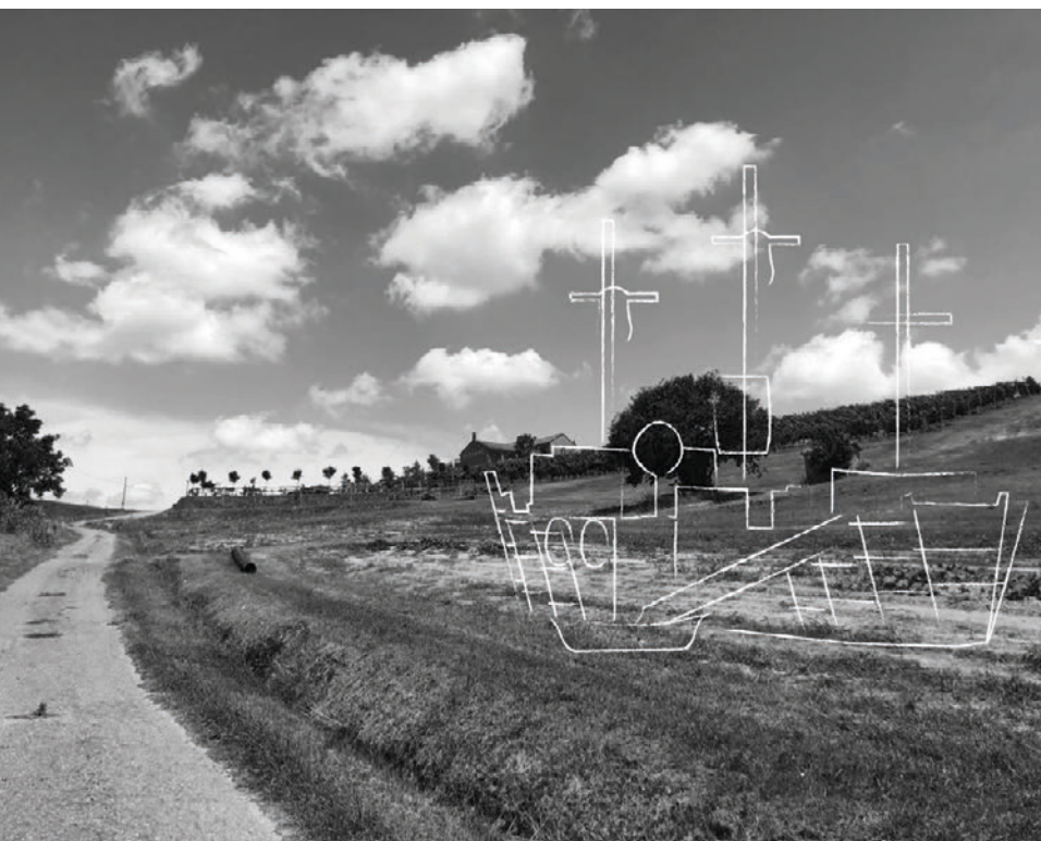
Figura 3. Il veliero nelle colline del Monferrato [J. Gasparotto, A. Gino].

Nel contesto del Parco Circolare il veliero rimanda anche ad altri messaggi: da un lato evoca le origini della storia del Monferrato, territorio ricoperto dal mare milioni di anni fa e ricco di reperti marini, attualmente conservati al Museo Paleontologico di Asti; dall'altro richiama la tradizione agricola del