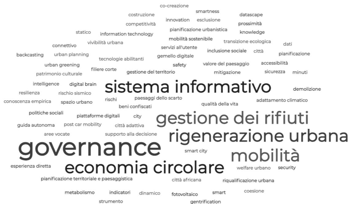
FIGURA 1 | WORD CLOUD DELLE PAROLE CHIAVE INDIVIDUATE DAGLI AUTORI DEI CONTRIBUTI PRESENTATI.

di partecipazione, sugli sviluppi delle soluzioni di mobilità individuale e collettiva e delle tecnologie dell'informazione applicate ai processi progettuali e costruttivi, sulle tecnologie che consentono soluzioni adattive ai rischi e ai cambiamenti climatici.