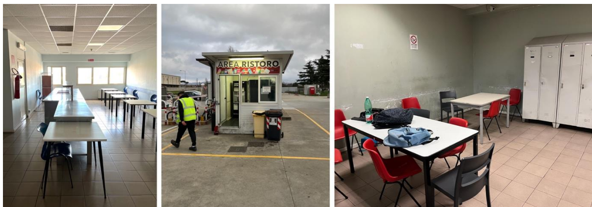
Figura 2 | Ce.Di. per il cibo fresco a Santa Palomba, spazi accessori per i lavoratori.

Molti degli spazi che assolvono queste attività paiono in realtà scarti dello spazio logistico, siano essi spogliatoi, salette ristoro, uffici, o sala mensa. Collocati in un'appendice della struttura principale, sono caratterizzati da una scarsa qualità architettonica, piccole dimensioni e minime dotazioni di confort. Tanto che durante la pandemia, quando le norme di distanziamento interpersonale hanno portato alla necessità di aggiungere ulteriori spazi, come punti ristoro e spogliatoi, si è ricorso a container posizionati al centro del parcheggio destinato al personale. In questi spazi è spesso evidente la stratificazione di usi (i muri degli uffici sono ricoperti di vecchie campagne aziendali, le scrivanie ospitano foto di famiglia, peluche, gadget vari), ed è talvolta forte l'interazione (come quando a fine turno vi si segue tutti assieme una partita di calcio sullo schermo di uno smartphone).