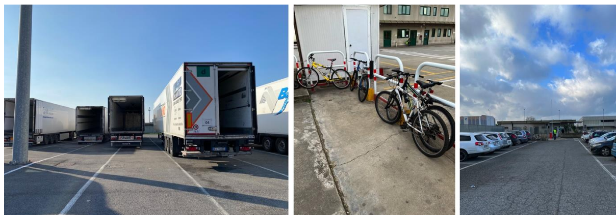
Figura 3 | Camion, auto, bici e monopattini. I Ce.Di. producono molteplici flussi nei territori in cui sono impiantati.

Il processo di trasformazione degli spazi e dei funzionamenti riguarda l'interno del Centro quanto le sue relazioni con l'esterno, in modo particolare rispetto alla mobilità e alla residenzialità. La maggior parte degli operatori logistici ha un contratto a tempo indeterminato e lavora in azienda da diversi anni, alcuni di loro da più di 15. Questo ha spinto la quasi totalità dei lavoratori (spesso provenienti da Roma) a stanziarsi nei comuni prossimi a Santa Palomba, affittando o acquistando appartamenti. Una parte dei lavoratori di origine straniera, dopo alcuni anni di permanenza in Italia, ha qui costruito una famiglia, ricongiungendosi con i familiari che risiedevano nei paesi d'origine. Altri lavoratori, più giovani o da meno tempo in Italia, condividono il domicilio con colleghi, formando così piccoli nuclei che non solo condividono lo spazio del lavoro ma anche la quotidianità domestica. La condivisione riguarda anche le forme di mobilità. Se infatti i dipendenti degli uffici aziendali arrivano quasi tutti con un'auto propria, molti operatori della logistica condividono l'auto con chi abita nello stesso Comune. Una parte minoritaria usa il treno, o i bus pubblici. I più vicini, le biciclette o i monopattini elettrici, generando flussi di mobilità alternativi sull'intorno.