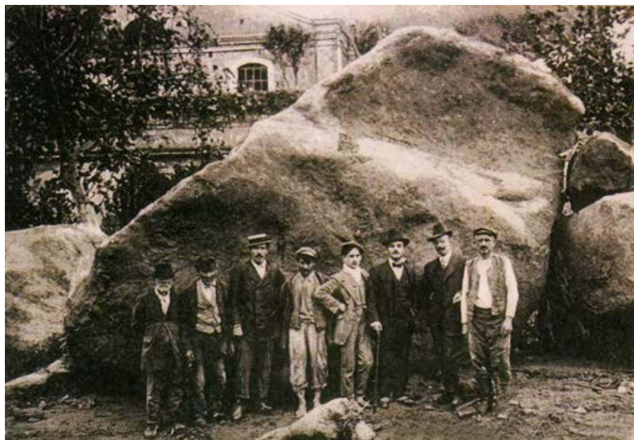
Casamicciola. Un'immagine degli effetti dell'alluvione del 1910

Vale la pena, in conclusione, ricordare ancora a tutti noi, come fa Serenella Iovino – in quella che è quasi una profezia della tragedia del 26 novembre 2022 – che “ogni atto dell'abitare è un'interpretazione del paesaggio e dell'ambiente. Abitare è, cioè, interpretare il luogo in cui si è, dal paese al pianeta. Un'interpretazione corretta del testo del luogo, una