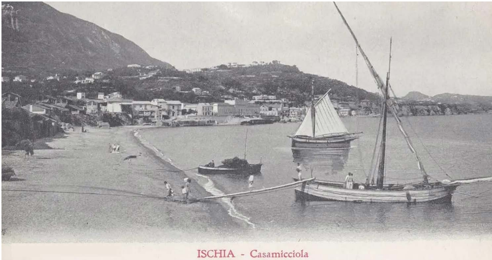
ISCHIA - Casamicciola

Una delle immagini che raccontano una paradossale identità: quel che siamo attraverso quel che non siamo più.