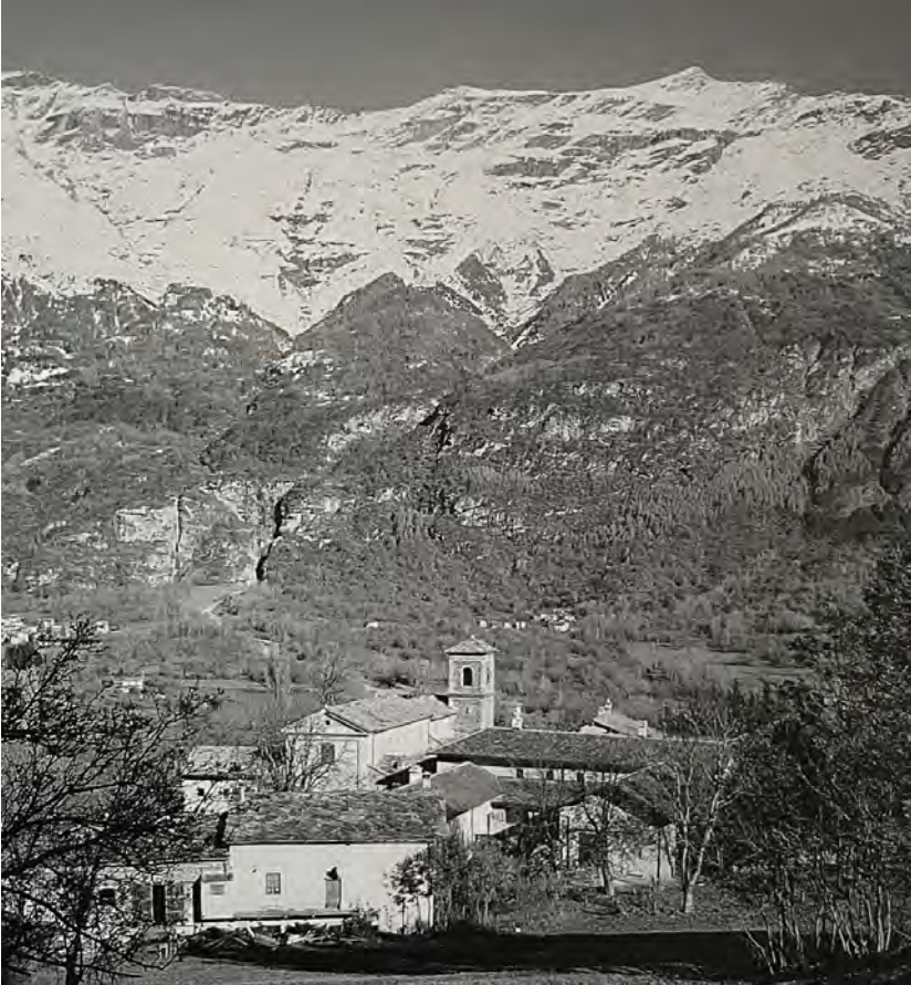
Fig. 1. Il complesso abbaziale e il suo contesto, da CERRI, 2004, p. 111.

del XIX secolo e diretti dalla figura carismatica di Alfredo D'Andrade, iniziative che si protrarranno con una certa intensità sino al periodo appena successivo alla seconda guerra mondiale. Alle attività di ricerca e studio del patrimonio condotte in sede locale, i cui esiti convergono nel 1972 nella mostra Arte Sacra in Valle di Susa , quindi strutturati e consolidati nell'esposizione, Valle di Susa. Arte e Storia dall'XI al XVIII secolo curata da Giovanni Romano nel 1977 a Torino 5 , coincide un periodo particolarmente fortunato e ricco di interventi sul patrimonio che però vede un calo di interesse nei successivi anni ottanta e novanta.