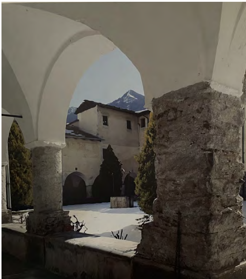
Fig. 3. Scorcio del chiostro dell'abbazia, da CERRI, 2004, p. 167.

cellula monastica novalicense dei benedettini, che nel lungo periodo di recupero del complesso abbaziale si è consolidata, sviluppando attività quali il laboratorio per il restauro di libri e documenti antichi. L'attività dei monaci e la vita in convento si è sviluppata in trenta anni segnati da importanti e articolati interventi di restauro e adeguamento del complesso abbaziale, sino alla fine degli anni novanta del Novecento, opere completate solo nel 2009 con l'apertura del Museo Archeologico.