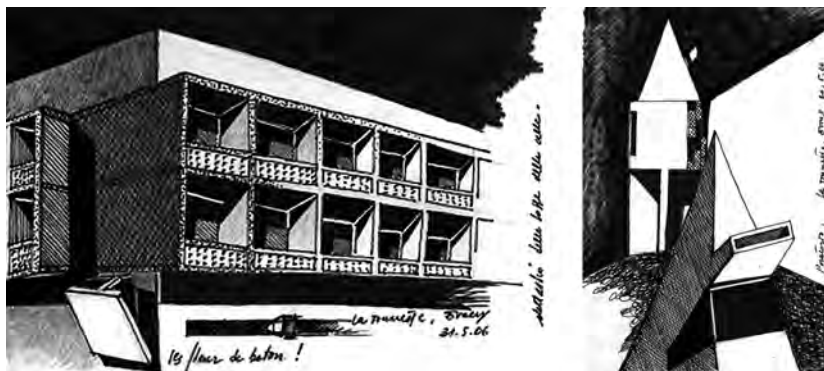
Fig. 1. Studi dal vero del Convento di Santa Maria de La Tourette a Eveux di Le Corbusier (elaborazione dell'autore, maggio 2006).

spirituale bensì il lavoro dello spirito . Il convento di Sainte Marie della Tourette non rappresenta una caricatura del linguaggio tradizionale, non è una facies moderna delle forme del passato. Esprime, piuttosto, una sequenza di spazialità innovative, derivate da modelli tipologici studiati e selezionati in linea con i principi di povertà e semplicità dell'Ordine, nel quale il riferimento brutalista ha senz'altro accentuato l'evoluzione del tipo di riferimento. Attraverso un tour de force tecnico ed intellettuale Le Corbusier discioglie quel modello nello spirito della modernità dove peraltro risiede quell'ambizione di universalità che, credo, ha fatto di quest'opera una delle principali ossessioni dei miei maestri Carlo Aymonino e Raffaele Panella.