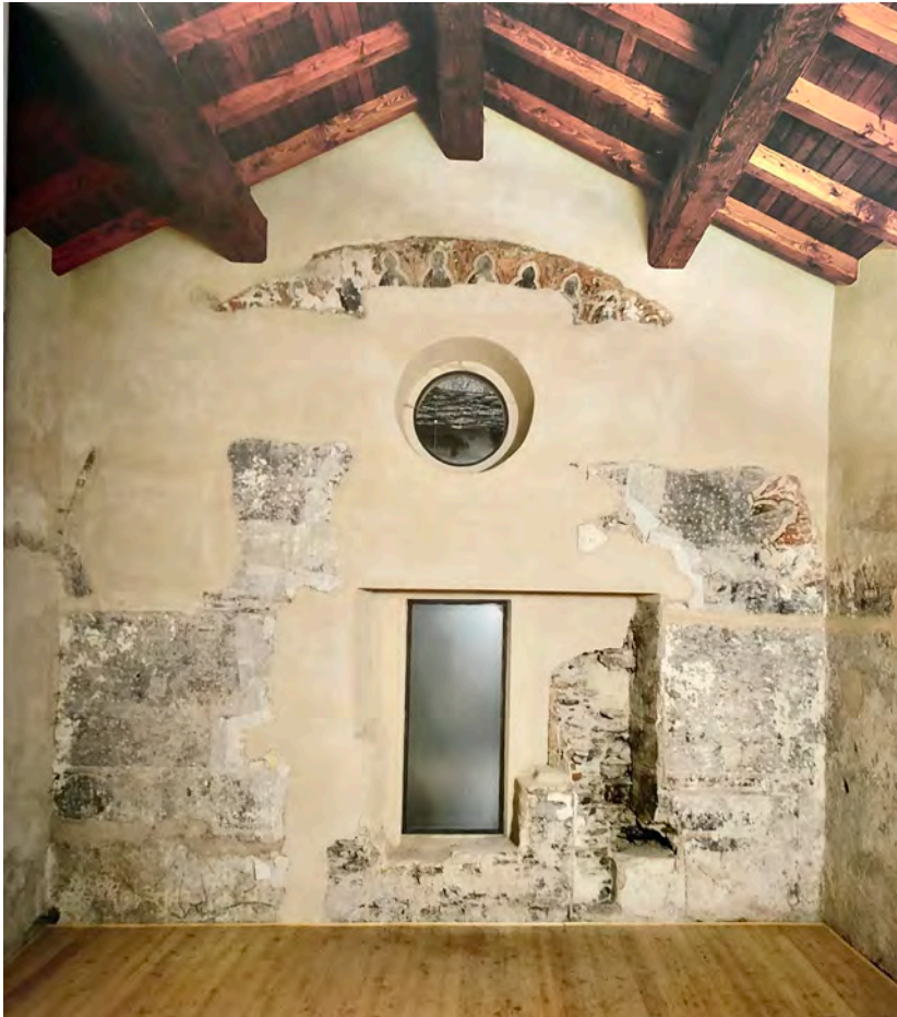
Fig. 6. Vista interna della Camera stellata, durante le opere di restauro pittorico (in CERRI 2004, p. 145).

La vera cerniera su cui si imposta l'intervento generale è però il cosiddetto "palazzo abbaziale", volume di collegamento tra il monastero e il contesto esterno. Questi ambienti prima dell'intervento risultavano del tutto inutilizzati o adibiti a funzioni improprie nonostante caratterizzati da una sequenza di ambienti voltati e dalla galleria aperta verso il cortile al piano terreno e da altrettanti volumi al piano primo. Grazie ai risultati della indagine archeologica condotta, e alla realizzazione di una campagna di saggi stratigrafici sulle superfici che ha permesso il restauro e la comprensione di un'ampia testimonianza dell'intero impianto decorativo attestato tra XIII-XIV