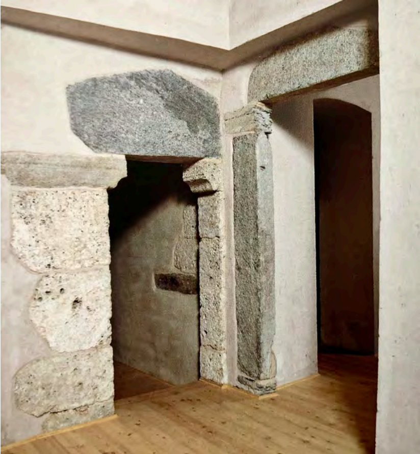
Fig. 5. Abbazia di Novalesa (TO), passaggi interni alla sala biblioteca (in CERRI 2004, p. 156).

le stesse cappelle) rispetto all'insieme architettonico del complesso fu una costante nella storia della tutela dell'abbazia, che condusse ai primi riconoscimenti ufficiali di interesse parziali e molto selettivi all'interno dello stesso monastero (Figure 4, 5). La cronaca della corrispondenza fra la Soprintendenza ai Monumenti del Piemonte e la proprietà dell'abbazia tra l'inizio degli anni sessanta del Novecento sino alla fine degli anni settanta evidenzia un equivoco ricorrente: mentre la Soprintendenza riconosceva infatti meritevole di tutela l'intero insieme dell'abbazia, l'ente proprietario era propenso ad attribuire valore storico e architettonico solo a talune emergenze quali la chiesa e le cappelle nel parco. Nel 1969 viene emanata una declaratoria di