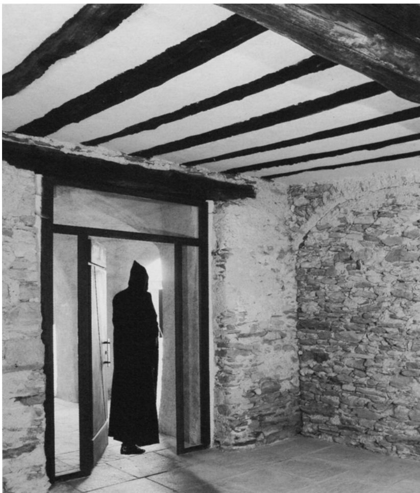
Fig. 4. Abbazia di Novalesa (TO), locale al piano terreno (foto di G. Fino, in CERRI 2004, p. 122).

a promuoverne la valorizzazione e conoscenza ai visitatori esterni, a renderla viva con la loro presenza e le loro attività, contribuisce alla tutela dell'identità dei luoghi che a Novalesa è ancora fortemente riconoscibile.