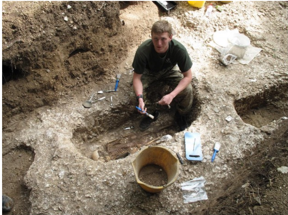
Fig. 2. Militari coinvolti in scavi archeologici all'interno del progetto Operation Nightingale promosso dalla Società Wessex Archaeology. www.wessexarch.co.uk