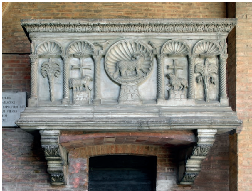
Fig. 8 - Padova, Basilica di S. Antonio, chiostro del Capitolo: la tomba della famiglia Bebi.

romani che mostrano un sostanziale rigore nelle ripartizioni architettoniche, sempre comprese in rigide simmetrie.