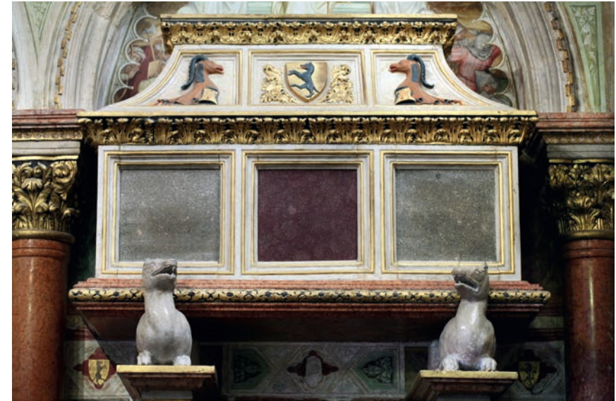
Fig. 10 - Padova, Basilica di S. Antonio: la tomba di Bonifacio Lupi di Soragna.