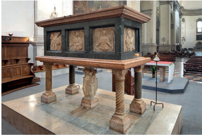
Fig. 2 - Padova, Basilica di S. Giustina: l'arca di San Luca.

plice concezione affida alle grandi lastre oltre che quella decorativa e simbolica, anche la funzione strutturale 7 . Va evidenziato inoltre che gli elementi in bigio antico, costituiscono anche i pilastri angolari di sostegno a cui si ancorano le lastre in un sistema di collaborazione. Si tratta probabilmente di un vero prototipo di valore generale, e di specifico modello anche per alcuni sarcofagi sorretti da mensole come quelli di Guido da Lozzo e della famiglia Bebi, su cui si tornerà a breve.