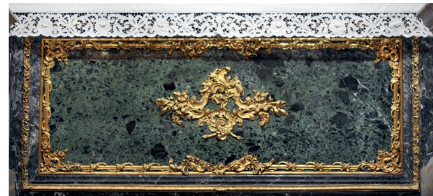
Fig. 1 - Padova, Basilica di S. Antonio: fronte dell'altare del Santo.

Da tempo, il prototipo dei sarcofagi ad arca trecenteschi dell'area veneta è stato riconosciuto in quello del Santo, nel suo aspetto medievale datato al 1263, oggi leggibile in maniera molto parziale 4 . È utile qui provare a entrare in qualche dettaglio tecnico. L'arca del Santo (fig. 1) è stata integralmente realizzata con materiali antichi rilavorati e riassemblati. L'impostazione è quella della cassa rialzata, sostenuta da colonnine e cariatidi. La cassa appare poi realizzata con grandi lastre in marmo verde antico 5 , integrate da porzioni in marmo bianco, incorniciate da elementi allungati e modanati, in marmo bigio antico 6 . Una struttura di così sem-