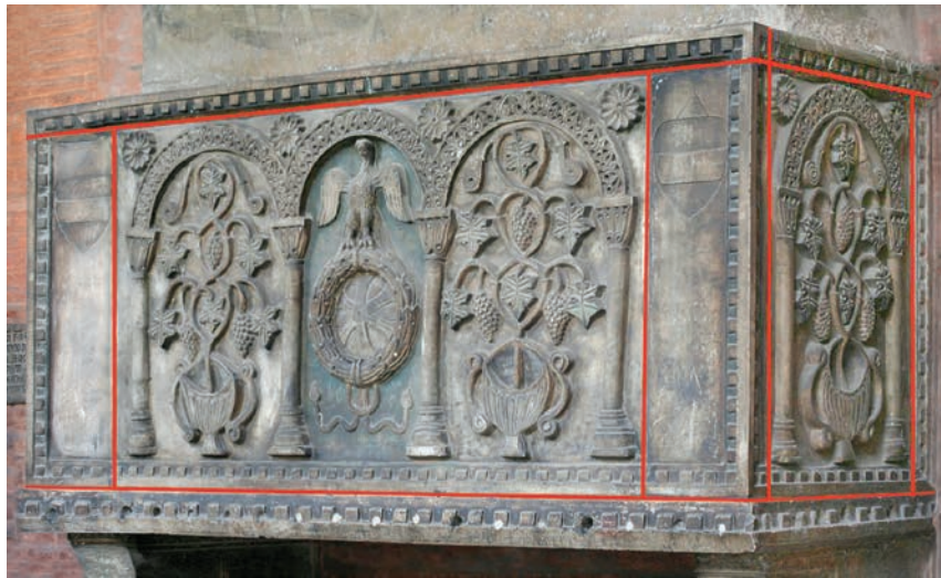
Fig. 7a - La tomba di Guido da Lozzo, schema costruttivo.

Nel monumento funebre di Guido da Lozzo 18 , il sarcofago, al di là di un'apparenza monolitica, è composto di nove diversi elementi marmorei (fig. 7). La disposizione degli elementi lapidei, distinguibili nelle diverse forme e funzioni di lastre e cornici, è tecnicamente analoga a quella dell'arca del Santo (fig. 7a). Questo nonostante le differenze evidentemente palesi: l'arca del Santo è interamente aniconica, mentre questa è integralmente scolpita a rilievo, quella del Santo è realizzata in preziosi marmi colorati mentre questa è in elementi, sempre antichi ma rigorosamente bianchi e dalle superfici dipinte con colori vivi. Le due casse mostrano, in sintesi, la medesima impostazione costruttiva.