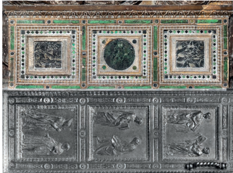
Fig. 14 - Confronto tra il sarcofago della Deposizione di Donatello e una delle ante della Porta degli Apostoli fusa da Donatello per la Sacrestia vecchia di San Lorenzo a Firenze.