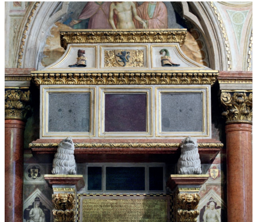
Fig. 11 - Padova, Basilica di S. Antonio: la tomba de Rossi.