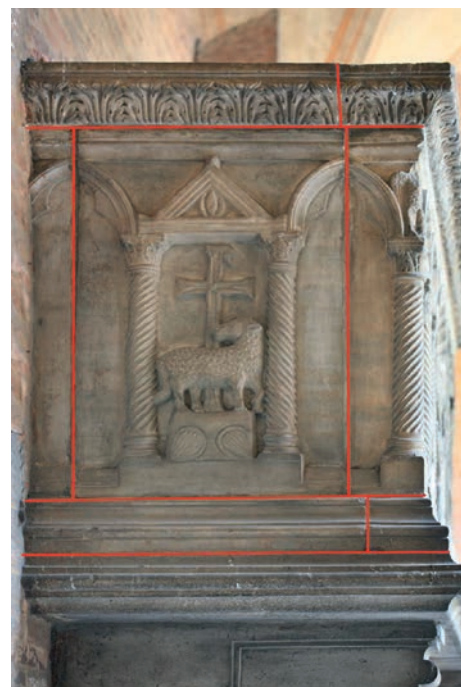
Fig. 8a - La tomba della famiglia Bebi, schema costruttivo.