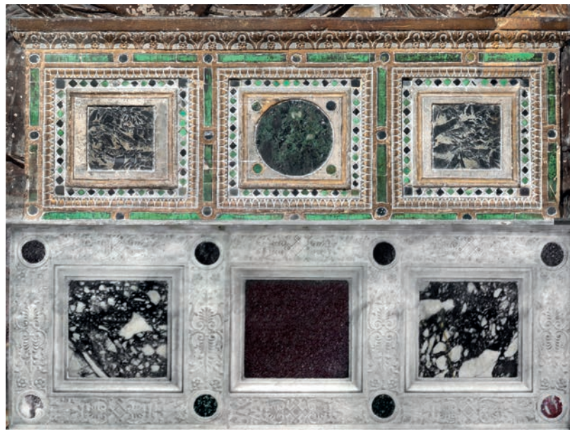
Fig. 15 - Confronto tra il sarcofago della Deposizione di Donatello e l'arca di San Felice.

integralmente rinnovata, in tutte le sue parti fatta eccezione per la sola arca, in quegli stessi anni e da parte delle medesime maestranze, il nostro altare potrebbe rappresentarne il perfetto completamento architettonico in forma di nuova e preziosa arca del Santo.