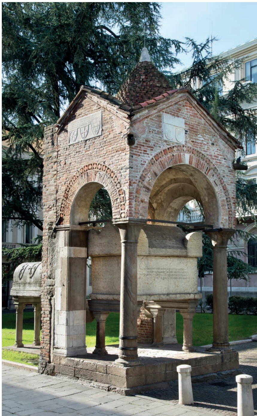
Fig. 4 - Padova, Piazza Antenore: la cosiddetta "Tomba di Antenor" .