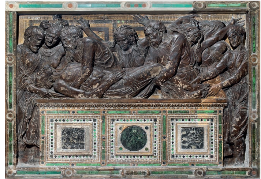
Fig. 13 - Padova, Basilica di S. Antonio, altare maggiore, Donatello: Deposizione .

(fig. 13). La forma di tale sarcofago è, a sua volta, l'esito della trasposizione lapidea dell'identico schema geometrico messo a punto, un decennio prima, dallo stesso Donatello per l'intelaiatura delle porte bronzee degli Apostoli e dei Martiri nella Sacrestia Vecchia di San Lorenzo a Firenze 29 (fig. 14). L'analogia relativa alla forma del sarcofago della Deposizione di Donatello poi, non si limita alla sola questione geometrica ma, per la scelta dei materiali utilizzati, può definirsi anche architettonica. Sulla fronte del nostro altare sono infatti incastonate tre lucide lastre di pietre antiche che nell'impaginato, con particolare attenzione alle due formelle laterali in pavonazzetto scuro, rimanda compositivamente senza equivoco alle corrispettive donatelliane in marmor celticum o breccia bianca e nera di Aquitania (fig. 15).