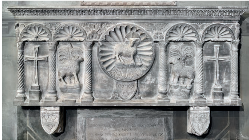
Fig. 9 - Padova, Basilica di S. Antonio, cappella di S. Leopoldo, già S. Giovanni: la tomba di Aicardino e di Alvarotto degli Avarotti.