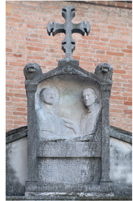
Fig. 6 - La tomba di Rolando da Piazzola, particolare.

La stele romana rilavorata, posta in cima all'edicola a baldacchino che sovrasta il sarcofago (fig. 6) è invece in pietra di Aurisina, uno dei materiali più diffusamente riconoscibili nelle stele di area veneta; non un vero e proprio marmo, ma certamente, insieme alla pietra d'Istria delle cave di Orsera, uno tra i materiali di maggior pregio dell'area che per tale motivo ha viaggiato, insieme alla trachite, quasi ovunque nel nord Italia 17 .