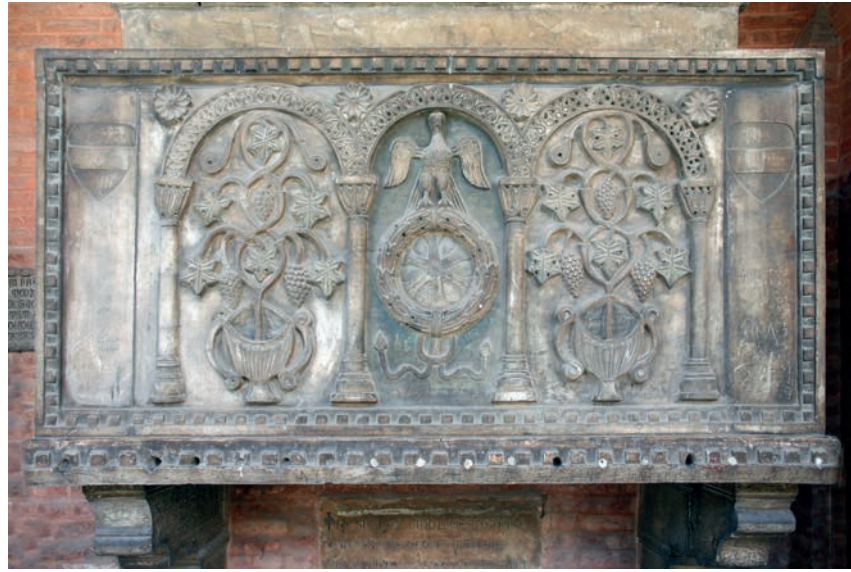
Fig. 7 - Padova, Basilica di S. Antonio, chiostro del Capitolo: la tomba di Guido da Lozzo.