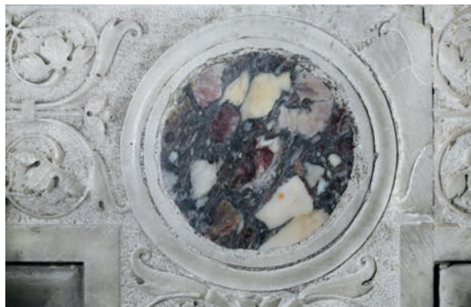
Fig. 12b - L'arca di San Felice , particolare.