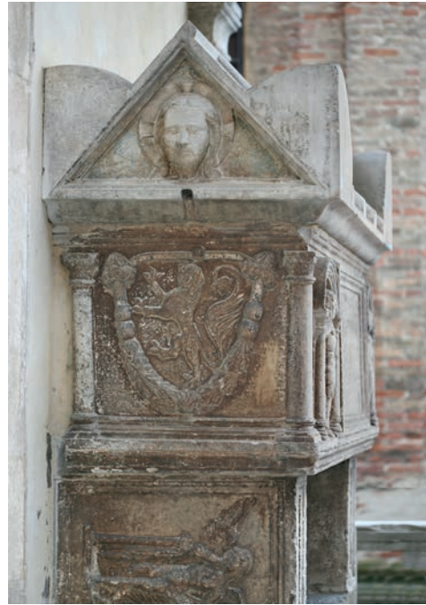
Fig. 5a - La tomba di Rolando da Piazzola, particolare.