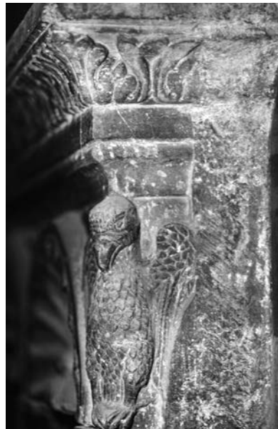
Fig. 9a - La tomba di Aicardino e di Alvarotto degli Avarotti, particolare.

il fatto che, sui brevi risvolti laterali di entrambi gli elementi lapidei, la lavorazione si esaurisca, passando, in pochi centimetri, da una perfetta finitura a superfici grezze o semplicemente sbazzate (fig. 9a). Pur nell'integrale rilavorazione di elementi marmorei antichi, la scelta di non realizzare una cassa nella sua interezza, riportando la rappresentazione alla più semplice forma bidimensionale, ha evitato la realizzazione della complessa e certamente costosa struttura di sostegno descritta nei casi del monumento Bebi e di quello di Guido da Lozzo.