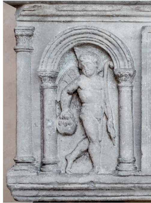
Fig. 5b - La tomba di Rolando da Piazzola, particolare.

ti si possono a tutti gli effetti considerare come piccole architetture in pietra confrontabili, per tecnica di realizzazione, con le finestre gotiche di tipo nordico realizzate in pietra traforata. Al posto dei vetri colorati troviamo qui analoghe campiture di preziose pietre antiche lucidate. In tali manufatti è evidente una speciale attenzione ai particolari che si può osservare nel dettaglio dei giunti, non sempre facili da individuare 13 .