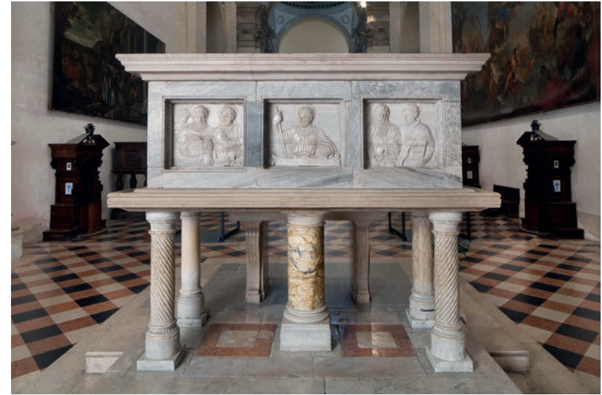
Fig. 3 - Padova, Basilica di S. Giustina: l'arca di San Mattia.

tante e funzionale anche a sostenere pannelli lapidei di dimensioni ricorrenti 10 .