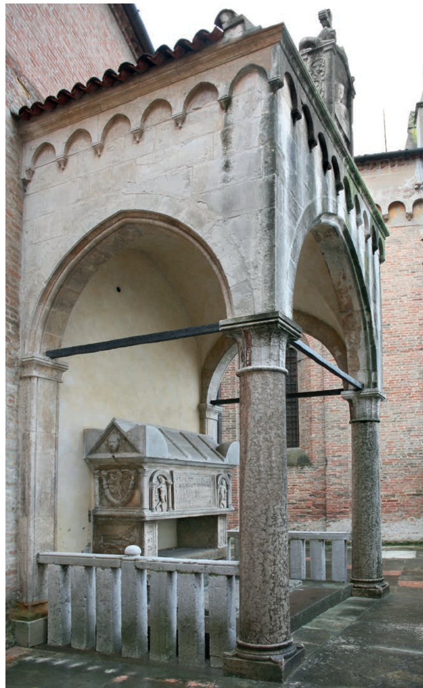
Fig. 5 - Padova, sagrato della Basilica di S. Antonio: la tomba di Rolando da Piazzola .