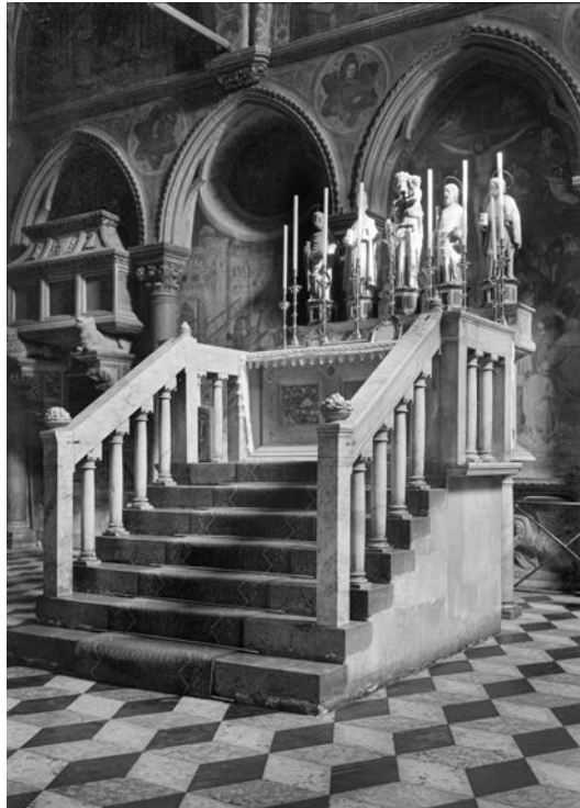
Fig. 12 - Padova, Basilica di S. Antonio, cappella di S. Felice, veduta anteriore al rifacimento dell'altare in una fotografia d'epoca: l'arca di San Felice.