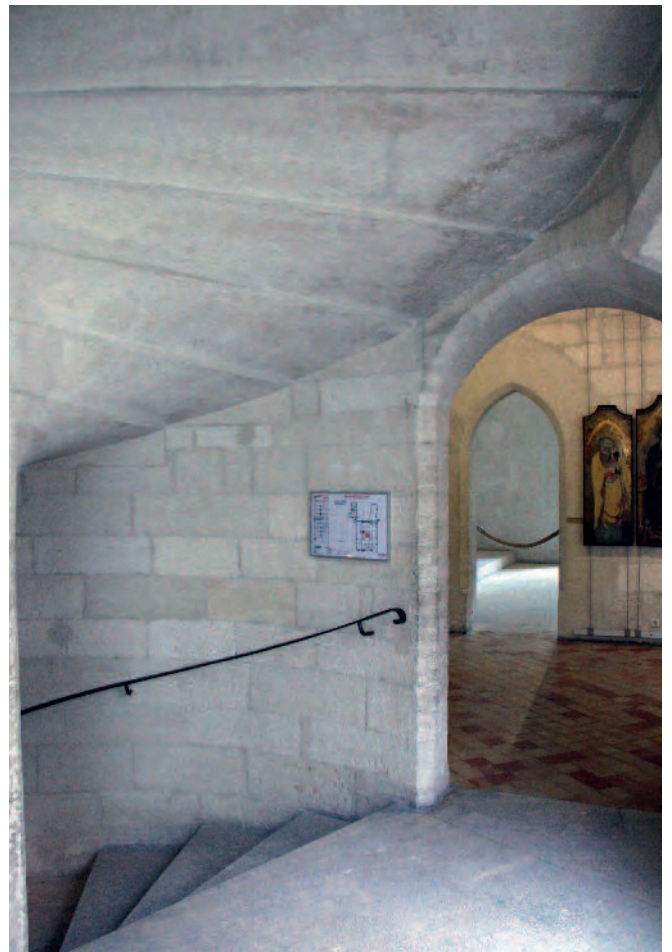
Fig. 5. Avignone. Petit Palais, interno della torre scala.