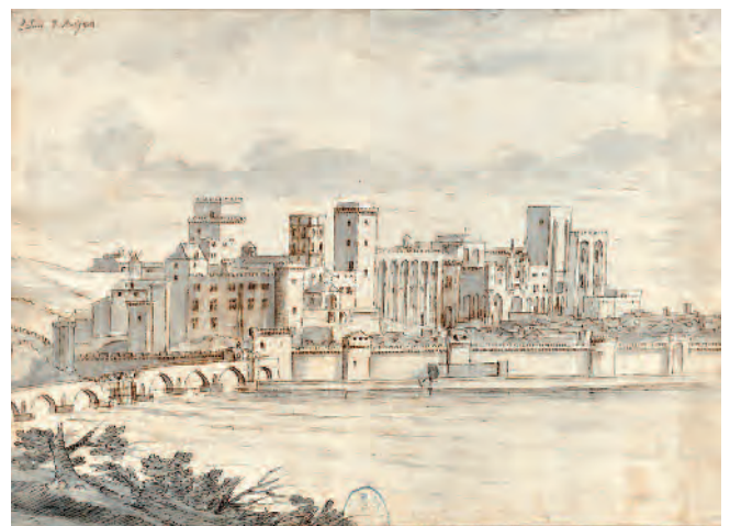
Fig. 9. Avignone. Petit Palais, torre circolare, facciata ovest e parte di quella sud in un disegno dell'Album Laincel. Avignone, Bibliothèque Municipale, Musée Calvet.

La facciata è conclusa da due torrette pensili esito di reintegri