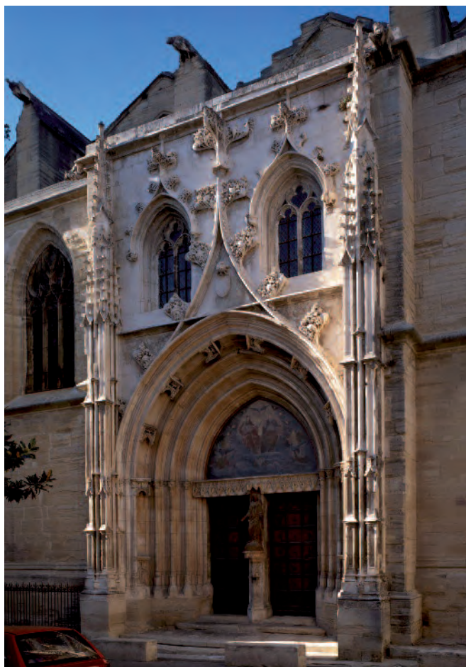
Fig. 6. Carpentras. Chiesa di Saint-Siffrein, Porta Juve.

La ricostruzione attuata da Giuliano della Rovere attira l'attenzione di alcuni visitatori che si recano ad Avignone per motivi diversi nei primi decenni del XVI secolo 22 . Antonio de Beatis, segretario personale del cardinale Luigi d'Aragona, lo accompagna nei numerosi viaggi tra Germania, Svizzera,