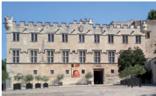
Fig. 12. Avignone, Petit Palais , facciata sud.

latina, così come si riscontrano anche sui prospetti del castello di Tarascona nella parte dell'ampliamento voluto dal re Renato. Questo tipo risulta essere quello di maggiore diffusione anche in contesti geograficamente non così vicini, ma prossimi per ambiti culturali e di committenza. Ad esempio lo si incontra a Roma nel palazzo Della Rovere e nel più tardo palazzo di San Pietro in Vincoli per rimanere allo stesso ambito familiare, ma anche in palazzo Barbo-Venezia