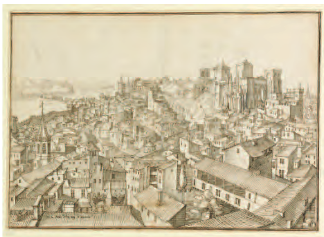
Fig. 8. De la ville d'Avignon et par dela: Veüe de la Ville d'Avignon et des Environs , Martellange, Étienne (1569-1641), 1608, (Parigi, Bibliothèque nationale de France, Département Estampes et Photographie, Fonds des dessins d'Étienne Martellange), torre circolare del Petit Palais costruita da Giuliano della Rovere.

I lavori della prima fase al Petit Palais si incentrano in particolar modo sulla ricostruzione del fronte principale a sud; la scelta di demolire la facciata trecentesca, in affaccio verso la piazza del Palais du Papes è segno evidente della volontà di applicare i nuovi canoni del costruire che tendono a ordinare i fronti sovrapponendo o, come in questo caso, sostituendo l'affaccio verso la città con un nuovo prospetto regolato nelle scansioni delle aperture e degli spazi. Parti del muro più antico sono state rinvenute durante gli ultimi restauri, documentando un avanzamento della linea di facciata nel progetto di fine secolo [fig. 8].