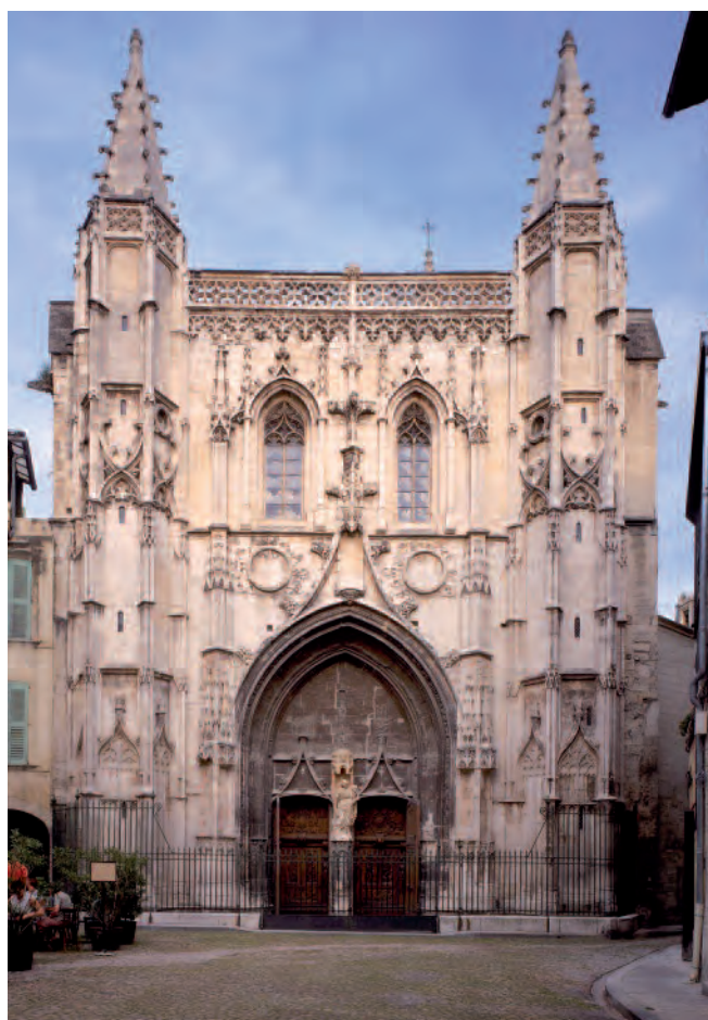
Fig. 7. Avignone. Chiesa di Saint-Pierre, portale.