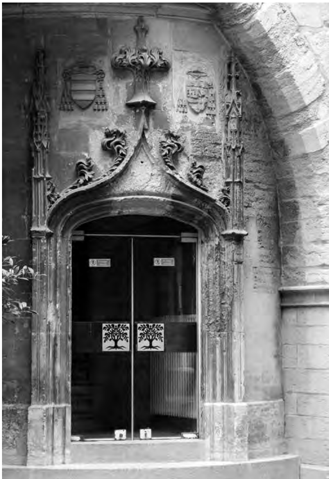
Fig. 4. Avignone. Petit Palais, portale della torre scala sulla corte.