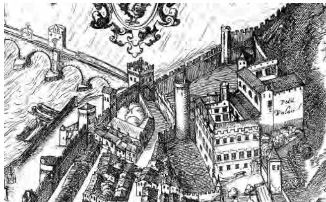
Fig. 10. Avignone. Petit Palais, prospetti sud e ovest con la torre circolare esterna; si nota anche la torre scala emergere dal fabbricato.

Il prospetto ovest dell'edificio segue la regolarità formale della facciata principale con l'adozione dello stesso modello per le