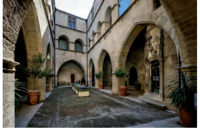
Fig. 3. Avignone. Petit Palais, corte interna con gli interventi di Alain de Coëtivy sul primitivo impianto trecentesco.

La torre scalare ha un diametro di 3,5 metri e un'altezza di circa 22 metri ad esclusione dei merli aggiunti successivamente. La torre circolare emerge dal corpo del fabbricato e si conclude al