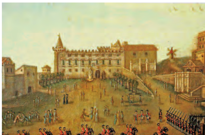
Fig. 13. Avignone. Petit Palais , le campate aggiunte sulla facciata sud sono rappresentate nel quadro di Claude-Marie Gordot, Vue de la place du Palais, avec cortège d'un Vice-Lègat [...] (Avignone, Musée Calvet, [1766]).