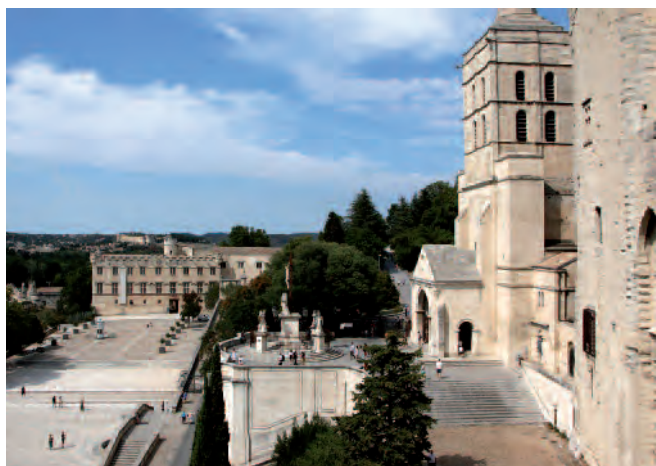
Fig. 1. Avignone. Petit Palais, visto dalla terrazza del palazzo dei Papi.