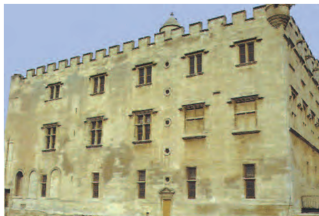
Fig. 14. Avignone. Petit Palais , prospetto ovest