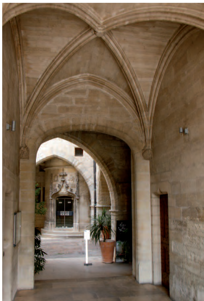
Fig. 15. Avignone. Petit Palais , vestibolo di accesso al palazzo con crociere costolonate su mensole figurate.