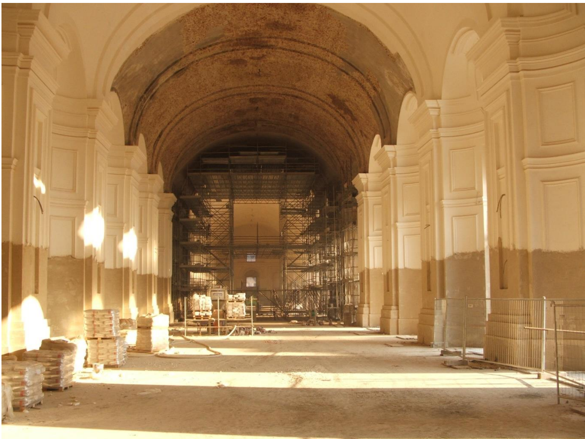
Venaria Reale (Turin), Castle. The Orangerie (Filippo Juvarra 1722) during restoration

In 2006 the Queen's Villa and its beautiful Italian gardens were re-opened, but the biggest work was the complete rehabilitation of the huge complex of Venaria Reale (the name means Royal Hunting), one of the most important restoration works in Europe, lasted from 1998 to 2007 thanks to European, Regional and National funds. It's a case study of "best practices": before restoring many investigation and research group were formed, by many different professionals (architects, engineers, art historians, architecture historians, chemists, etc...) to "scan" the building and the archival sources and plan the best restoration, daily monitored by the conservation authorities in a continuous feedback with these groups. This complex of buildings, after one century and half of misuse as a barrack and other fifty years of abandon laid in disrepair, in a very poor condition, almost in ruin. After the reopening of 2007 it became the fifth museum in Italy according to the number of visitors, before the last pandemic. Today the complex hosts the Palace with the apartments and many exhibition areas to different scales (2 km of visiting tour), a top-level restaurant, the Conservation and Restoration center for artworks, the great gardens (reconstructed 60 hectares out of 125).