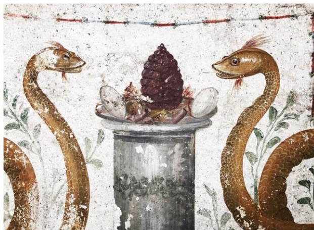
Figura 3. Domus della Regio V di Pompei, dettaglio serpenti.

Il Genius Loci , come ogni entità geniale, era considerata come una divinità a tutti gli effetti e come tale, secondo la concezione romana, poteva essere di genere femminile o maschile. Il fatto che venissero rappresentate due serpi con tratti fisici e cromatici ben distinti dimostra l'incertezza circa il genus ( Sesso ) della divinità geniale del luogo. Sono due le ragioni possibili per cui il Genius veniva raffigurato in questo modo: per precauzione o per richiedere assistenza e protezione a entrambi.