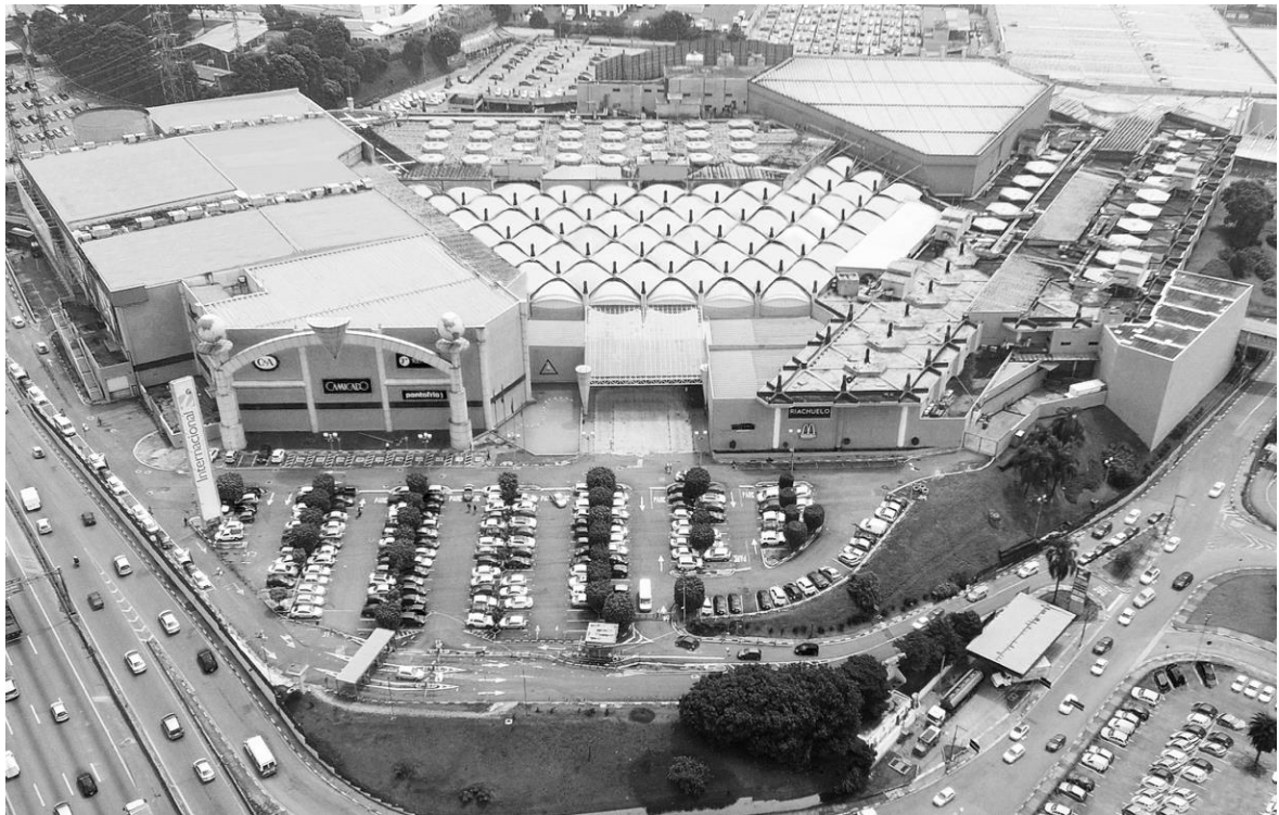
Figure 4. - Foto aérea do Internacional Shopping Guarulhos, resultado da transformação da fábrica Olivetti, 2017

No Brasil, após o seu desmantelamento, a fábrica da Olivetti em Guarulhos foi vendida em 1997 para ser transformada no International Shopping de Guarulhos, que abriu no final do ano seguinte. O projecto envolveu inicialmente a demolição completa do edifício e a construção de um novo conjunto. Uma vez conhecidas as informações sobre a demolição da antiga fábrica da Olivetti e a construção de um centro comercial, alguns arquitectos e professores da FAU-USP, Faculdade de Arquitectura e Urbanismo da Universidade de São Paulo, apresentada ao CONDEPHAAT - Conselho de Defesa do Património Histórico, Arqueológico, Artístico e Turístico do Estado de São Paulo - uma petição, também assinada por personalidades de renome do panorama arquitectónico brasileiro, incluindo Paulo Mendes da Rocha e Marcelo Suzuki. Apesar da lentidão burocrática associada ao órgão governamental, Carlos Henrique Heck, na altura Presidente da CONDEPHAAT, conseguiu ter um processo para a preservação da fábrica e a sua inclusão na Lista do Património Histórico Arquitectónico e Cultural aberto em apenas