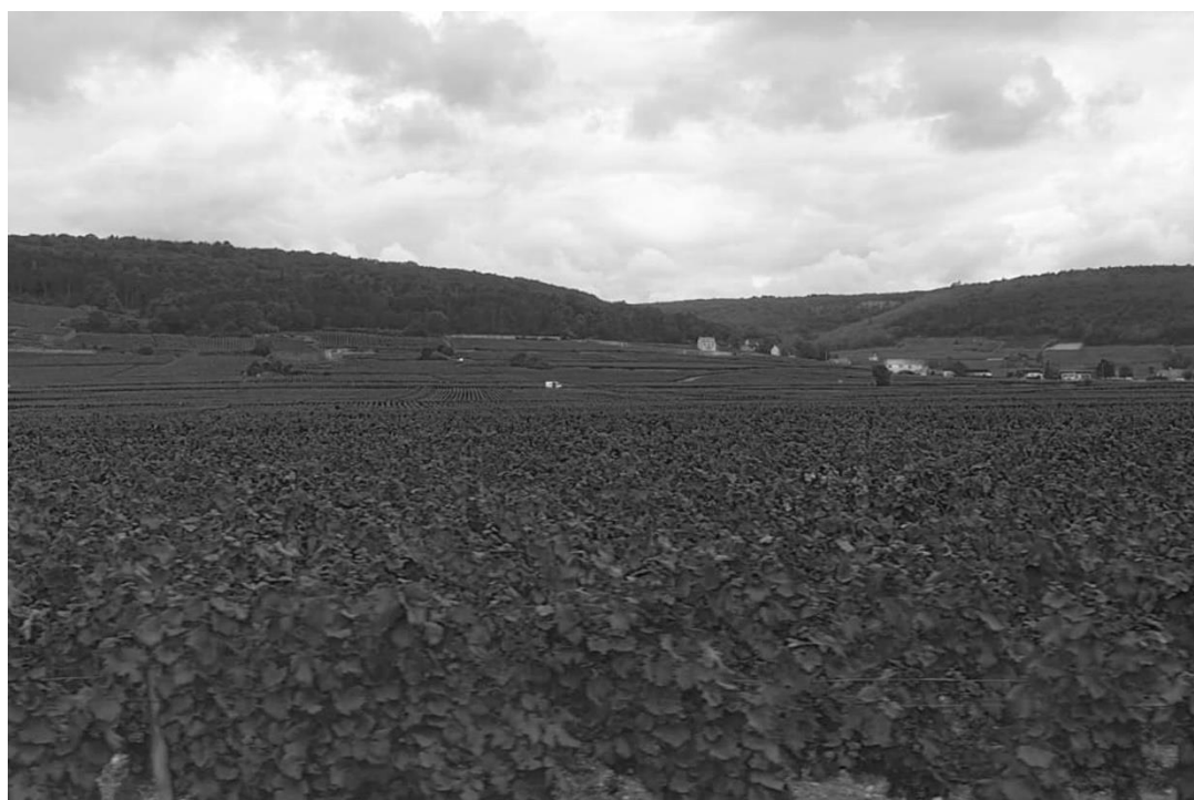
Figure 3. I Climats di Borgogna

quelli legati alla commercializzazione dei vini, come le città e i negozi storici. Tra le principali architetture minori rurali troviamo i cabotes , edifici costruiti in pietre a secco disseminati nei vigneti e utilizzati come deposito per gli attrezzi o come riparo per il viticoltore contro il maltempo. I meurgers , ovvero cumuli di pietre che definiscono il confine dei Climats , derivanti dal disboscamento effettuato dai viticoltori per preparare il terreno alla coltivazione e provvedere al suo contenimento, allo smorzamento dei pendii e al deflusso dell'acqua piovana. I murets , ovvero muri antichi che accentuano i confini delle perimetrazioni e sono utilizzati per combattere l'erosione del suolo e limitare i danni causati dagli animali e dagli uomini. Ed infine, i clos , ovvero elementi rurali destinati a proteggere le viti andando a definire un vigneto chiuso, che sono circondati dai murets e creati sotto l'impulso delle abbazie cistercensi durante il X secolo e delle abbazie cluniacensi durante il XI secolo. (UNESCO, Les Climats du vignoble de Bourgogne, 2017) [12]