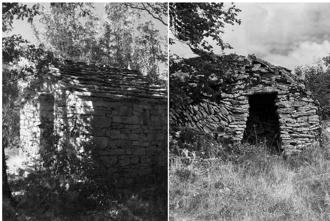
Figure 3. I casòt piemontesi e i cabotes borgognesi