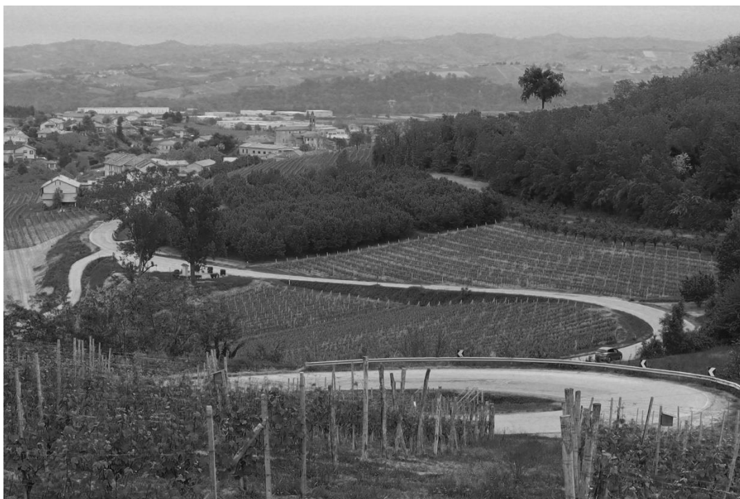
Figure 1. I paesaggi vitivinicoli delle Langhe- Roero e Monferrato

dell'Umanità. (Associazione per il patrimonio dei Paesaggi vitivinicoli di Langhe Roero e Monferrato, 2015) [11]