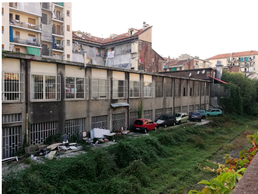
Tratto urbano dismesso e in attesa del trincerino ferroviario Torino - Ceres, visibile lungo via Saint Bon nel quartiere Aurora (Torino), residuo di quel processo di sfruttamento antropico e di trasformazione del territorio.