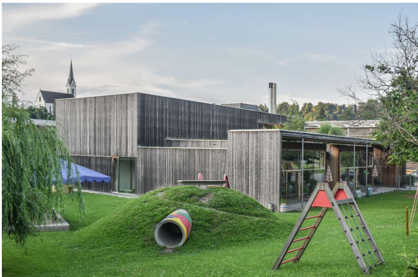
Figg. 12-13 Centro comunitario a Blons, Bruno Spagolla, 2004.