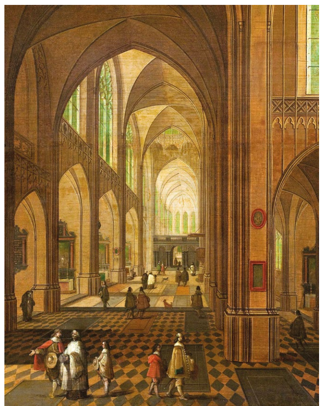
fig. 5 – PEETER NEEFS IL VECCHIO, Interno di chiesa , olio su tavola, Paris, Petit Palais (riproduzione con licenza CC0 Paris Musées / Petit Palais, musée des Beaux-Arts de la Ville de Paris).

c) valore memoriale sacramentale : la memoria personale dei sacramenti più "sociali" (battesimo e cresima, matrimonio, ordine) assume una rilevanza forte per famiglie e clientele. Come forte elemento di radicamento conta dunque non solo il valore liturgico del sacramento in sé, ma soprattutto la memoria condivisa del sacramento, fissata sui luoghi celebrativi (l'altare davanti a cui la coppia si è unita in matrimonio o ha accompagnato i propri defunti al commiato, il fonte a cui ha battezzato i figli ecc.);