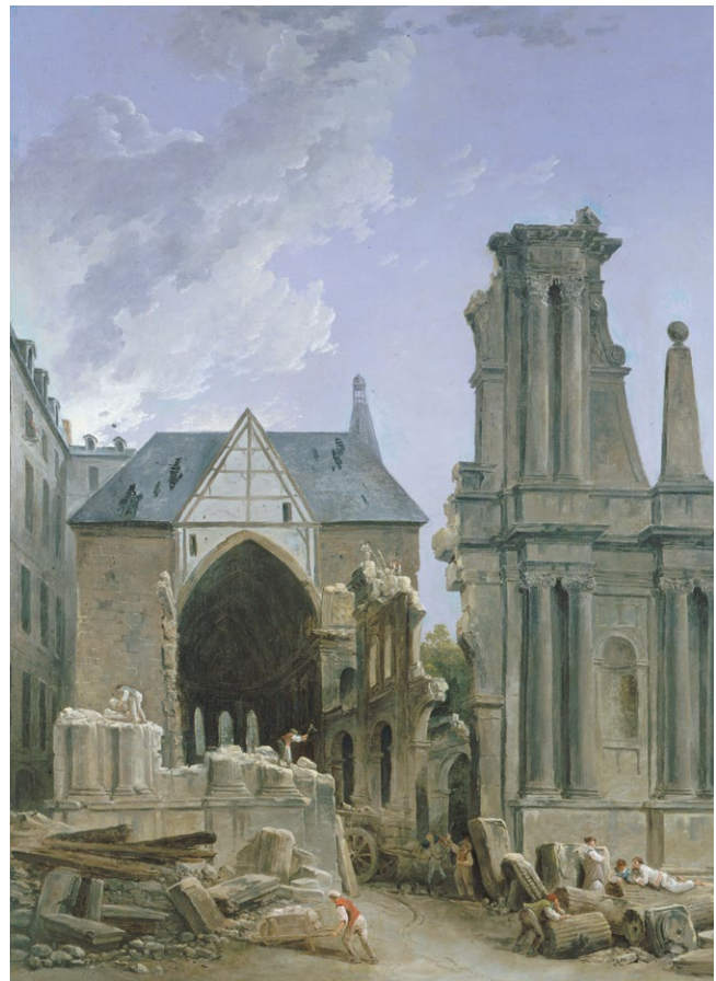
fig. 3 – HUBERT ROBERT, La chiesa dei Foglianti in demolizione , 1804 circa, olio su tela Paris, Musée Carnavalet (riproduzione con licenza CCO Paris Musées/Musée Carnavalet).