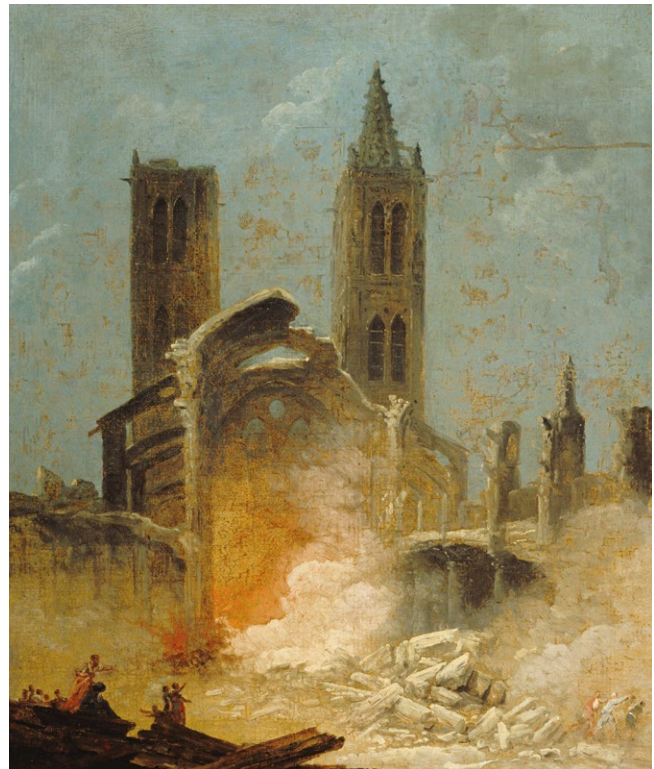
fig. 2 – HUBERT ROBERT, La demolizione della chiesa di Saint-Jean-en-Grève nel 1800 , 1800 circa, olio su tela, Paris, Musée Carnavalet.

L'ordine con cui sono presentati i valori inizia dai gesti fondativi (il raccogliersi della comunità per la celebrazione liturgica) e si allarga verso le dimensioni antropologiche e teologiche, aprendosi infine verso il territorio, inteso come spazio di apostolato, testimonianza, dialogo e impegno