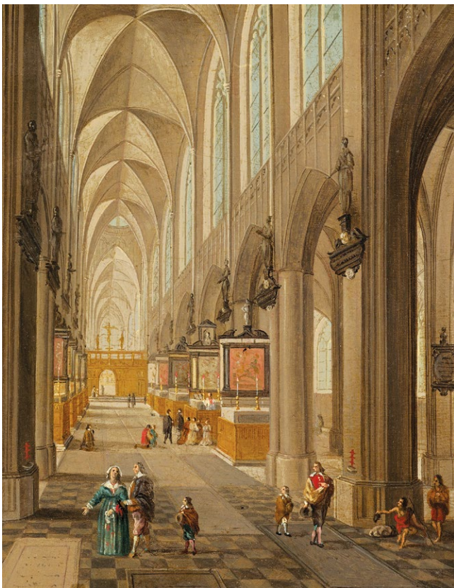
fig. 4 – PEETER NEEFS IL VECCHIO, La cattedrale di Anversa , 1650 circa, olio su rame, Washington, National Gallery (riproduzione con licenza CC0).

sociale. La sequenza non implica una gerarchia o una priorità di valori, né prefigura per ora un vero e proprio statement of significance operativo per la spazializzazione dei valori, ma è una lista aperta al dibattito, ordinata in modo narrativo.