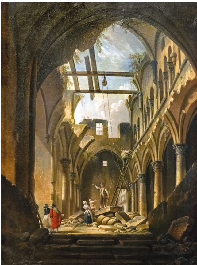
fig. 1 – PIERRE ANTOINE DEMACHY, Rovine dell'interno della chiesa dei Santi Innocenti , 1787, olio su tela, Carcassonne, Musée des Beaux-Arts (riproduzione con licenza internazionale CC4.0).

bene ma che non si palesano in modo evidente, la cui ignoranza può determinare conflitti o malintesi nelle pratiche conservative, a detrimento della possibilità di salvaguardare la maggior parte dei significati culturali incorporati nella materia del bene stesso. Altri filoni di letteratura, tuttavia, sottolineano l'urgenza di indagare proprio il valore "intrinseco", inteso – con altra sfumatura lessicale – come