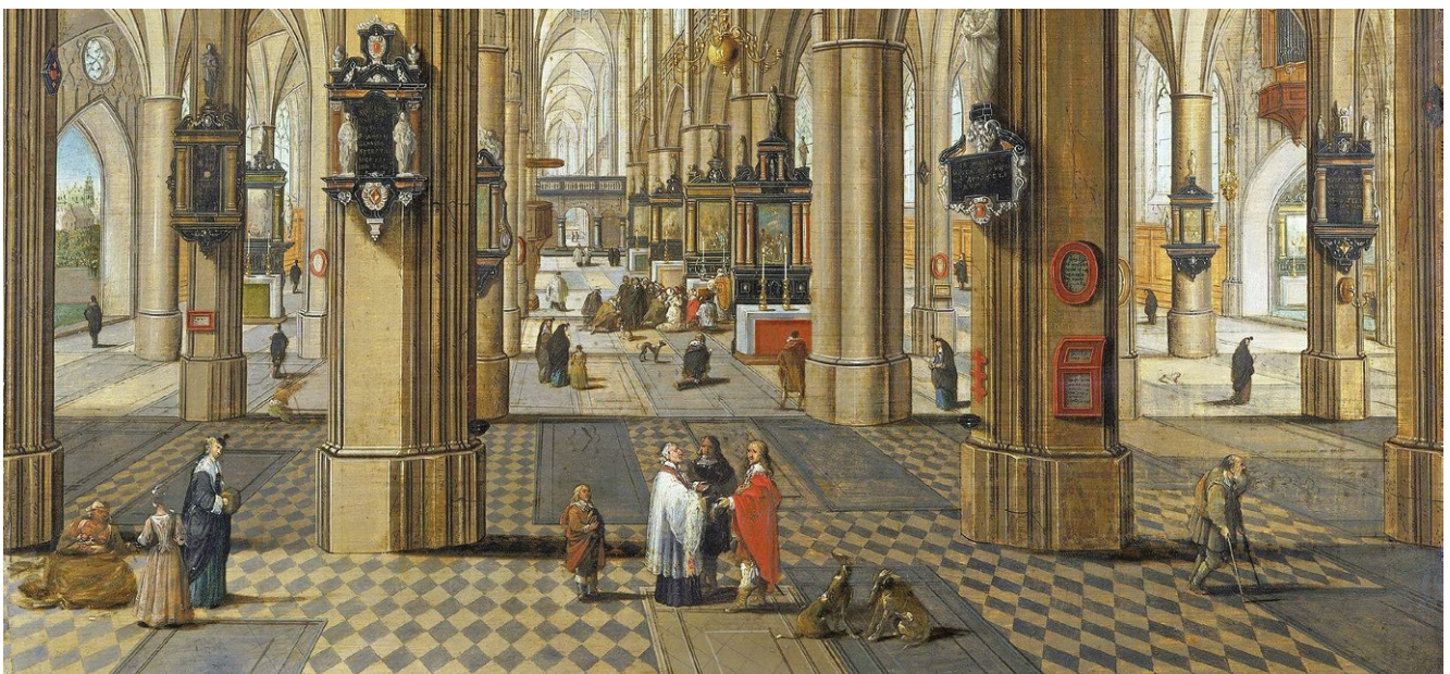
fig. 7 – PEETER NEEFS IL VECCHIO, Interno della cattedrale di Anversa , 1640 circa, olio su tavola, London, Victoria and Albert Museum.