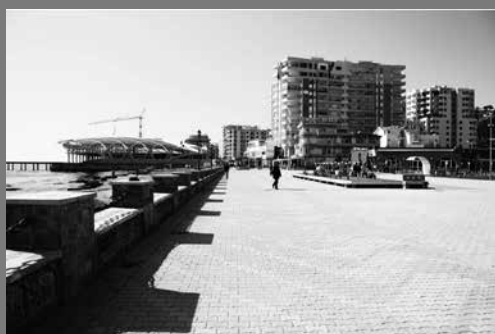
Lungo mare "Vollga"

La metamorfosi della città di Durazzo, avvenuta in pochi anni, rappresenta una delle conseguenze della transizione. Il periodo storico che ha coinvolto l'Albania è molto simile ad altri stati dell'ex blocco sovietico come l'Ungheria, la Polonia, la Repubblica Ceca e la Slovacchia.