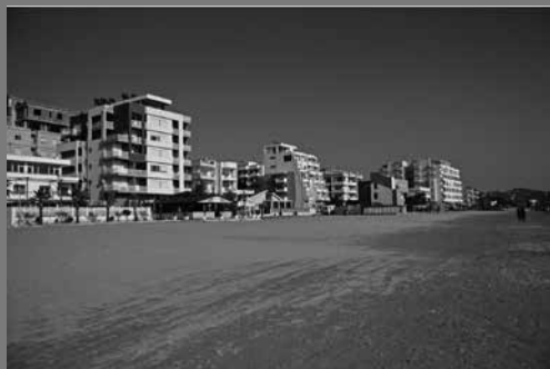
La città turistica, espansione negli ultimi vent'anni