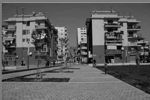
Riqualificazione di un quartiere comunista