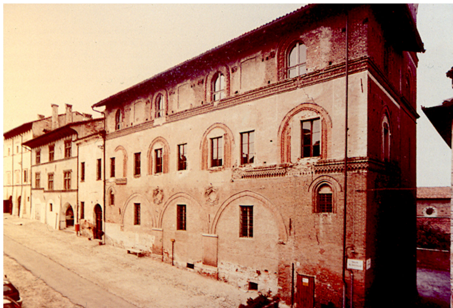
5. El Antiguo Palazzo Comunale , antes de las intervenciones de restauración