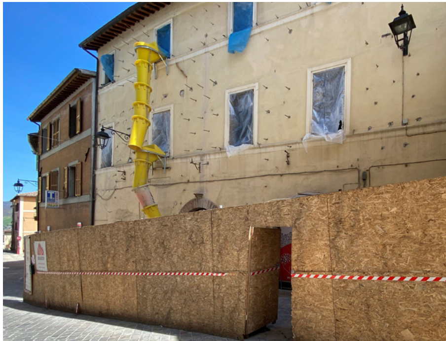
Fig. 4. Camerino, cantiere di un aggregato storico con visibili i "focchi" degli intonaci armati.

mizza nel vuoto, non da crollo ma da integrale demolizione, il campo è libero e tecnica e forma si confrontano sul terreno di una relativa tabula rasa . In questi casi la normativa impone stringenti vincoli alla progettazione, eppure la demolizione implica cancellazione, e la ricerca di una forma nuovamente completa di un borgo o di un centro storico difficilmente dialoga con una tecnica spesso limitata da ragioni economiche, di sicurezza e di competenza 16 .