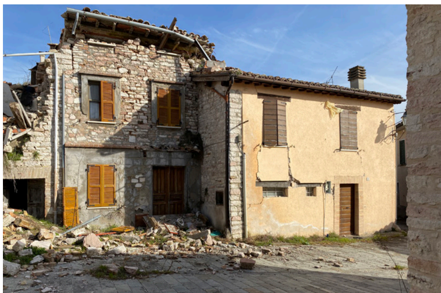
Fig. 6. Gabbiano, fabbricati a con finitura lapidea e ad intonaco (foto dell'A., 2022).

le, ormai sostituito da più agevoli metodi costruttivi. Tra le soluzioni al vaglio per la riproposizione materica lapidea si prospetta l'uso della pietra ricostruita, attraverso aziende specializzate nell'emulazione (perlomeno visiva) di finiture di facciata in pietra che garantiscono un effetto sufficientemente verosimile. Tale espediente riporta bruscamente a quanto già accennato sulle possibilità della tecnica in relazione alle necessità formali e figurative. È infatti sin troppo chiaro come questo procedimento costruttivo presenti importanti complessità sul piano progettuale tali per cui, partendo dalla demolizione dell'edificio in pietra, lo si ricostruisce in calcestruzzo armato per ragioni di sicurezza ed economia, eppure il campo formale ne richiede un aspetto simile se non identico a quello immediatamente precedente al sisma, ricorrendo a escamotages tecnologici di vario genere. «La questione dei limiti della tecnica – la necessità di ricercare una misura, una soglia oltre la quale lo sviluppo tecno-scientifico ed economico diviene controproduttivo» 19 è qui individuata nel suo scontrarsi con le ambizioni formali che ci si prefigge nella ricostruzione. La visione diffusa di un borgo come parte di un sistema territoriale e paesaggistico storicizzato è il vero obiettivo della ricostruzione, almeno da un determinato punto di vista.