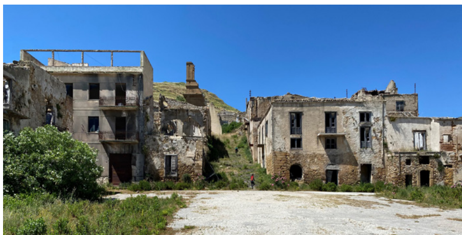
Fig. 2. Poggioreale, ruderi (foto dell'A., 2022).