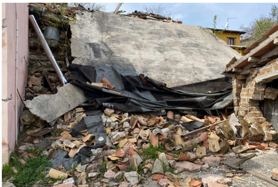
Fig. 3. Aschio, Visso (Macerata), crollo a seguito del sisma del 2016, accentuato da tecniche di consolidamento in calcestruzzo armato improprie (foto dell'A., 2022).

nale da Regione a Comuni, i quali, avvalendosi della consultazione alla cittadinanza, si indirizzarono principalmente verso il principio del “com’era dov’era” 10 . Da un punto di vista tecnico, molte delle decorazioni e perfino delle pietre (emblematico fu il caso del Duomo di Venzone) furono riutilizzate, tentando, dove possibile, l’anastilosi e la restituzione formale e materica degli insediamenti. La forma è in questo caso conseguenza di una scelta precisa che vede nella tecnica un mezzo per raggiungere un obiettivo intriso di una forte valenza memoriale e politica, atto a riproporre le atmosfere e le identità locali.