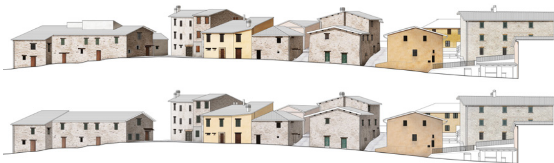
Fig. 8. Confronto tra gli elevati di Gabbiano precedenti al sisma (in alto) e la previsione da progetto del loro aspetto successivo alla ricostruzione (in basso). È evidente come si vogliano preservare i caratteri formali, materici e cromatici della borgata, con alcune, lievi, variazioni e razionalizzazioni (elaborazione Archliving, 2022)

corto circuito palpabile tra la visione di una forma (o meglio di più forme: quella voluta dalla Municipalità, i desideri, in parte accolti, dei proprietari, le sperimentazioni formali negate ai progettisti) e l'applicazione di tecniche contemporanee che devono fingersi storiche agli occhi distratti di un lontano visitatore in escursione tra i Monti Sibillini. La ricostruzione di Gabbiano avviene pertanto morfologicamente e tipologicamente aderente al borgo attuale, con alcuni adeguamenti tecnici o tecnologici (come i pannelli fotovoltaici in copertura o la variazione in spessore dei pacchetti stratigrafici) oltre che normativi (la rimozione delle opere non legittimate – i cosiddetti abusi edilizi – che nel tempo, nelle stratificazioni costruttive viste dal borgo, si sono sommati) (fig. 8).