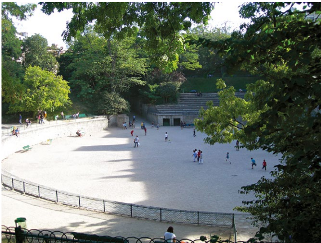
fig. 1 – Parigi: Les Arènes de Lutèce , antico anfiteatro gallo-romano oggi luogo di aggregazione sociale dell'intero Quartiere Latino.

marque de la grande ville. Elles sont un monument unique. Le conseil municipal qui les détruirait se détruirait en quelque sorte lui-même. Conservez les arènes de Lutèce. Conservez-les à tout prix. Vous ferez une action utile, et, ce qui vaut mieux, vous donnerez un grand exemple 9 .