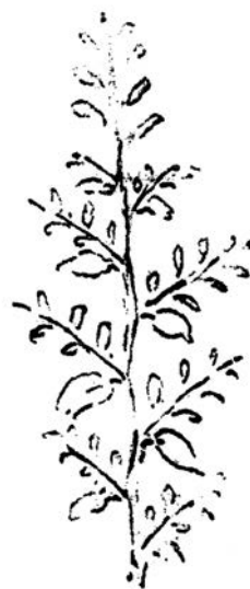
Ms G f. 27r