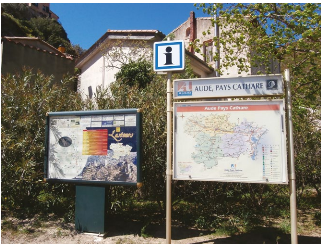
fig. 1 - Cartello turistico presso Lastours, affiancato dalla mappa dell'Aude, Pays Cathare.