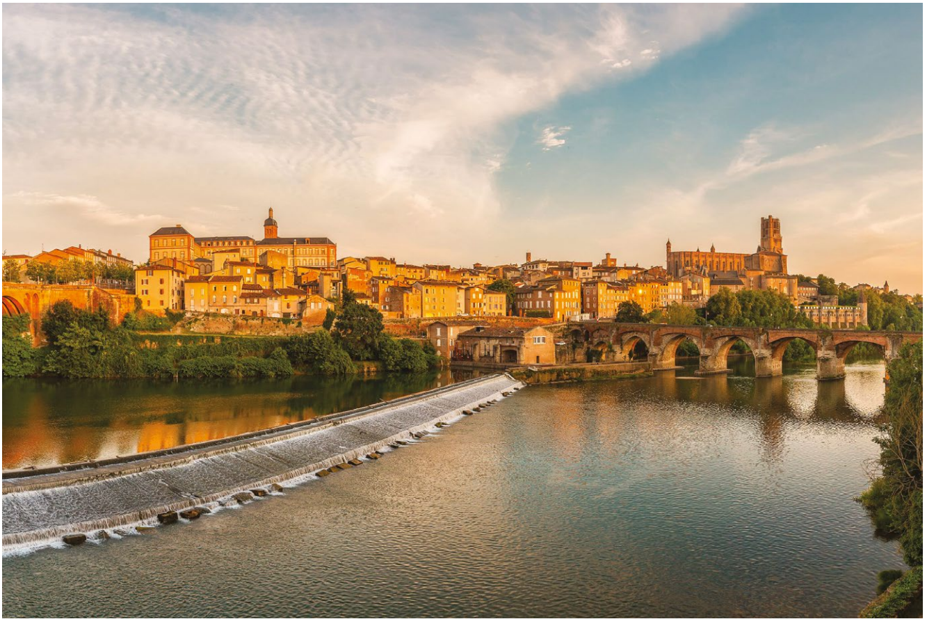
fig. 4. Il complesso episcopale di Albi, vero e proprio nucleo fortificato all'interno della città, dalla quale emerge nel lato destro dell'immagine. La torre campanaria absidale della cattedrale di Sainte-Cécile si palesa inequivocabilmente come un donjon.

Mondiale della Cité épiscopale d'Albi (2010) e della stessa Carcassonne; associarvi quindi i suoi