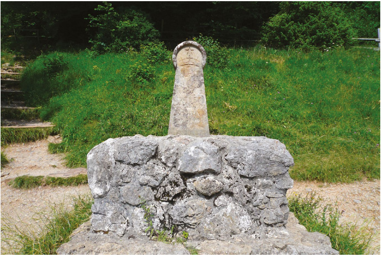
fig. 5 – La stele commemorativa posta ai piedi del pog di Montségur nel 1960 dalla Société du Souvenir et des Études Cathares in ricordo del rogo avvenuto in seguito alla capitolazione della rocca nel 1244, meta di visita per occitanisti e neocatarsi oltre che per numerosi turisti.

semplificistica, non fa dunque che danneggiarne i significati plurimi: credo che l'operazione Pays Cathare , infatti, abbia contribuito a semplificare una realtà variegata che certamente non può essere riconducibile a un'entità amministrativa, e neppure a un ambito culturale ascrivibile a una sola comunità religiosa (fig. 5).