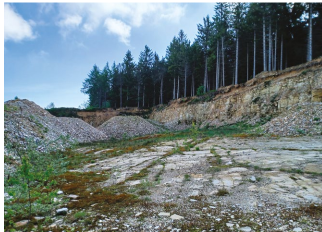
fig. 12 – La cava di Pian Lavarino, oggetto del progetto Cave.a – Monte Bracco, Barge.

I primi riferimenti storici relativi all'utilizzo della quarzite, nota anche come Bargiolina , risalgono alla seconda metà del Trecento e sono testimoniati dagli statuti concessi