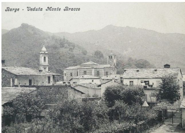
fig. 11 – Veduta del Monte Bracco in una cartolina degli anni '50.

immigrazione (fig. 10). Inoltre, il progetto non si limita al restauro architettonico del bene, ma prevede anche l'istituzione di una cooperativa sociale a cui affidare la gestione dell'ecomuseo, nell'ottica di dare origine a un'impresa comunitaria in cui tutti i cittadini possano sentirsi effettivamente coinvolti. La promozione della cultura diventa così un fattore di sviluppo sociale, relazionale e pedagogico, che individua nella sede della ex stazione ferroviaria il centro di una serie di iniziative che intendono mettere in luce le dinamiche e componenti etnografiche, le vicissitudini storiche, la cultura enogastronomica e il saper fare della Comunità.