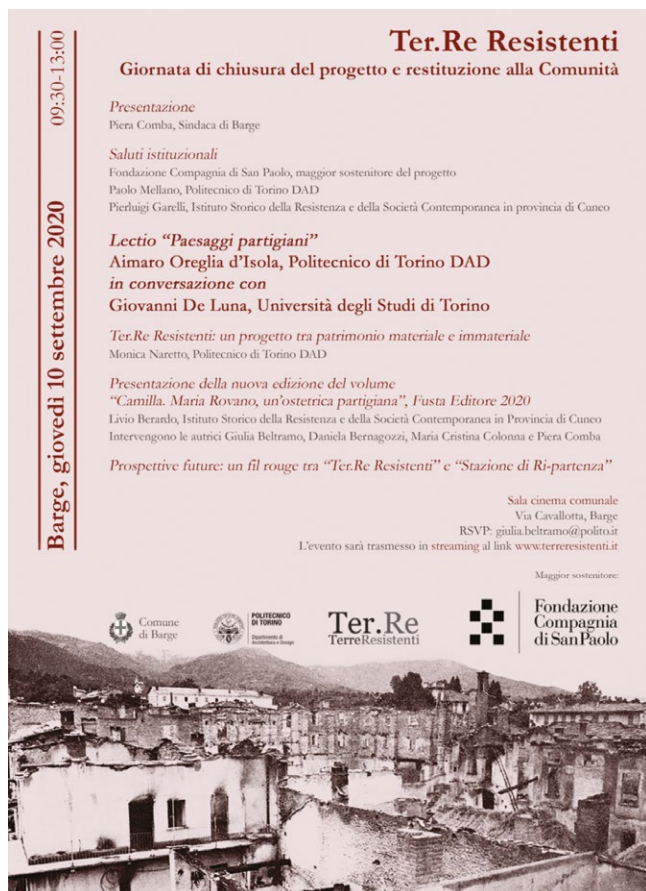
fig. 5 – Terre Resistenti . Giornata di chiusura del progetto e restituzione alla Comunità, evento tenutosi a Barge il 10 settembre 2020.

Dunque, la condivisione gratuita delle informazioni, l'utilizzo di registri linguistici differenti, la completa accessibilità ai contenuti e la possibilità di consultare direttamente parte delle fonti documentarie e iconografiche, affiancate dall'organizzazione di eventi culturali e da una comunicazione efficace (figg. 4-5), da un lato hanno permesso a diverse fasce della popolazione di riappropriarsi del territorio e della memoria in esso conservato, dall'altro sono risultate strategie efficaci per rilanciare il turismo di prossimità 27 . Per queste ragioni, Terre Resistenti , oltre a offrire le basi per la realizzazione dei due progetti successivi, rappresenta un caso esemplificativo di come, attraverso una conoscenza approfondita del proprio territorio, il coinvolgimento della popolazione e l'adozione di nuove tecnologie, le realtà "minori" possono salvaguardare attivamente il loro patrimonio culturale, ottenendo anche delle ricadute positive sull'economia locale.