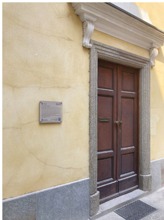
figg. 2-3 – Esempi di totem e targhe installati sul territorio per agevolare il riconoscimento dei luoghi della Resistenza