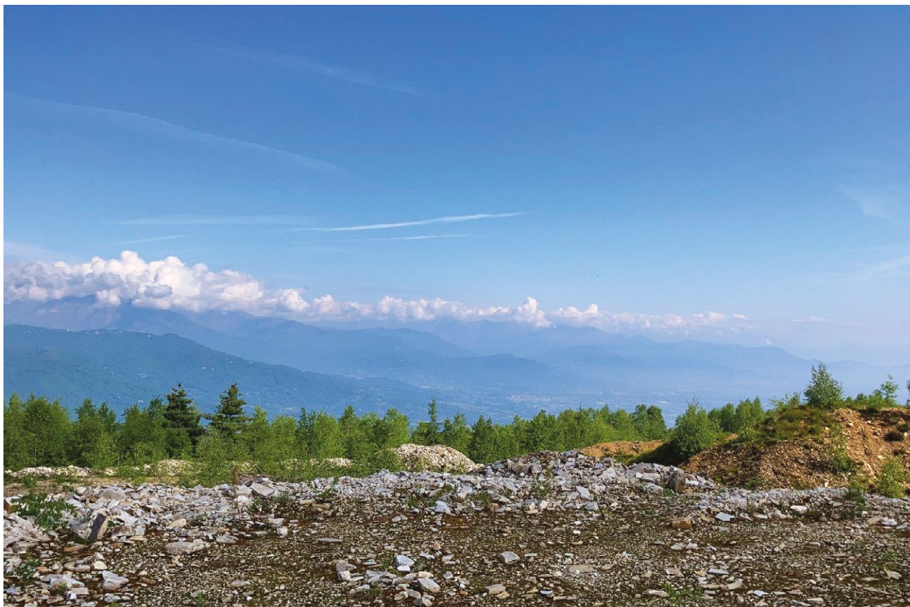
fig. 13 – Vista panoramnica dalla cava di Pian Lavarino sul Monte Bracco verso l'arco alpino (fotografia di G. Beltramo, 2021).