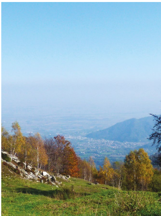
fig. 1 – Veduta dall'alto dell'insediamento di Barge e del Monte Bracco dalle cave di Bagnolo Piemonte (fotografia di G. Beltramo, 2018).

sempre più necessario, se non obbligatorio, procedere ad una valutazione preventiva della sostenibilità di un intervento di trasformazione del territorio e collocare tali decisioni in un corretto quadro valutativo, garantendo così la valutazione degli effetti delle scelte che per la città possono rivelarsi strategiche 14 .