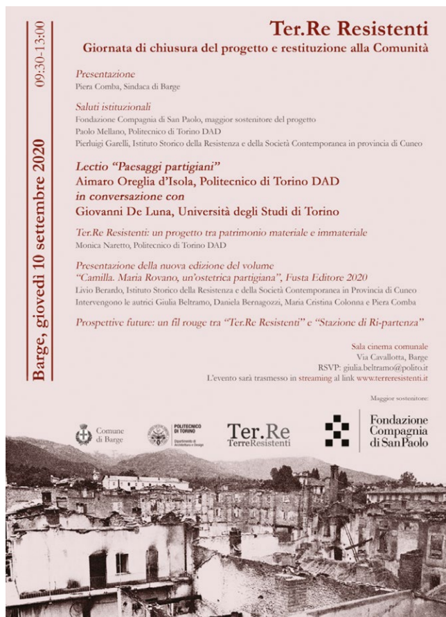
fig. 5 – Terre Resistenti . Giornata di chiusura del progetto e restituzione alla Comunità, evento tenutosi a Barge il 10 settembre 2020.

Dunque, la condivisione gratuita delle informazioni, l'utilizzo di registri linguistici differenti, la completa accessibilità ai contenuti e la possibilità di consultare direttamente parte delle fonti documentarie e iconografiche, affiancate dall'organizzazione di eventi culturali e da una comunicazione efficace (figg. 4-5), da un lato hanno permesso a diverse fasce della popolazione di riappropriarsi del territorio e della memoria in esso conservato, dall'altro sono risultate strategie efficaci per rilanciare il turismo di prossimità 27 . Per queste ragioni, Terre Resistenti , oltre a offrire le basi per la realizzazione dei due progetti successivi, rappresenta un caso esemplificativo di come, attraverso una conoscenza approfondita del proprio territorio, il coinvolgimento della popolazione e l'adozione di nuove tecnologie, le realtà "minori" possono salvaguardare attivamente il loro patrimonio culturale, ottenendo anche delle ricadute positive sull'economia locale.