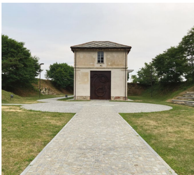
fig. 9 – L'ex officina ferroviaria di Barge, ora spazio espositivo per mostre temporanee, in seguito al restauro.

che utilizzano l'area circostante per fare propaganda e convincere i civili sia a non prestare forza lavoro agli industriali sia ad aderire agli scioperi contro i nazifascisti. Per questo, durante i Venti Mesi della Lotta di Liberazione è anche luogo di alcune rappresaglie tedesche, fra le quali è importante ricordare l'incendio del 1° luglio 1944, quando uomini e donne bargesi furono radunati al centro della piazza e costretti a guardare le loro case crollare sotto la forza delle fiamme.