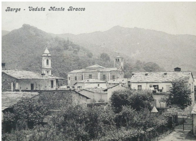
fig. 11 – Veduta del Monte Bracco in una cartolina degli anni '50.

immigrazione (fig. 10). Inoltre, il progetto non si limita al restauro architettonico del bene, ma prevede anche l'istituzione di una cooperativa sociale a cui affidare la gestione dell'ecomuseo, nell'ottica di dare origine a un'impresa comunitaria in cui tutti i cittadini possano sentirsi effettivamente coinvolti. La promozione della cultura diventa così un fattore di sviluppo sociale, relazionale e pedagogico, che individua nella sede della ex stazione ferroviaria il centro di una serie di iniziative che intendono mettere in luce le dinamiche e componenti etnografiche, le vicissitudini storiche, la cultura enogastronomica e il saper fare della Comunità.