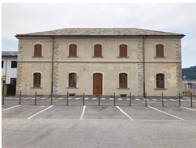
fig. 8 – L'ex stazione ferroviaria di Barge, futura sede dell'Ecomuseo Stazione di Ripartenza (fotografia di G. Beltramo, 2022).