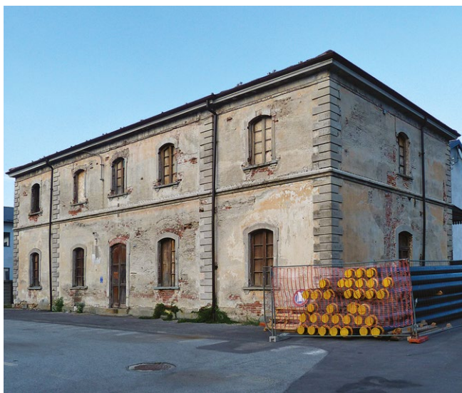
fig. 7 – La ex stazione ferroviaria di Barge prima dell'intervento di restauro del 2021-2022.