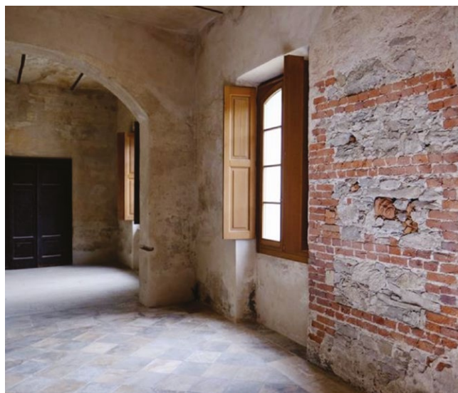
fig. 10 – Installazione I dormienti di Hilario Isola al piano terra della ex stazione ferroviaria (fotografia di P. Comba, 2022).