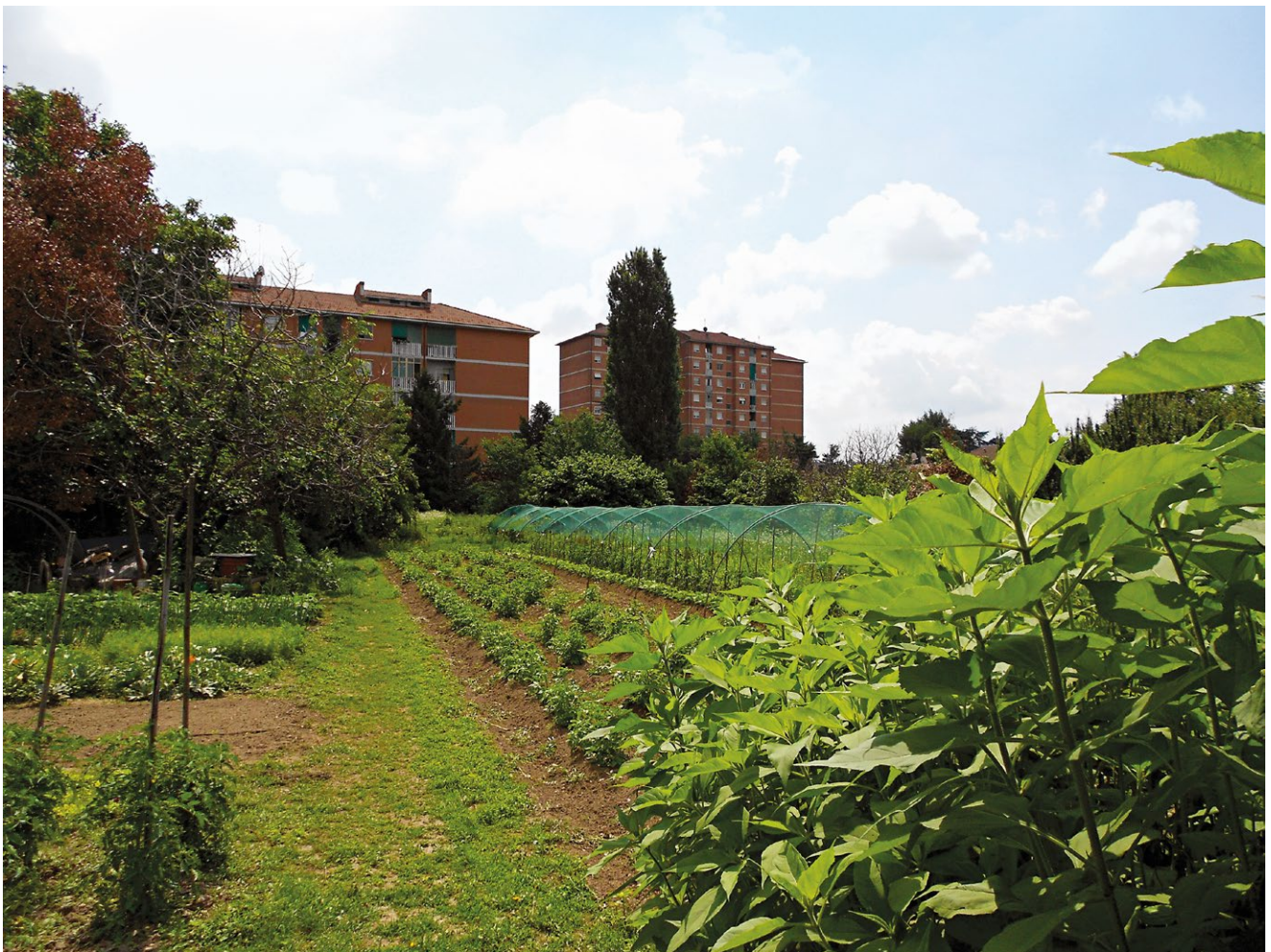
fig. 1 – Tra questioni identitarie e programmi di ri-interpretazione di settori di città: tralcio di paesaggio urbano con continuità degli usi storici, in questo caso orti e coltivazioni di pregio nel borgo di Mirafiori a Torino, in contrasto con lo skyline delle palazzine residenziali.