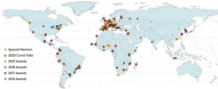
Fig. 1 – Milan Pact Awards, 2022.

vertà, fame, sottonutrizione e cambiamenti climatici. Negli ultimi anni, come vedremo, il tema delle UFP, soprattutto nel contesto africano, è stato oggetto di una crescente attenzione, data la sua efficacia su più livelli di azione.