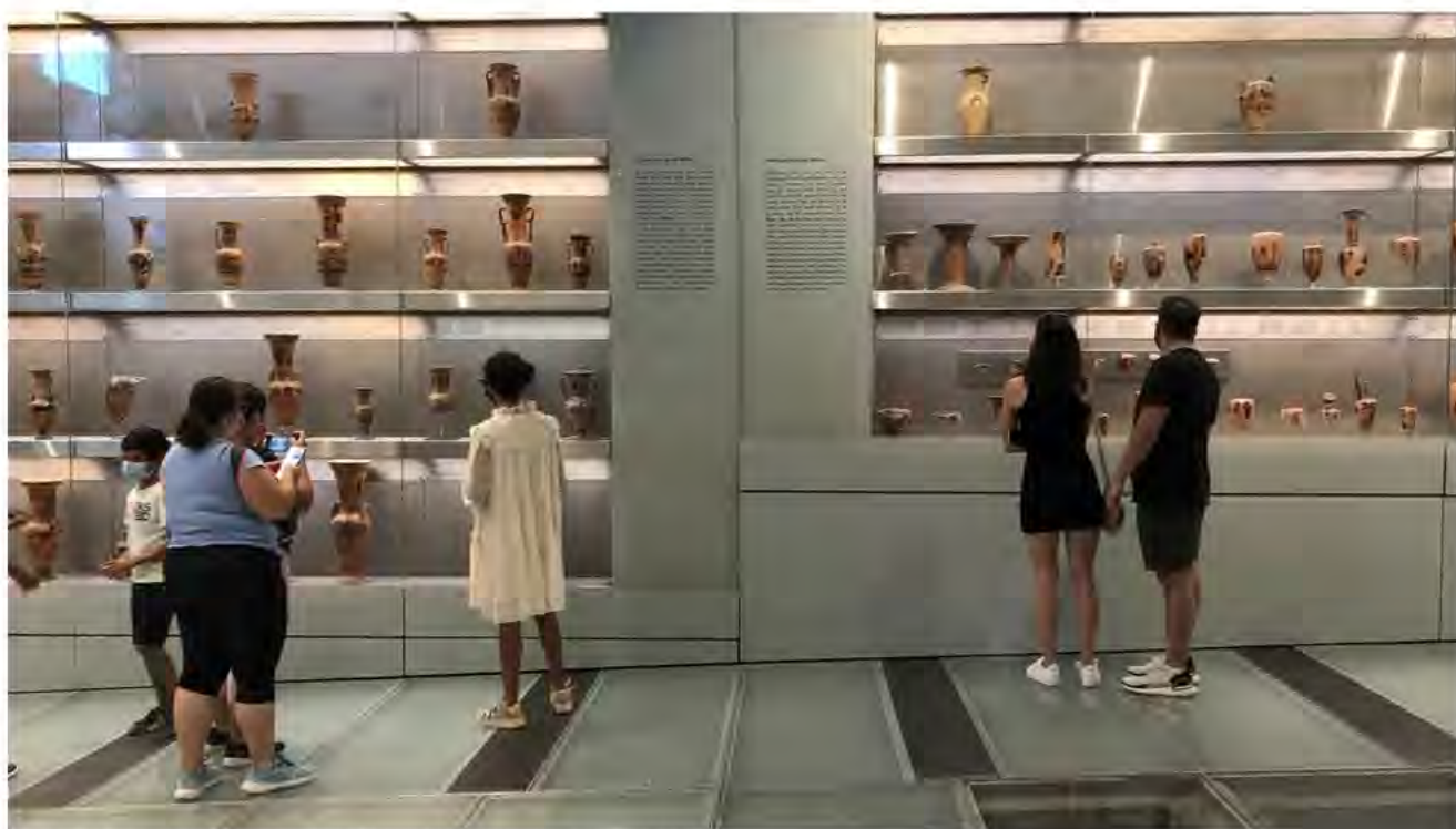
Fig. 3 Museo dell'Acropoli (Gianluca D'Agostino, Atene, 2022)

e una maggiore comprensione e apprezzamento dei valori del Patrimonio. Se già nel 1960 l'UNESCO aveva identificato l'importanza dell'accessibilità dei musei «a tutti, indipendentemente dallo status economico o sociale» 8 , le nuove Raccomandazioni del 2015 hanno consolidato il ruolo dei musei come luoghi di dialogo interculturale e di coesione sociale. Ai musei viene riconosciuta una funzione di responsabilità nella comunicazione e nell'educazione di un pubblico più ampio e sono incoraggiati a sostenere e promuovere politiche inclusive per raggiungere pubblici nuovi e diversi 9 . La rilevanza dell'interpretazione e della partecipazione delle comunità, come azioni volte a garantire accessibilità e inclusione, è stata recentemente ribadita dalla nuova definizione di museo dell'ICOM, in quanto luogo di promozione della diversità e sostenibilità 10 .