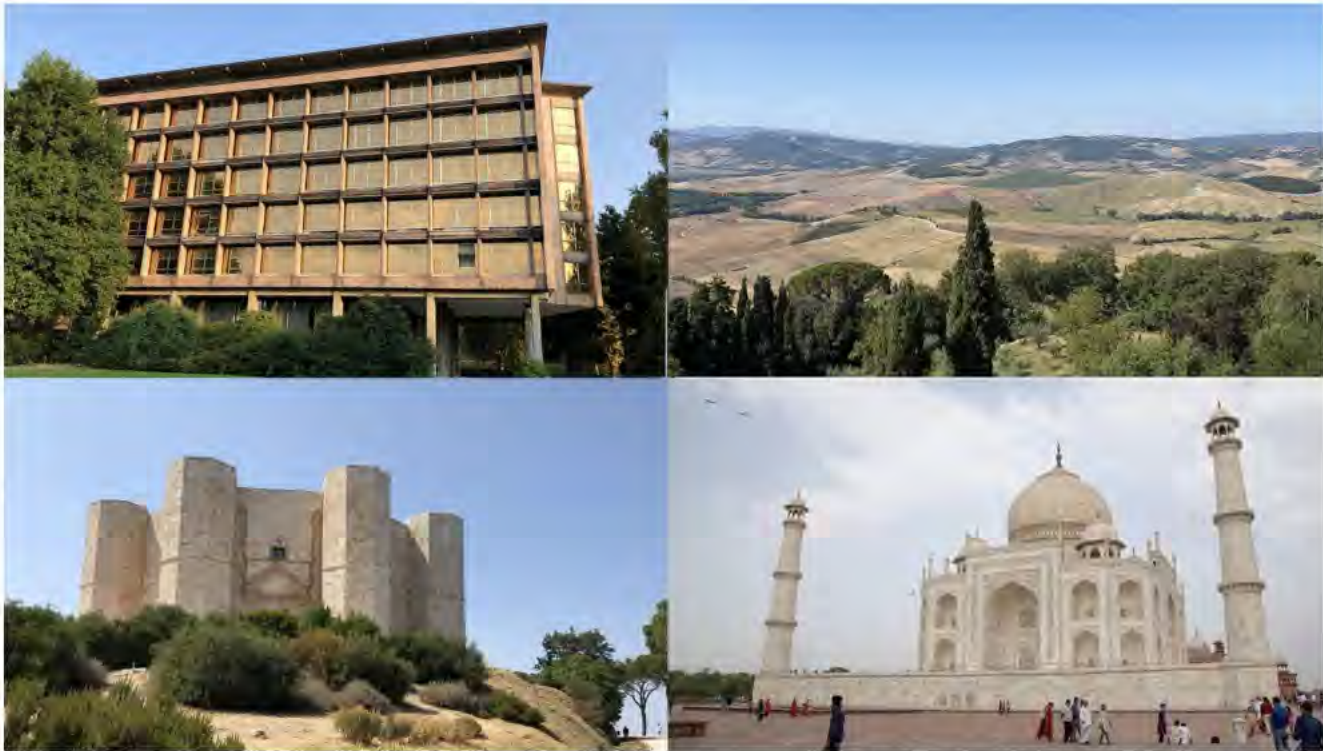
Fig. 1 Patrimonio Mondiale nelle sue diverse forme (Gianluca D'Agostino, Uffici Olivetti, Ivrea; Val d'Orcia; Valle dei Templi, Agrigento; Taj Mahal, Agra; 2022).

culturale e i legami tra il Patrimonio e la pluralità di individui che vi si relazionano e identificano rendono cruciali la messa in atto di processi partecipativi volti all'accessibilità e all'inclusione, anche grazie al ruolo di musei e centri di mediazione.