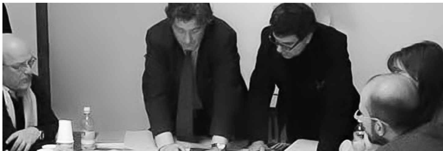
Fig. 6 - Concerto AL Piano: Incontro di co-design. (Fonte: Pagani, R., Savio, L., Carbonaro, C., Boonstra, C. & De Oliveira Fernandes, F. (eds) (2016), Concerto AL Piano. Sustainable Urban Transformation , FrancoAngeli, Milano).

Ai ricercatori e accademici del futuro, nel campo dell'architettura e ingegneria edile, suggerirei di essere estremamente aperti agli sviluppi della ricerca tecnologica e scientifica avanzata, anche in campi diversi da quelli di pertinenza. In particolare, i settori dell'Intelligenza Artifi-ciale, dell' Internet of Things , della Building Automation offrono ampie prospettive di sviluppo per un approccio alla progettazione e gestione energeticamente efficiente e ambientalmente sostenibile degli edifici e della generazione urbana, che possa rappresentare un salto di qualità rispetto alle esperienze fin qui maturate. Mi riferisco, in particolare, alla necessità di affinare conoscenze e strumenti, che tengano conto della complessità del sistema clima-edificio-impianto nelle interazioni con l'utenza e la gestione, le cui caratteristiche devono inserirsi in un ciclo virtuoso interattivo a livello di progettazione. Maggiore è l'affidamento a tecniche di controllo del microclima interno basate sulle risorse climatiche naturali (sole, vento, vapore acqueo...), maggiore deve essere la possibilità di gestime le caratteristiche stocastiche, sia per la natura variabile delle risorse stesse, sia per la necessità di un'interazione sem-pre più stretta con le dinamiche dell'utenza”.