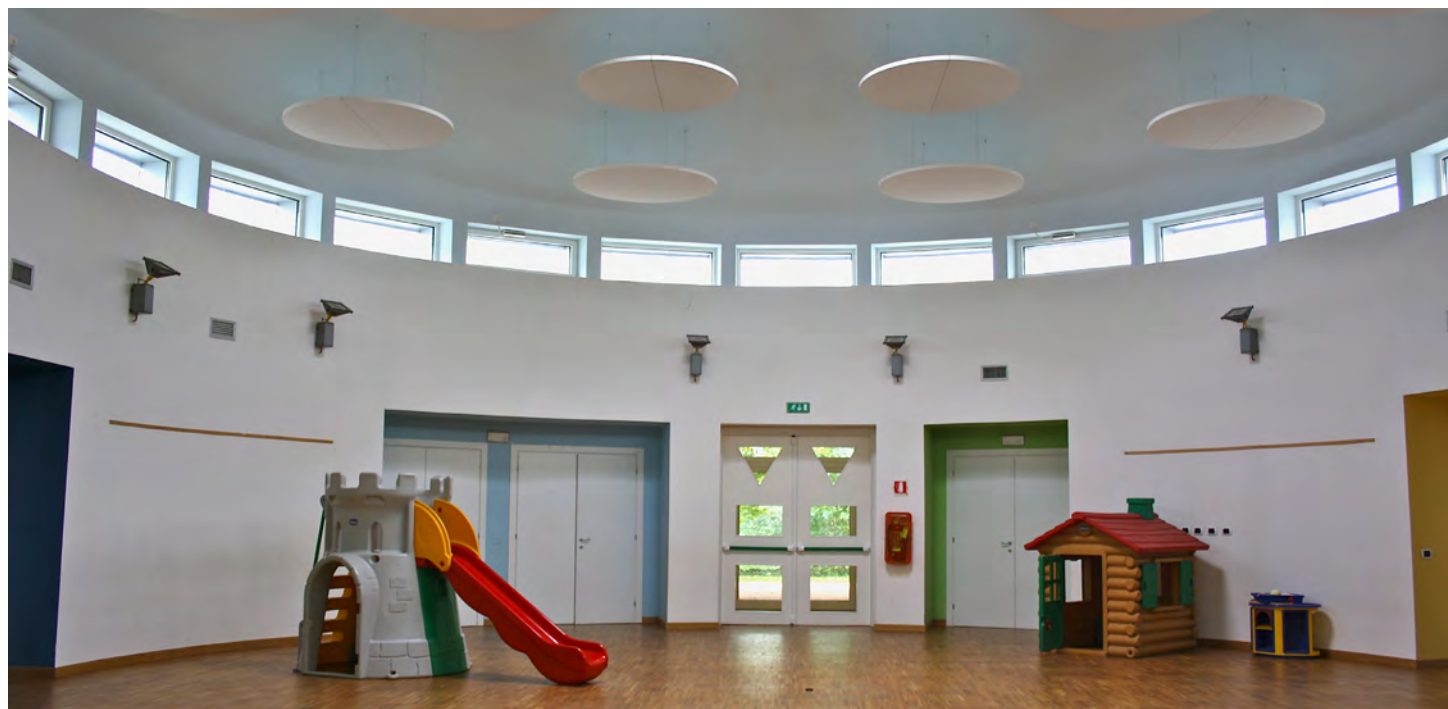
Fig. 5 - La scuola di Folzano (Brescia), 2005. Vista dall'atrio centrale. Progetto: Studio di Architettura Pietrobelli e Zilioli, consulenza per la sostenibilità ambientale Dipartimento DINSE del Politecnico di Torino, Proff. G. Peretti, Arch. V. Manni, A. Levra Levron, Dott. D. Marino.

sostenibilità. In veste di amministratore pubblico Matteoli guidò la significativa esperienza della realizzazione dello stadio torinese di Italia 90 attraverso un progetto di partenariato pubblico-privato. Al termine degli anni Novanta si assistette alla formazione di due Facoltà di Architettura a Torino, la prima con un'impronta storico-compositiva, la seconda caratterizzata da una maggiore attenzione agli aspetti scientifico-tecnologici. L'esperienza di Matteoli e della Seconda Facoltà costituiranno la premessa per la riorganizzazione dei corsi di laurea che avrebbero recepito il contributo importante dell'Area Tecnologica e specialmente dei docenti che operavano nel campo della Progettazione ambientale. In particolare, a seguito della riforma del cosiddetto 3+2, il gruppo di Torino darà vita, allo scadere del primo decennio del '2000, al Corso di Laurea Magistrale in Architettura per il Progetto Sostenibile , che vedeva un consistente contributo anche dall'area della Fisica Tecnica con Marco Filippi, già coinvolto da Lorenzo Matteoli nel progetto UPSE, fissando i presupposti per un forte sviluppo delle tematiche della fisica dell'edificio nei corsi di Laurea di Architettura.