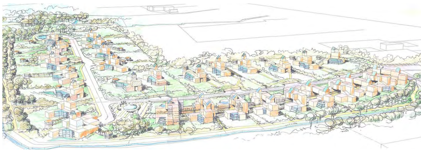
Fig. 4 - Vista del progetto di Insiediamento ecocompatibile per 150 abitanti a Mondovì (Cuneo), 2002. Disegno di Marco Sala ed Ettore Zambelli.

Gli anni '80 iniziarono con la legge 382, la riforma dell'Università, che oltre a rinnovare il corpo docente introdusse l'organizzazione per dipartimenti, sancendo la separazione tra attività professionale, ricerca e insegnamento e istituendo il dottorato di ricerca. Nella seconda metà del decennio, Ciribini fondò e avviò il Dottorato di Ricerca in Tecnologia dell'Architettura che vedeva impegnate figure come quella di Marco Zanuso, Virginia Gangemi, Valerio Di Battista. Il dottorato nazionale di Tecnologia di Milano associava docenti dei due politecnici di Milano e Torino, dell'Università degli Studi di Napoli "Federico II" e dell'Università degli Studi di Genova. Il Dottorato interuniversitario di Tecnologia dell'Architettura proseguirà la sua attività sino al primo decennio di questo secolo. L'esperienza dei corsi di dottorato che riunivano più Sedi a livello nazionale ha rappresentato un momento im-