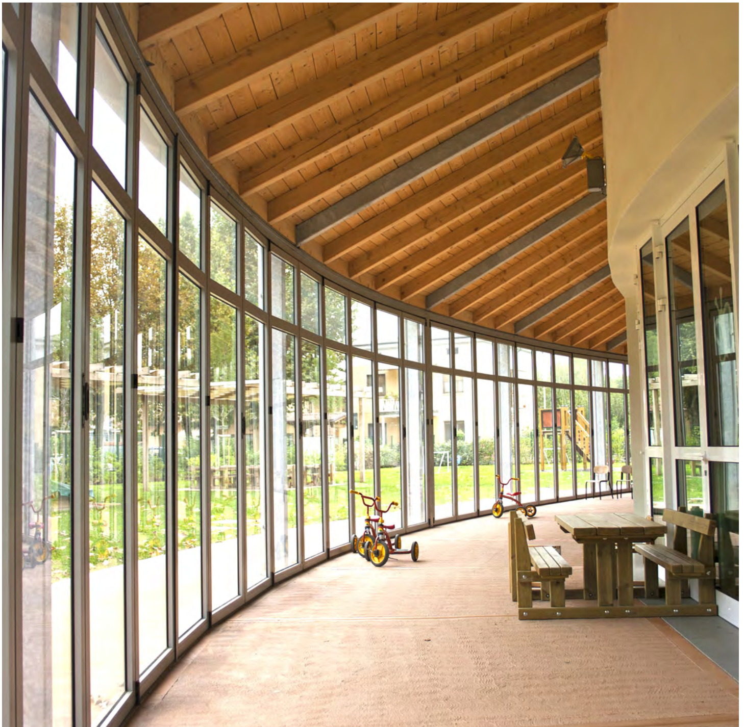
Fig. 1 - La scuola di Folzano (Brescia), 2005. Vista dalla serra bioclimatica. Progetto: Studio di Architettura Pietrobelli e Zilioli, consulenza per la sostenibilità ambientale Dipartimento DINSE del Politecnico di Torino, Proff. G. Peretti, Archh. V. Manni, A. Levra Levron, Dott. D. Marino.