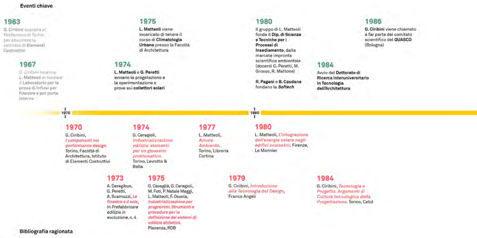
Fig. 2 - Linea del tempo per eventi e bibliografia (Fonte: elaborazione degli autori).

La cifra del suo lavoro era l'apertura a tematiche e discipline apparentemente estranee all'architettura e al mondo delle costruzioni. Le relazioni ricercate con filosofi, scienziati sociali, informatici e, parallelamente, con il mondo dell'industria ne dipingo-