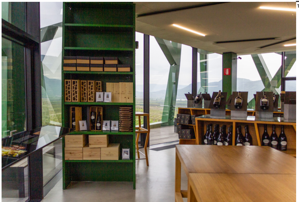
Fig. 9 Kellerei Tramin, Termeno, Alto Adige, Werner Tscholl, 2010.