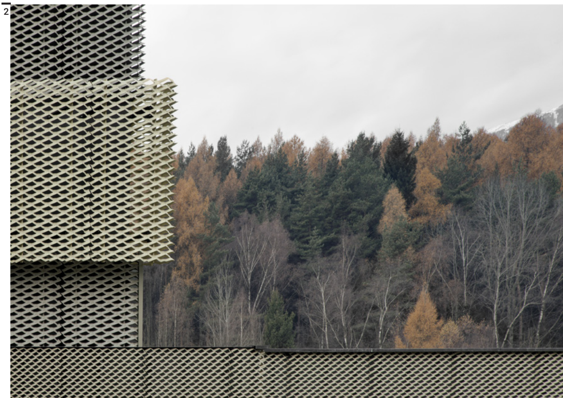
Fig. 1 Stazione travaso rifiuti, Brunico, Alto Adige, Comfort Architecten, 2015.