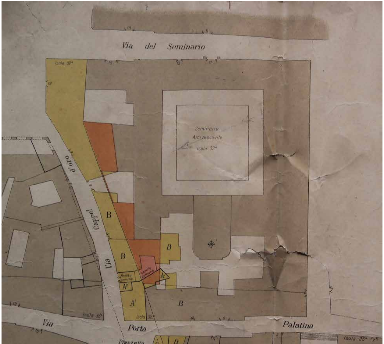
3. Seminario Arcivescovile di Torino – Progetto dei nuovi fabbricati a nord dell’Isolato di S.a Cecilia. Archivio del Seminario Arcivescovile di Torino, carte sciolte, s.d..