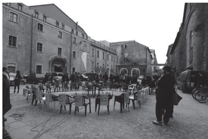
Fig. 4 – Fotografia di uno degli eventi partecipativi realizzati all'interno degli spazi della Cavallerizza reale.

3. ABITARE LA CITTÀ. SI COMINCIA DA QUI. — Il racconto della Cavallerizza mette in luce fin da subito come, sebbene questo complesso sia immediatamente riconoscibile come un "monumento" per la città, testimonianza di un processo più ampio di definizione del tessuto storico e valorizzato dalla sua posizione e dall'imponente e maestosa struttura, nel tempo, dopo la dismissione dell'attività principale per il quale era stato costruito e che definiva in modo specifico la costruzione dello spazio, è stato trattato come un contenitore di difficile riempimento. Si sono così smorzati i caratteri di pregio e le peculiarità fino a snaturarne la struttura con l'utilizzo del cortile centrale come ricovero dei mezzi della polizia. Poco alla volta seppur inconsciamente si è annientato il suo valore mostrandone solo un'obsolescenza della struttura che ne impediva un impossibile ripensamento. Ci si è nuovamente trovati all'interno della gabbia del monumento. Un bene di innegabile valore, non solo storico, che mostrando la sua inadeguatezza alla rigidità con cui nel tempo si è costituito un sistema di norme in grado di legittimare l'uso pubblico degli spazi, viene abbandonato senza possibilità di costruirne un nuovo racconto (Choay, 1999).