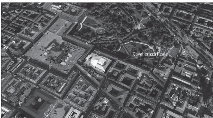
Fig. 2 – Foto aerea del complesso della Cavallerizza reale inquadrato nel contesto della città storica.

2. UN RACCONTO AD OSTACOLI. — Il complesso della Cavallerizza reale è collocato nel cuore del centro storico della città. Il progetto della sua costruzione risale al 1668 ed è collocato all'interno del piano di riorganizzazione urbanistica pensato da Carlo Emanuele II di Savoia per dotare Torino di un'Accademia Reale (Comoli, Viglione, 1984), istituto il cui scopo era l'educazione cavalleresca, da cui non a caso il nome con il quale era nota, di Cavallerizza, in grado di formare alti ufficiali, attingendo dalle giovani leve della nobiltà piemontese e non solo.