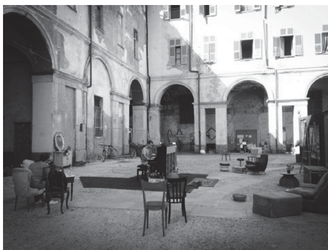
Fig. 5 – L’addomesticazione del cortile della Cavallerizza da parte dei membri dell’Assemblea e dei cittadini.

4. ELEMENTI DI IDENTITÀ. UN NUOVO RACCONTO? — La Cavallerizza, nella sua veste di patrimonio universale, mette in luce le difficoltà che incombono su un complesso edilizio di così grande pregio e riconoscimento nel trovare un nuovo valore d’uso e una sostenibilità economica pur rimanendo un “bene pubblico”. Il suo racconto, infatti, spesso tortuoso e controverso seppur nell’affermazione innegabile del suo valore, mette allo scoperto quella che è la vera “gabbia della patrimonializzazione” (Bourdin, 1992), strutturata attraverso una serie di regole che accresciute nel tempo ne hanno costruito un’intricata struttura all’interno della quale risulta difficile districarsi e dove quindi è facile trovare una scappatoia attraverso l’impossibilità economica di garantirne la corretta gestione e manutenzione. Si tratta quindi di un processo inverso. La strutturazione normativa del patrimonio che si è costruita per garantirne l’integrità e la trasmissione dopo secoli di barbarie e distruzione è diventata nel tempo l’oggetto stesso dell’intrattabilità della conservazione di questo, portando a processi di abbandono o, come mette in luce questo caso, politiche più recenti di privatizzazione.