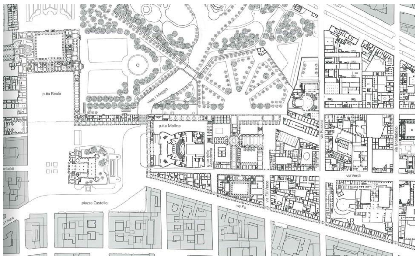
Fig. 3 – Planimetria dell'intervento complessivo del Polo reale.

L'ampio progetto urbanistico prevedeva un ampliamento della zona orientale della città. In particolare la costruzione di nuove arterie viarie. Tra queste la contrada della Zecca, ora denominata via Verdi e la contrada di Po, oggi conosciuta come via Po.