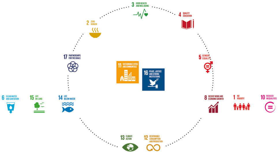
Fig.1 Schema SDGs - Cultura come driver per lo sviluppo sostenibile

La cultura è un motore e un abilitatore dello sviluppo sostenibile ed è essenziale per raggiungere l'Agenda 2030 in quanto contribuisce al benessere umano e socio-economico sviluppo, qualità istruzione, inclusione sociale, città, sostenibilità ambientale e società pacifiche.