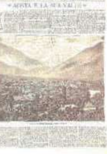
APERTA R. I. A. S. V. A. I.