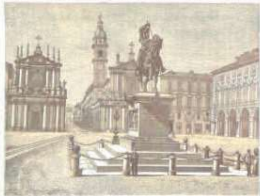
PIAZZA SAN GIORGIO

Il tempio di S. Giovanni Battista, detto il Duomo, è uno dei più celebri monumenti di Torino. Fu edificato nel 1562 dal cardinale Francesco di Savoia, e consacrato nel 1570. L'architettura è di stile barocco, e l'interno è ricco di opere d'arte. In particolare, si segnalano il pulpito di Giovanni Stanetti, e il coro di Giovanni Battista Piranesi. La facciata è decorata da due colonne ioniche, e da un frontone triangolare con un timpano riccamente scolpito.