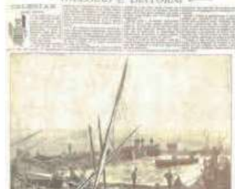
AGLI ESTASI E DINTORNI.