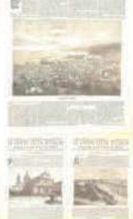
APERTA R. I. A. S. V. A. I.