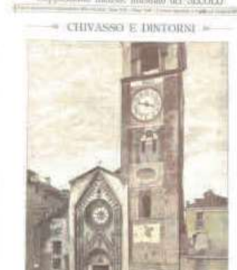
CHIVASSO E DINTORNI.