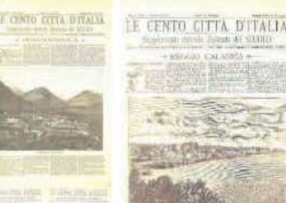
BRIGASCO S. ANDREA.