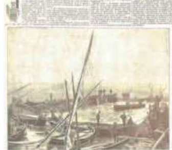
AGLIASIAS E DINTORNI.