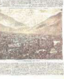
APERTA R. I. A. S. V. A. I.