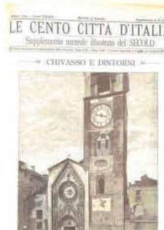
CHIVASSO E DINTORNI.