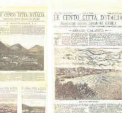
BRIGASCO S. ANDREA.