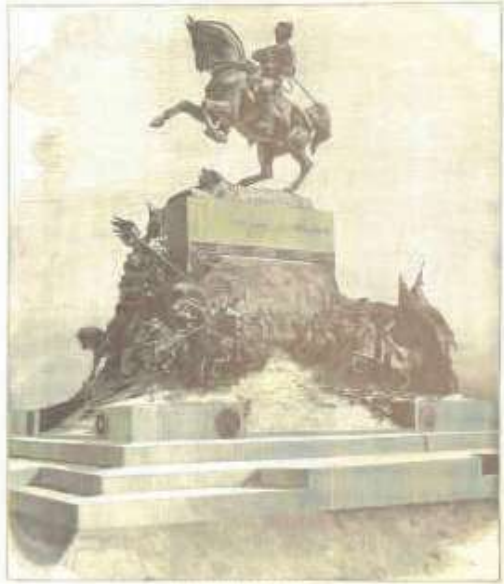
MONUMENTO A VITTORIO EMANUELE II