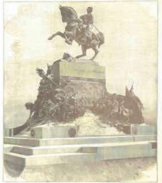
MONUMENTO A VITTORIO EMANUELE II