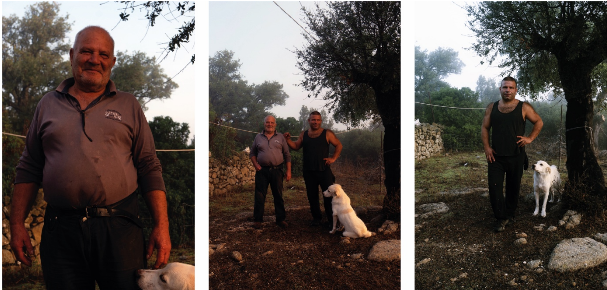
Figura 2 | I pastori Farci.