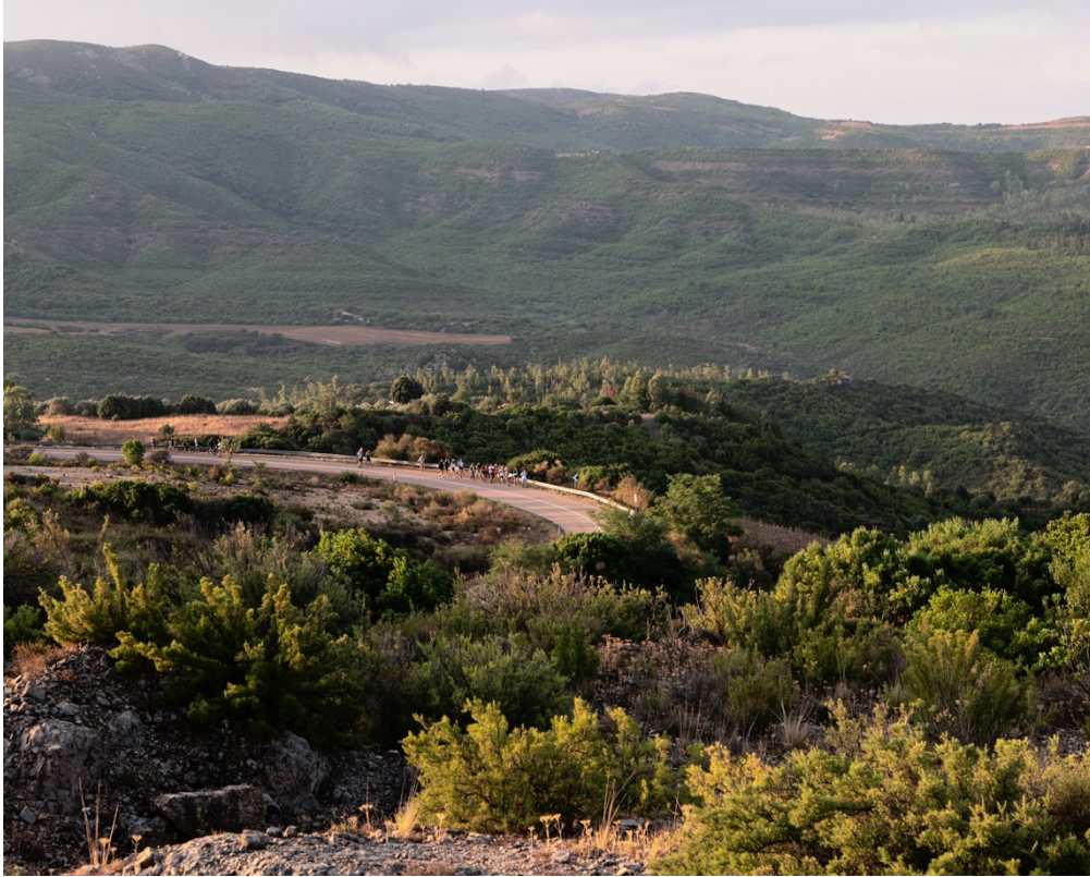
Figura 1 | Il gruppo in cammino verso Sant'Andrea Frius.