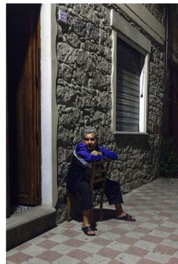
Figura 4 | Catalogo degli spazi di relazione incontrati durante il cammino (a sinistra) e un esempio a Escalaplano (a destra).