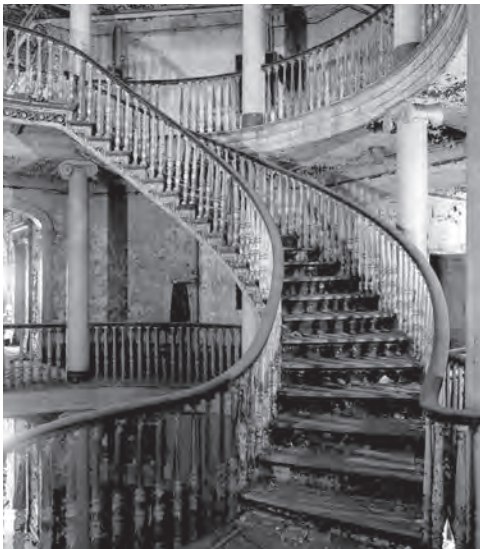
The Octagon, view of the helical staircase, in a state of neglect, 1970 ( https://www.theruin.org/blog/2016 ).

L'Octagon dopo la ristrutturazione e l'inserimento come accesso principale al nuovo Complesso residenziale ( https://www.beckerandbecker.com/work/octagon ).