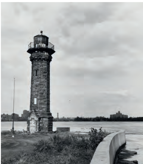
Lighthouse on Roosevelt Island.

Il capo nord di Roosevelt Island con il faro costruito nel 1872.