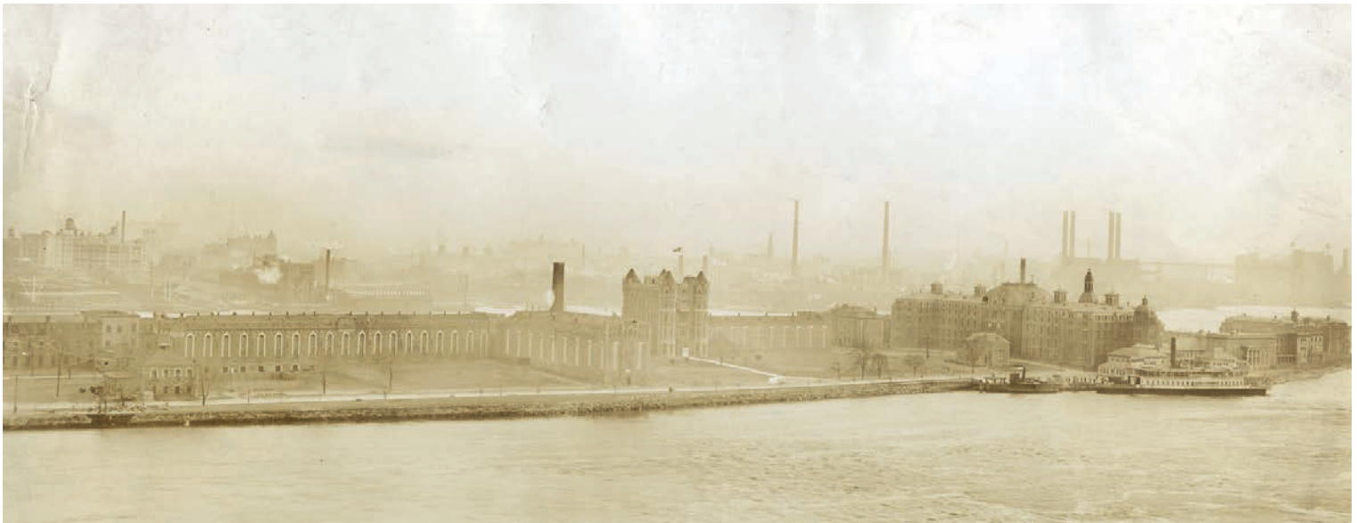
Southern half of Blackwell's Island with Riverside Hospital at southernmost tip.

Lo stato attuale nel quale noi oggi riconosciamo un edificio storico quale Smallpox Hospital rappresenta la sintesi di come, in fasi che si sono alternate e in periodi storici che ne hanno segnato le alterne vicende, sia stato interpretato il valore di quello che oramai è considerato un bene da tutelare. Il riconoscimento da parte della New