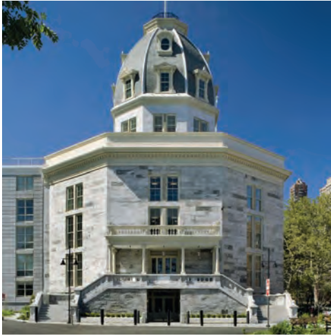
The Octagon after the renovation as the main access to the new residential complex ( https://www.beckerandbecker.com/work/octagon ).

L'Octagon dopo la ristrutturazione e l'inserimento come accesso principale al nuovo Complesso residenziale ( https://www.beckerandbecker.com/work/octagon ).