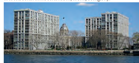
The Octagon between the new buildings, view from the East River ( https://www.beckerandbecker.com/work/octagon ).