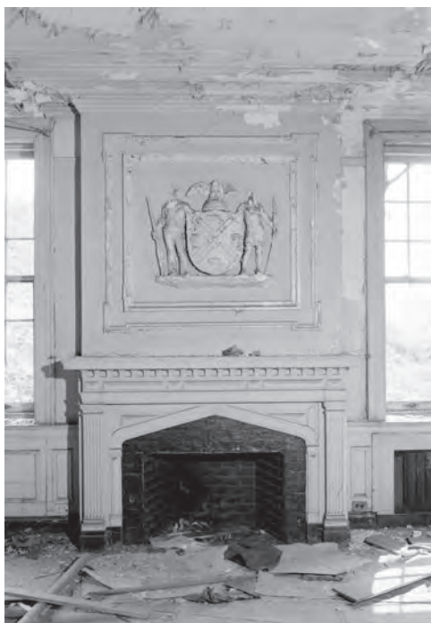
An original fireplace and mantle, the interiors of the building no longer exist, 1983 ( https://www.theruin.org/history ).