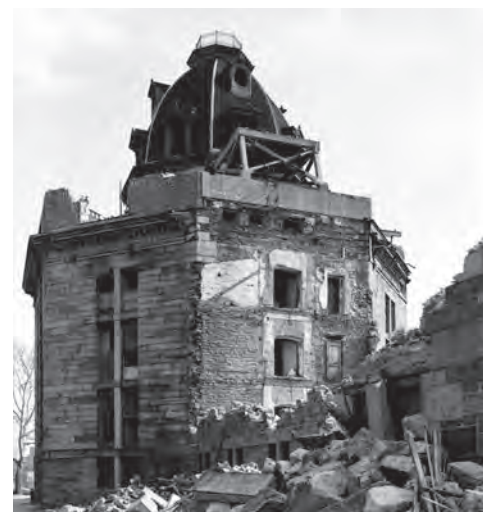
Octagon, after the demolition of the Lunatic Asylum two wings, 1970 ( https://www.theruin.org/blog/2016 ).

La testimonianza di origine più antica è quella della cosiddetta Blackwell House, edificata nel 1796 e annoverata pertanto fra le prime costruzioni superstiti dell'Isola e della stessa città di New York. L'edificio è una residenza in stile coloniale che ha subito diversi interventi piuttosto radicali di trasformazione, fino