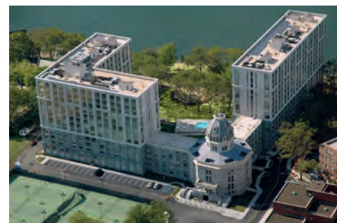
Aerial view of the new Octagon Complex ( https://www.beckerandbecker.com/work/octagon ).

per garantirne una presenza attiva nella loro comunità. Diverso da questo e per molti versi emblematico è invece il caso dell'Octagon. Sorto come elemento di snodo centrale di una composizione che prevedeva la costruzione di un ospedale distribuito secondo un imponente impianto ad U, il volume ottagonale era stato presto integrato da una cupola che lo sormontava, impostata su un tamburo anch'esso a base ottagonale. Il complesso non fu mai completato come da disegno originale di Alexander Jackson Davis, ispirato alla concezione panottica di Jeremy Bentham, ma fu realizzato e aperto nel 1839, avendo realizzato solo due padiglioni incernierati all'Octagon e restò in funzione, come manicomio, per poco meno di un secolo (1841-1955), per poi essere abbandonato e rimanere isolato, decontestualizzato, dopo la