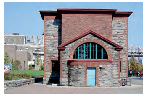
Strecker Memorial Laboratory after restoration, and in the 1970s (above), in a state of neglect.