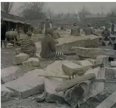
Prisoners employed in quarrying building stone work on Blackwell Island.

Il capo nord di Roosevelt Island con il faro costruito nel 1872 (foto di Edmund Vincent Gillon, 1970-90, Museum of the City of New York).