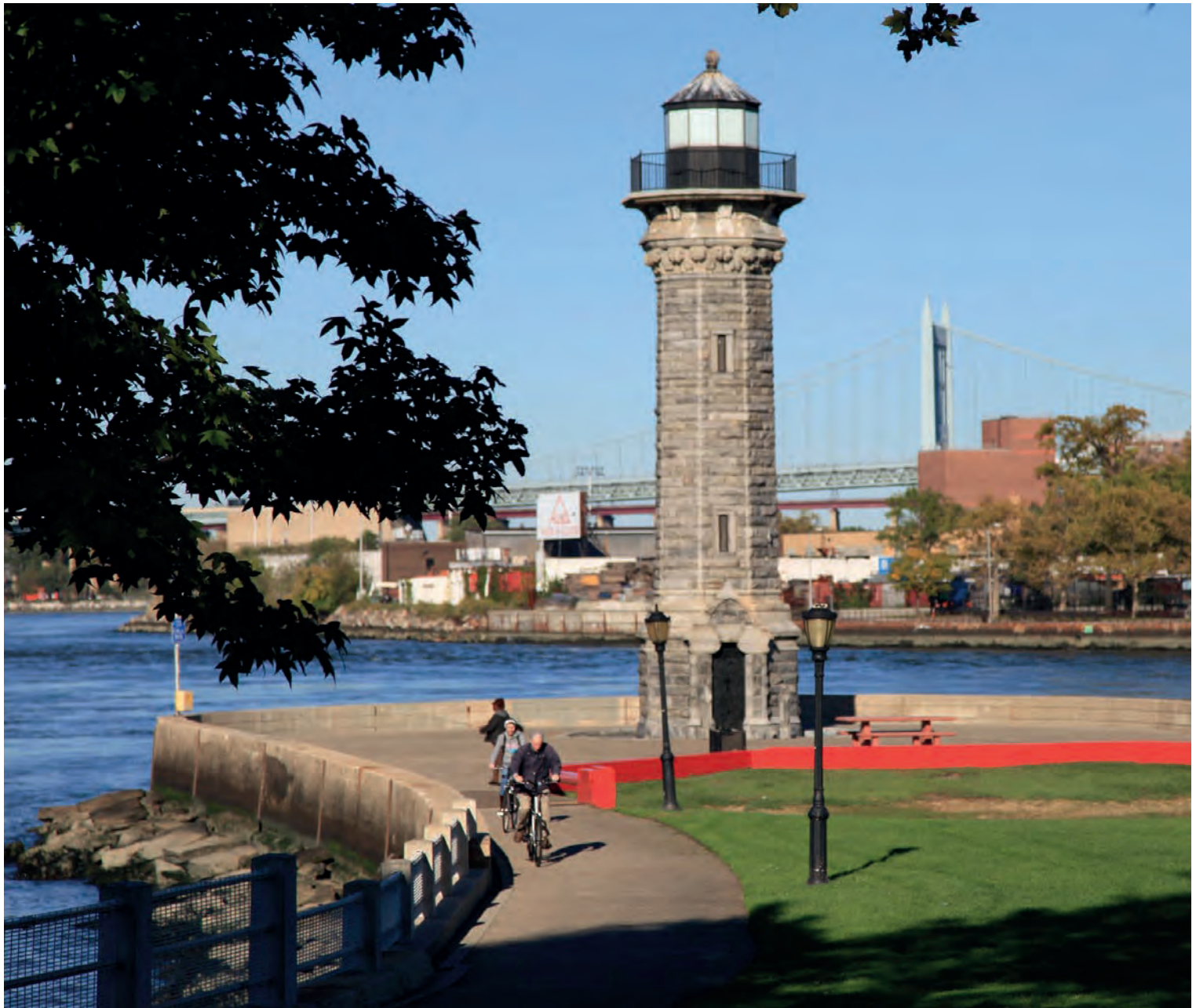
Lighthouse Park, designed by the landscape architect Nicholas Quennel ( https://www.rioc.ny.gov/341/Parks ).