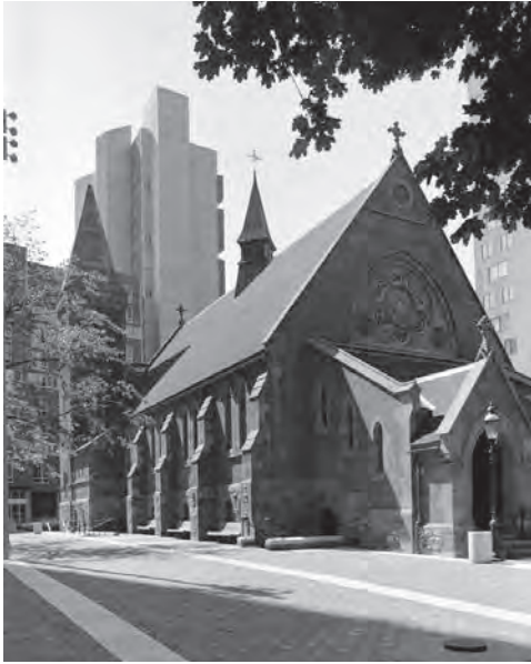
The Chapel of the Good Shepherd. In the background, the vertical development of the residential settlements of Roosevelt Island (1970).

La Cappella del Buon Pastore (the Chapel of the Good Shepherd). Sullo sfondo lo sviluppo verticale degli insediamenti residenziali di Roosevelt Island (1970).