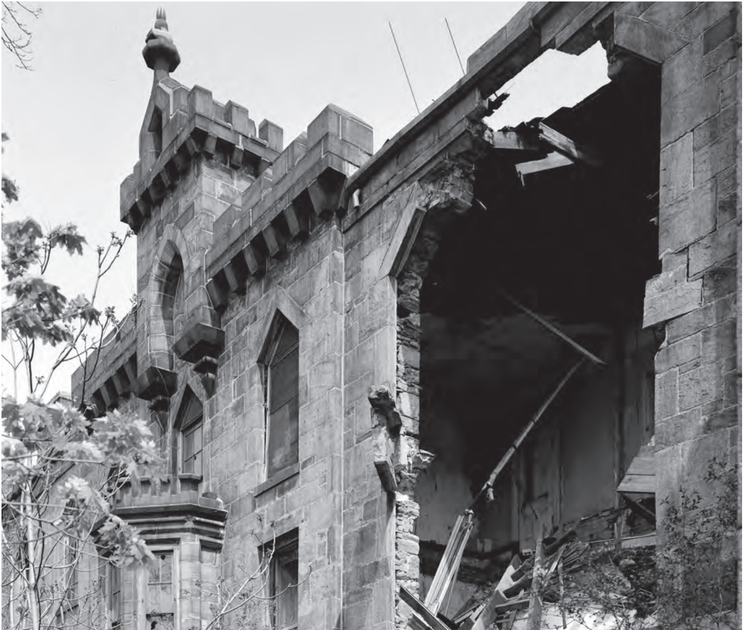
Western façade showing a partial collapse of the wall, Library of Congress, 1983. ( https://theruin.org/history ).