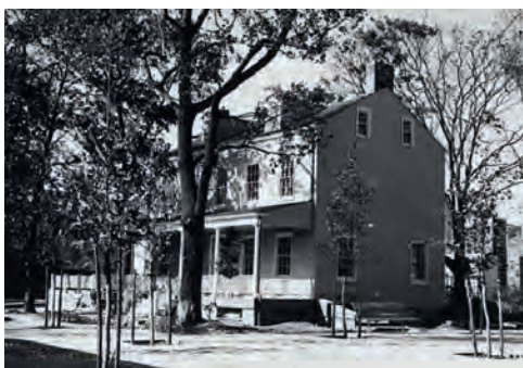
Blackwell House, 1950, Museum of the City of New York Blackwell House, 1950, Museum of the City of New York.

point, tightly related to the present appearance of the complex. Or better, what is left of it.