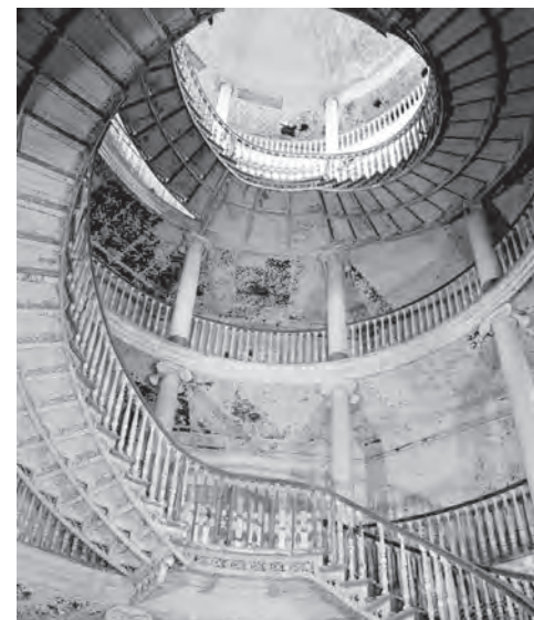
Octagon, the entrance hall and the helical staircase, in a state of neglect, 1970 ( https://www.theruin.org/blog/2016 ).