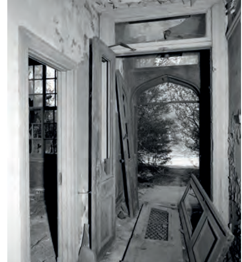
Interior hallway and entrance, the interiors of the building no longer exist, 1983 ( https://www.theruin.org/history ).

Corridoio e vista interna di uno dei bowwindow; interno dell'edificio non più esistente, 1983 ( https://.theruins.org/history ).