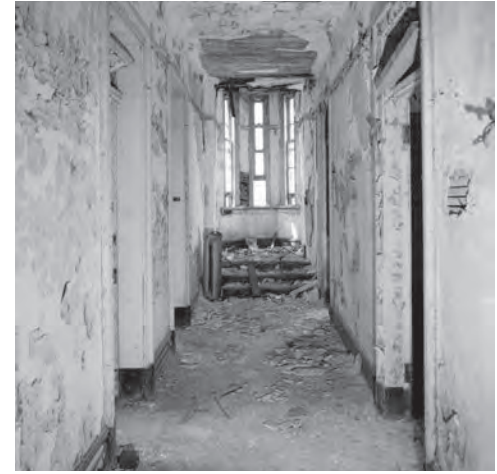
Hallway and interior view of the one of the building's oriel window, interior of the building no longer exist, 1983.

E' stata comunque tutta l'isola a perdere gradualmente le testimonianze fisiche della sua storia di luogo di confinamento, dimenticando in pochi decenni lo stato caratterizzante di spazio chiuso e accessibile solo in modo condizionato per passare a una condizione opposta di riconnessione con la città e di apertura verso insediamenti massivi sia residenziali che terziari. Intorno a Smallpox Hospital altri edifici erano sorti, lungo tutto il secolo XIX, facilitati dalle stesse condizioni che avevano favorito lo sviluppo dell'isola, per funzioni che altrettanto dovevano valersi di quella peculiarità del luogo, cioè di garantire l'esclusione pur in un rapporto di prossimità con la città. Roosevelt Island vicina fisicamente alla città di New York, connessa a questa visivamente in una relazione di reciprocità, ma separata dalle acque dell'East River che la circondano e ne fanno un luogo altro, di difficile accesso, è poi diventata un'appendice della stessa, con alcuni tratti di esclusività declinata però in senso opposto a quella originaria. Un'isola in cui ora è prevalente una funzione residenziale di lusso destinata a una clientela molto abbiente, come nel caso del complesso dell'Octagon, realizzato negli anni Duemila su progetto dello studio Becker +