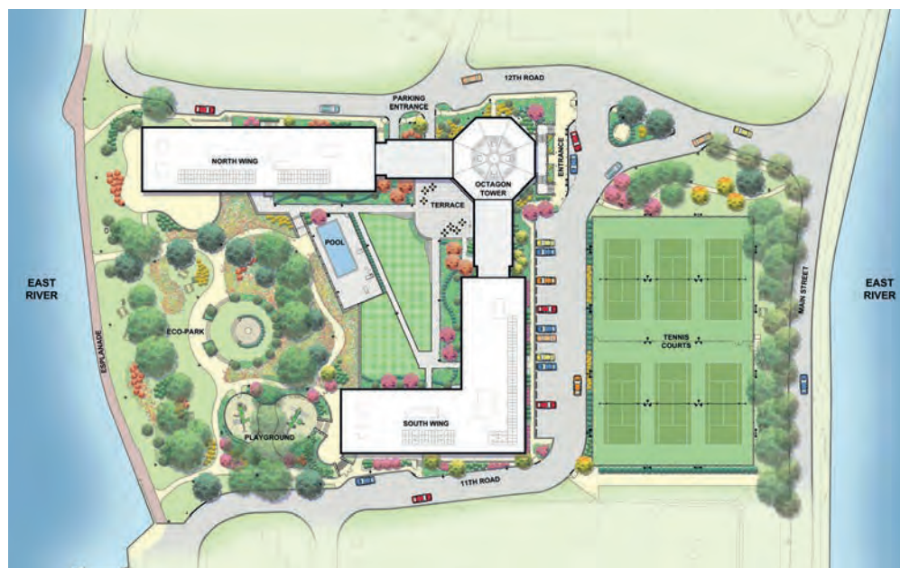
Masterplan of the Octagon residential complex, with arrangement of the external areas ( https://www.beckerandbecker.com/work/octagon ).