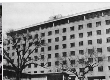
Il Peace Hotel a Pechino (1953)