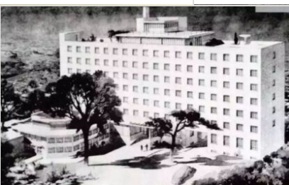
Il Peace Hotel a Pechino, disegno (1953)