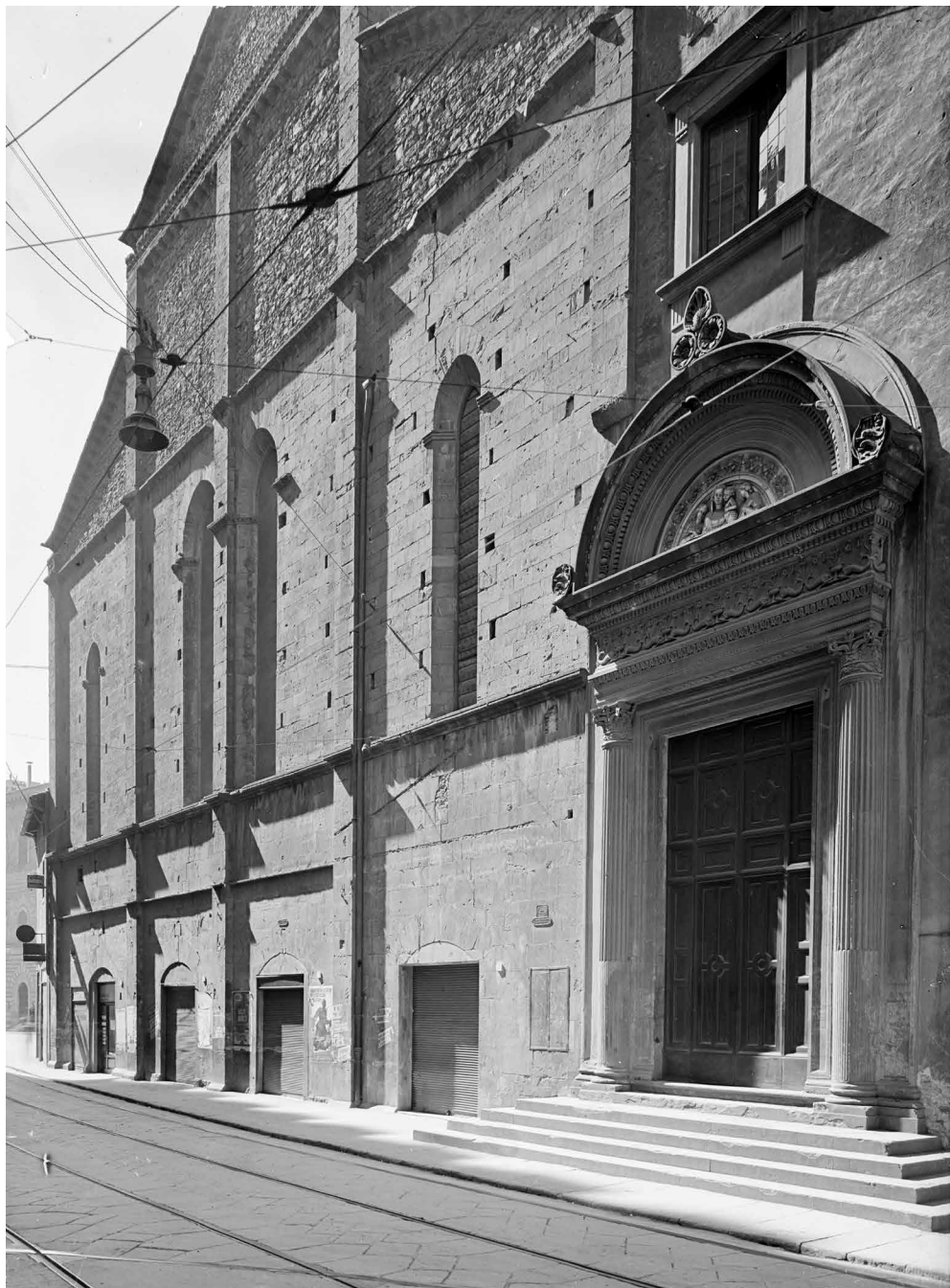
Fig. 2 Arnolfo di Cambio, Badia Fiorentina, Firenze. Facciata tergale.

professionista posto dall'autorità pubblica a capo di un cantiere, con il compito di dirigere le opere e di organizzare con autorità il lavoro delle diverse maestranze. Tra i tanti documenti che si potrebbero citare, ricordiamo soltanto, negli stessi anni di redazione del De monarchia , il contratto di affidamento dei lavori per il duomo di Orvieto a Lorenzo Maitani, siglato il 16 settembre del 1310, dove al maestro senese veniva riconosciuto il ruolo di "universalis caputmagister ad fabricam" 18 .