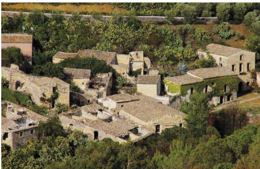
Fig. 6: Vista della conceria dall'alto.

La vicenda si "conclude" nel 2014, a circa 18 anni dall'acquisto fatto dalla Provincia da privati, la cunziria viene concessa in comodato d'uso gratuito al Comune con protocollo d'intesa firmato tra l'allora sindaco Marco Sinatra e il Commissario Straordinario della Provincia regionale di Catania Giuseppe Romano, per ottenere la gestione dell'antico insediamento artigianale. L'obiettivo era quello di recuperare i fondi, pubblici e privati, per tornare ad inseguire l'agognato sogno di recuperare il piccolo borgo. "È intenzione dell'Amministrazione comunale fare del rilancio del borgo della cunziria un impegno prioritario"