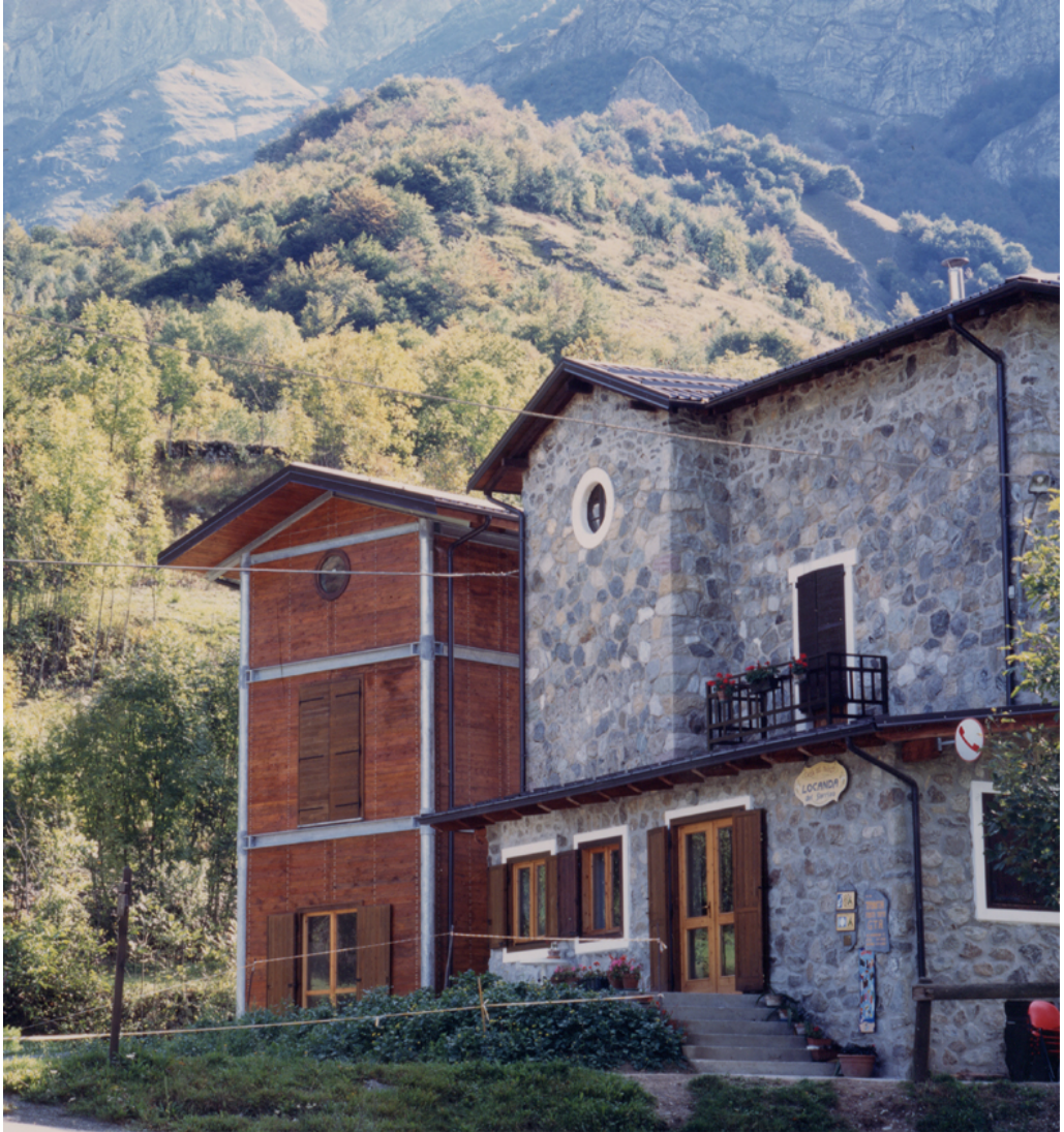
Figura 4: Bruna & Mellano arquitectos, Ampliación y renovación del albergue del Parque de los Alpes Marítimo, Entracque (Cuneo, Italia), 1998/2000

Así, la cuestión de una nueva estética de la arquitectura enfocada a la ecología termina por ser un falso problema, aunque pueda dar muchas respuestas. La que en este caso me interesa considerar es sobre todo una: hasta un cierto punto, la estética de la arquitectura ha sido por sí misma y de alguna manera, ecológica – a pesar de que para encontrar los materiales necesarios se llegara a erosionar las montañas excavando canteras y la construcción no despreciara el hecho de explotar grandes cantidades de mano de obra – porque la relación con el lugar y las técnicas que derivaban de tal relación conferían el