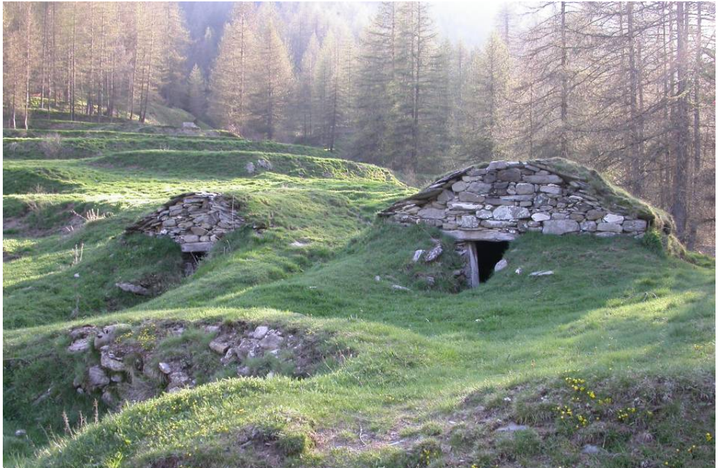
Figura 3: las trine (casa rudimental, en dialecto piamontés, para la producción y conservación de queso)

Partiendo de esta consideración, se podría iniciar un interesante campo de trabajo – de estudio y experimentación proyectual – ya que la montaña, por lo menos en Piamonte, en estos valles, es el paisaje por antonomasia, el telón de fondo de todos los territorios y, pues, de todos los proyectos.