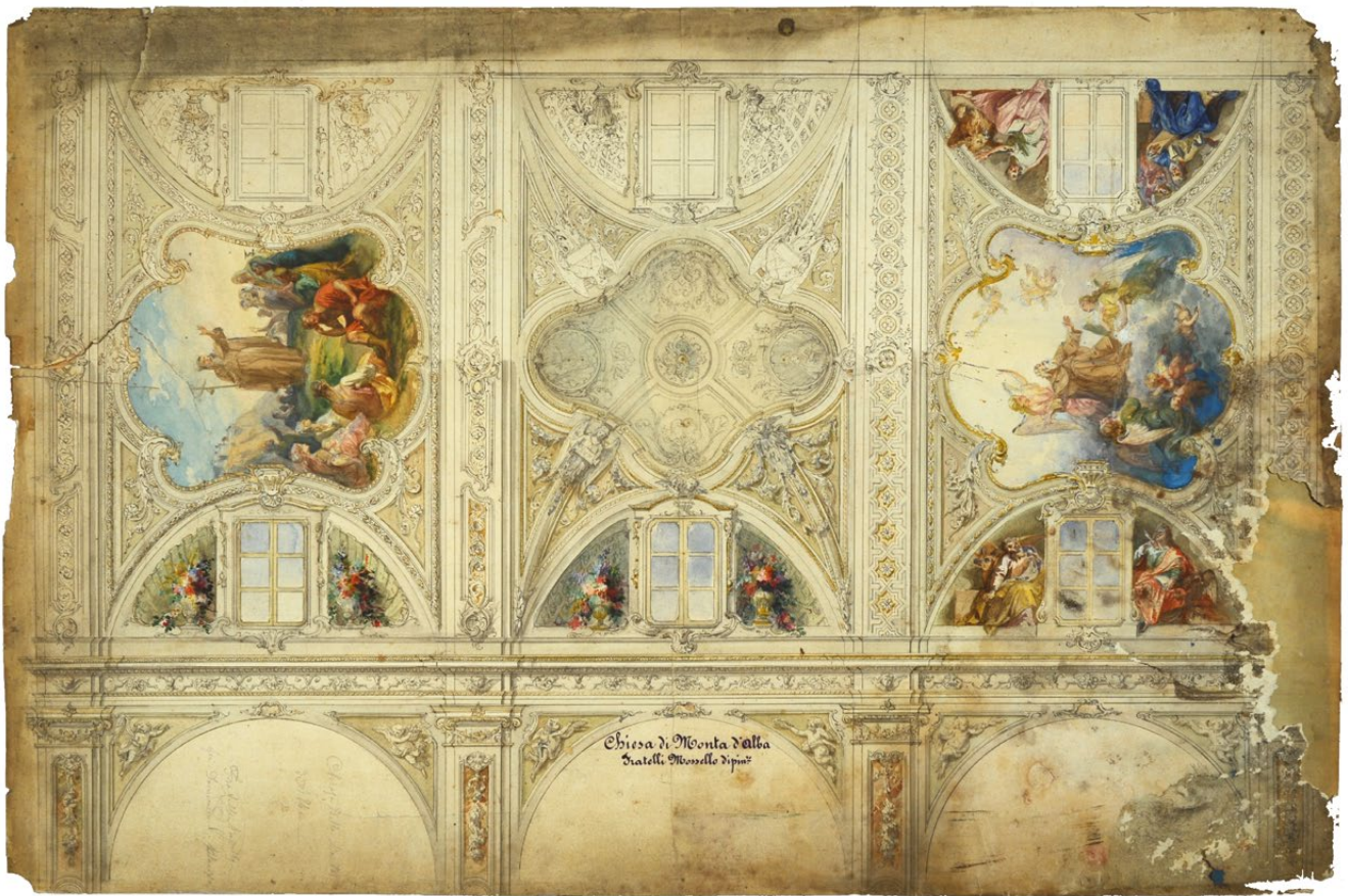
fig. 7 – Bozzetto relativo alla volta della navata centrale della Chiesa di Sant'Antonio Abate a Montà d'Alba (DIST-LSBC, MC. 702).