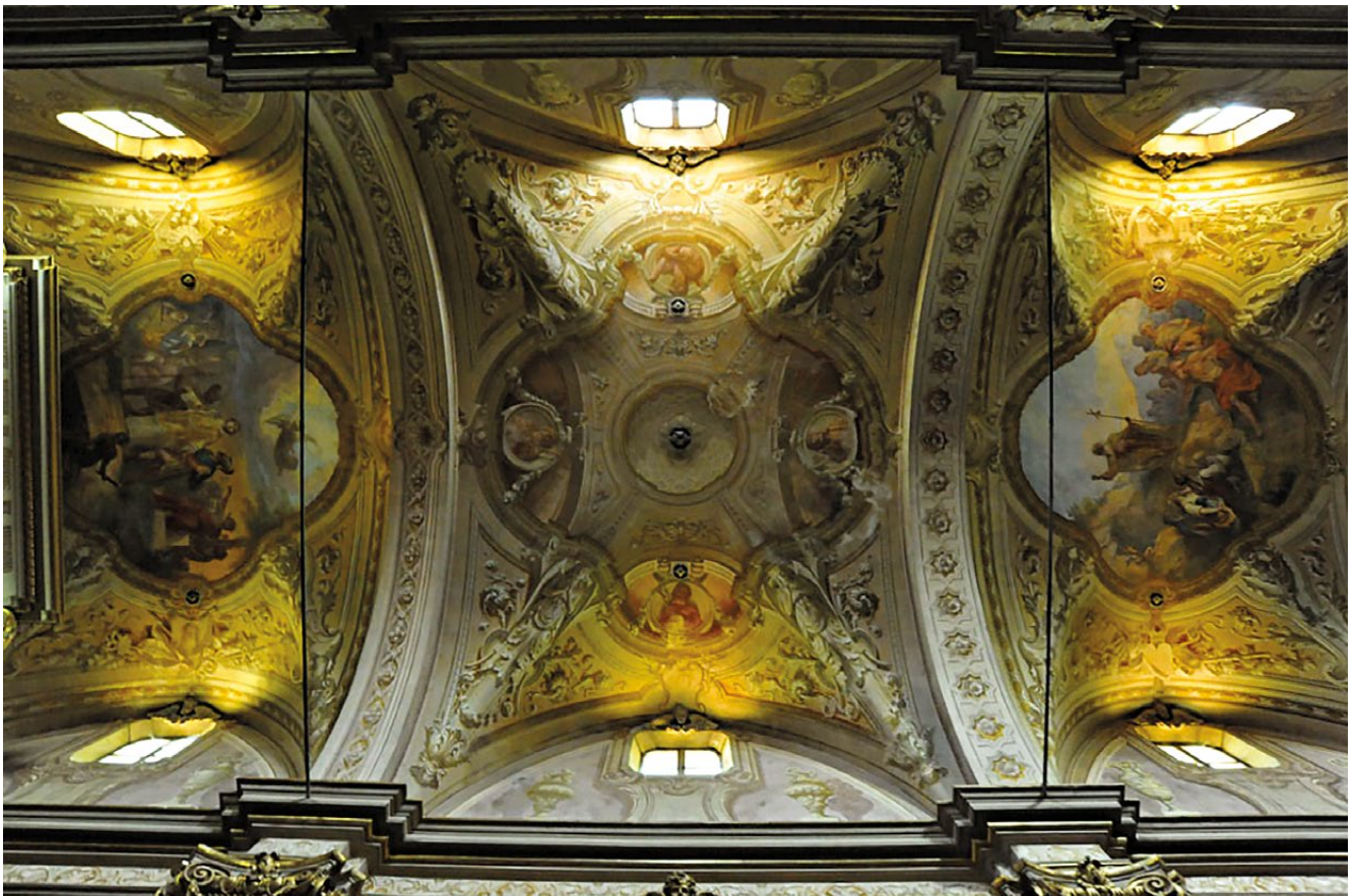
fig. 8 – Volta della navata centrale della Chiesa di Sant'Antonio Abate a Montà d'Alba, 2010.