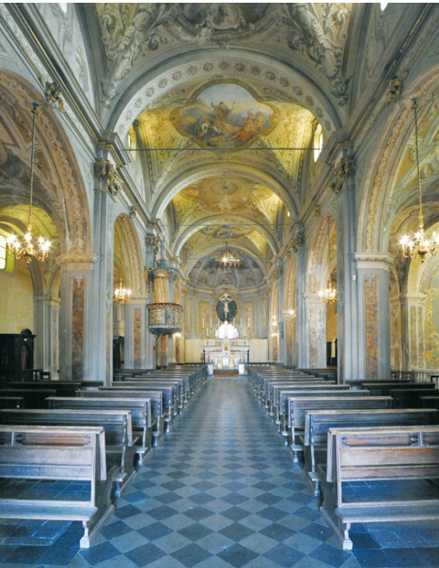
fig. 9 – Interno della Chiesa di Sant'Antonio Abate, 2020.

alle finestre è dovuto a ragioni di sicurezza, dato che negli anni precedenti la Chiesa aveva subito alcuni furti 26 .