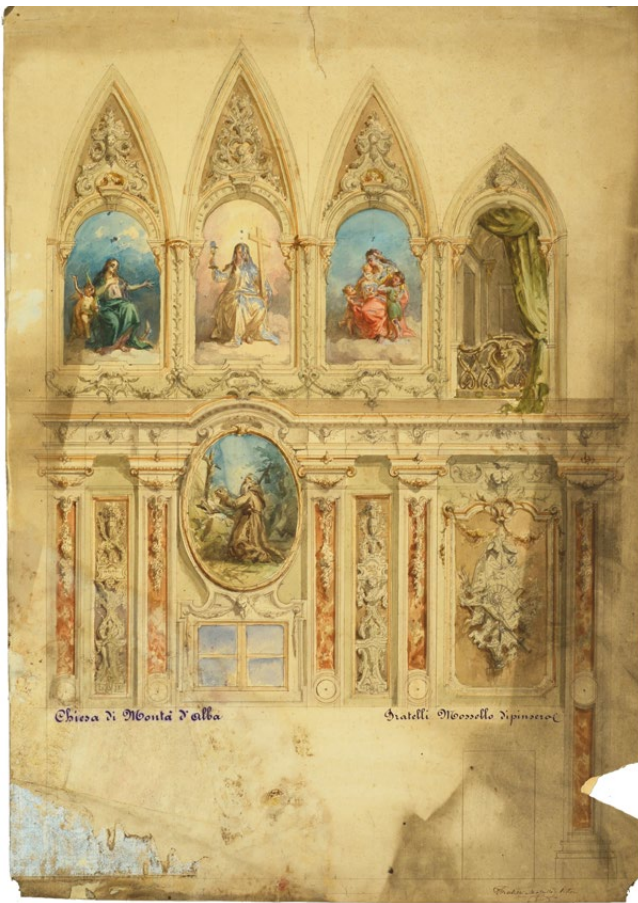
fig. 5 – Bozzetto relativo alla volta dell'abside della Chiesa di Sant'Antonio Abate a Montà d'Alba, s.d. (DIST-LSBC, MC. 702).