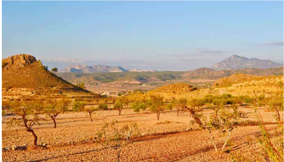
1. Vista su un paesaggio della regione della Murcia, Spagna.