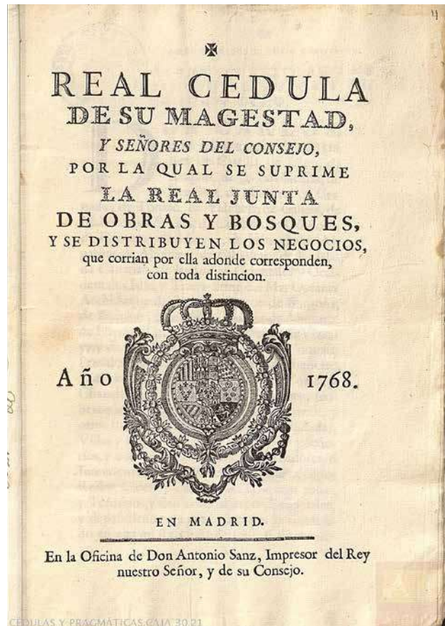
4. Frontespizio del documento datato al 24 Novembre 1768, che attesta l'interruzione delle attività della Real Junta de Obras y Bosques, con la cessione dei poteri ad altri enti delegati