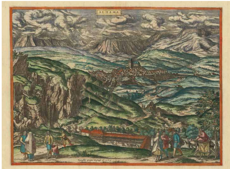
2. Rappresentazione della città di Alhama del 1593, realizzata da Braun e Hogenberg per il Civitates Orbis Terrarum . Si osserva come già nel XVI secolo, il paesaggio costituisse una componente predominante anche nelle rappresentazioni grafiche. Fonte: Georg Braun, Frans Hogenberg, [Alhama de Granada], Barry Lawrence Ruderman Antique Maps Inc: https://www.raremaps.com/gallery/detail/77312/alhama-de-granada-alhama-braun-hogenberg ".).