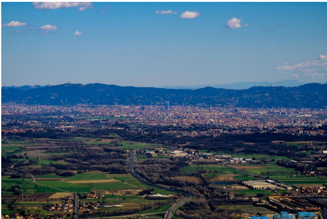
Fig. 1 - L'area metropolitana torinese vista dalla Sacra di San Michele

Gli spazi aperti dell'area metropolitana torinese sono oggetto di speciale attenzione da almeno un ventennio: da una parte, le misure regolative dei piani territoriali e paesaggistici; dall'altra parte, la pianificazione strategica e la governance sperimentate dal progetto Corona Verde. Entrambi gli approcci hanno punti di forza e debolezza, ma la loro combinazione può essere particolarmente efficace. Il momento, inoltre, è particolarmente favorevole a progetti di miglioramento ambientale. D'altro canto, occorre mantenere una visione d'insieme a scala metropolitana. L'approccio paesistico, e in particolare processi di landscape strategy making , possono favorire la creazione di progettualità condivise con il settore privato.