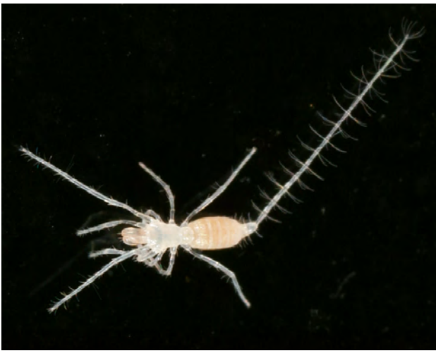
Fig. 8 - Eukoenenia strinatii Condé, 1977.

Negli anni '70, su iniziativa dello svizzero Pierre Strinati e con l'aiuto di Morisi e Peano, sono state svolte nella Grotta di Bossea ricerche attive, culminate con il rinvenimento di un esemplare di questi aracnidi e la conseguente descrizione di Eukoenenia strinatii Condé, 1977 (fig. 8), specie che è rimasta un'endemita della grotta di Bossea per oltre 40 anni; di questo piccolo aracnide era documentato in letteratura il solo holotypus ♂, su cui venne descritta la specie, e un secondo esemplare citato in modo non chiaro da Morisi (1992) nel testo e nel suo elenco della fauna di Bossea.