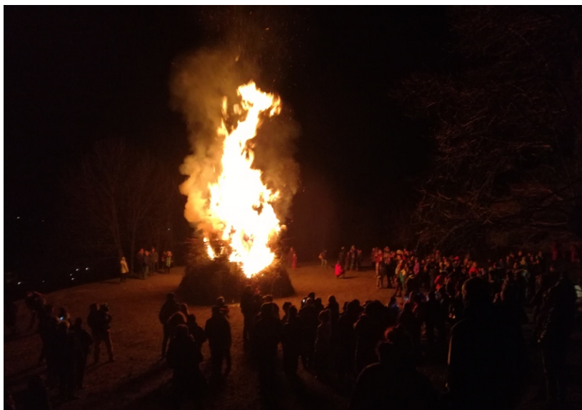
(Fig. 3) Il falò del 17 febbraio di Sibaud (Bobbio Pellice), occasione di festa, riflessione e aggregazione intergenerazionale per la comunità valdese, ma anche per partecipanti di altre confessioni.

microeconomia delle “terre alte” e oggi nuova frontiera per sviluppare i valori dell’abitare ecologico e della valorizzazione del patrimonio ambientale.