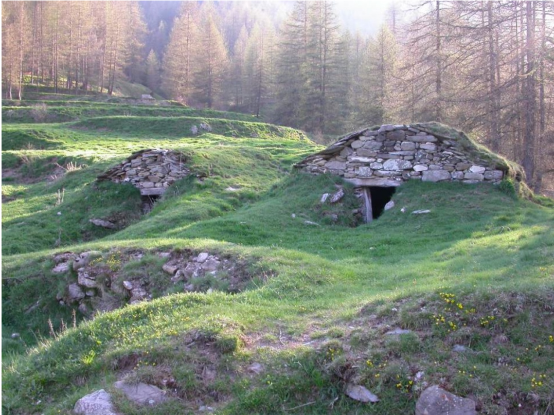
(Fig. 6) “Séle” (selle) in pietre e terra, costruzioni per il deposito di latte, burro e formaggi di alpeggio, in Valle Negrone, a Upega (loc. Madonna della Neve).