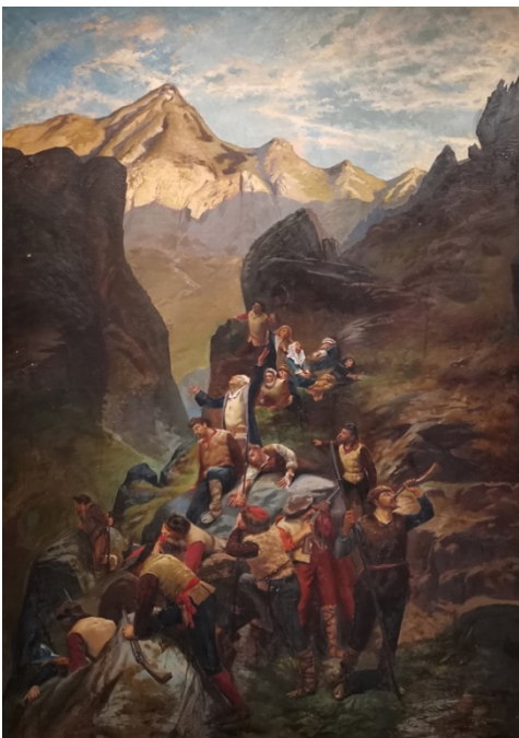
(Fig. 2) Silvio Allason, Gli Invincibili (1875 circa), la tela originale è custodita alla GAM di Torino; questa riproduzione (1942) è custodita al Museo Valdese di Torre Pellice. Il quadro rappresenta la difesa dei valdesi nel vallone di Subiaseo.

Un primo esempio di questo intreccio di ricerca è riconducibile agli studi tesi ad indagare le realtà locali che hanno abitato, nei secoli, le terre fra Spagna, Francia e Italia, lungo il limite meridionale dell'Europa: si tratta delle comunità della Languedoc , che a seconda della regione in cui hanno sviluppato le loro culture, assumono diverse denominazioni: in questo senso, la tesi di dottorato di R. Rudiero 2 , recentemente pubblicata, ha approfondito il ruolo delle "comunità patrimoniali" nelle Valli Valdesi (fig. 2), attraverso i processi di identificazione, studio, conservazione e valorizzazione del patrimonio culturale, a partire dalla Convenzione di Faro (2005) recentemente ratificata anche dal Parlamento italiano. Oggi più che mai occorre preservare e tutelare l'eredità culturale delle piccole comunità, al fine di scongiurare il rischio della cancellazione dei valori identitari a fronte dell'omologazione e dell'uniformità di stereotipi spesso avulsi dai contesti locali, e frutto soltanto delle deformazioni indotte dalle regole dell'economia e del mercato internazionale. (fig. 3)