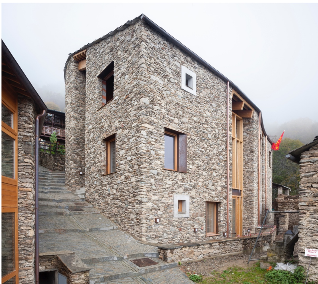
(Fig. 9) Centro Culturale Lou Pourtoun a Ostana (M. Crotti, A. De Rossi, M-P. Forsans, Studio GSP), 2016 – (foto di L. Cantarella).

alpina, il paesaggio – e di cogliere le opportunità, e il sostegno, dei network di una comunità plurima – i nuovi abitanti, le università e gli istituti di ricerca, i promotori economici e culturali – che appare ormai irreversibilmente estesa al di là dei confini locali. 6