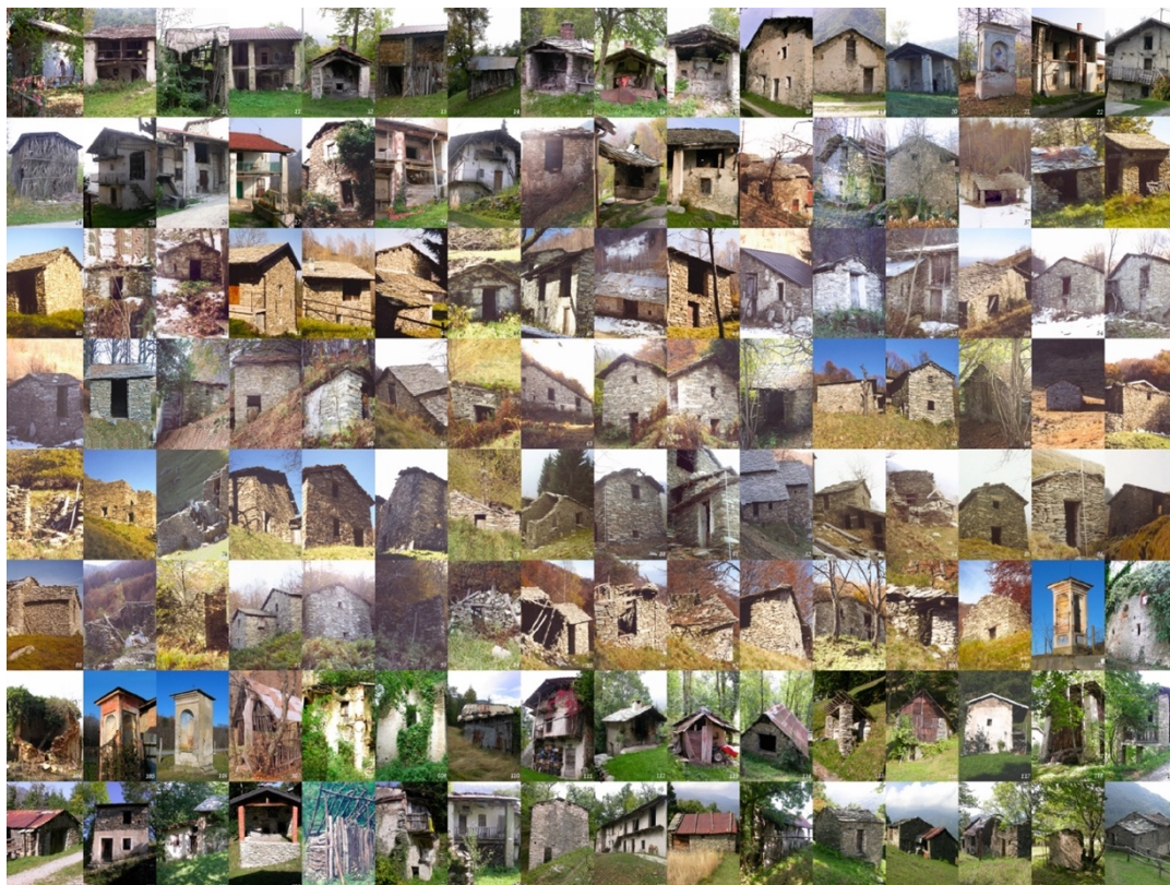
(Fig. 5) Selezione delle costruzioni censite negli Atlanti dell'Edilizia Montana nelle Alte Valli del Cuneese.

Si tratta di un patrimonio edilizio che rappresenta un utilissimo repertorio di tipi, tecniche e materiali per chi opera in questi territori ed è chiamato a progettare ex-novo, o ristrutturare: sapere come si faceva un tetto in paglia o in grosse scaglie ( scàndole ) di legno, come si realizzavano le capriate arcaiche dei fienili di alta montagna, i basamenti dei seccatoi, come si approntavano le coperture delle sé/e (fig. 6) in pietre e terra (l'antesignano del tetto verde, per conservare il latte, il burro e i formaggi di alpeggio) possono diventare spunti da riprendere, da citare, da rielaborare per un architetto che voglia porre la propria opera in continuità con la storia, i caratteri e le identità del territorio (il che, si badi bene, non vuol dire mimesi, o peggio ancora semplice ripetizione o acritica riproposizione).