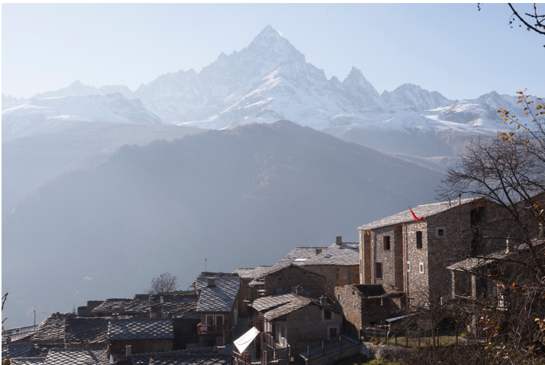
(Fig. 7) Il Monviso e la rinata Borgata Miribrart di Ostana, Alta Valle Po.

In questo processo di rinnovamento, attuatosi in quasi tre decenni, il cardine della visione strategica è stato proprio l'intreccio tra il riuso e il rinnovamento del patrimonio architettonico, la promozione culturale – a partire dalla lingua e la cultura Occitana – e il sostegno e lo sviluppo delle micro-economie locali – accoglienza, agricoltura in primis –.