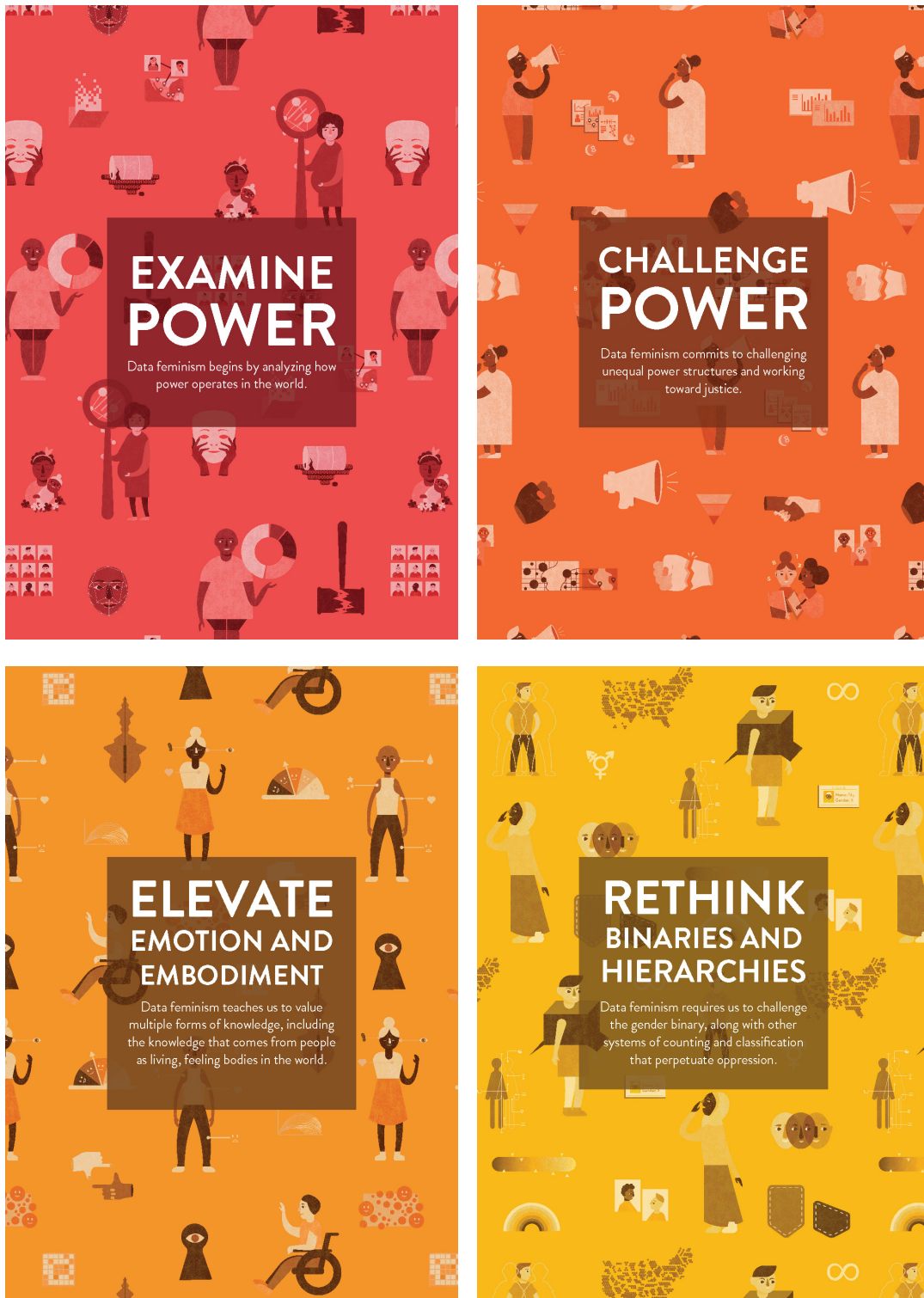
Figura 2. Cartoline sui principi del Data Feminism : #1 “Esaminare il potere”; #2 “Sfidare il potere”; #3 “Elevare l'emozione e l'incarnazione”; #4 “Ripensare binari e gerarchie”.