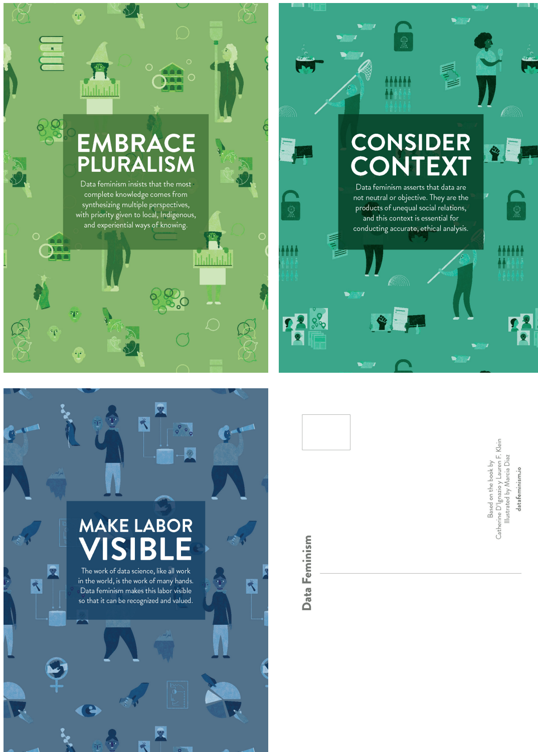
Figura 3. Cartoline sui principi del Data Feminism : #5 “Dedicarsi al pluralismo”; #6 “Tener conto del contesto”; #7 “Rendere il lavoro visibile”.