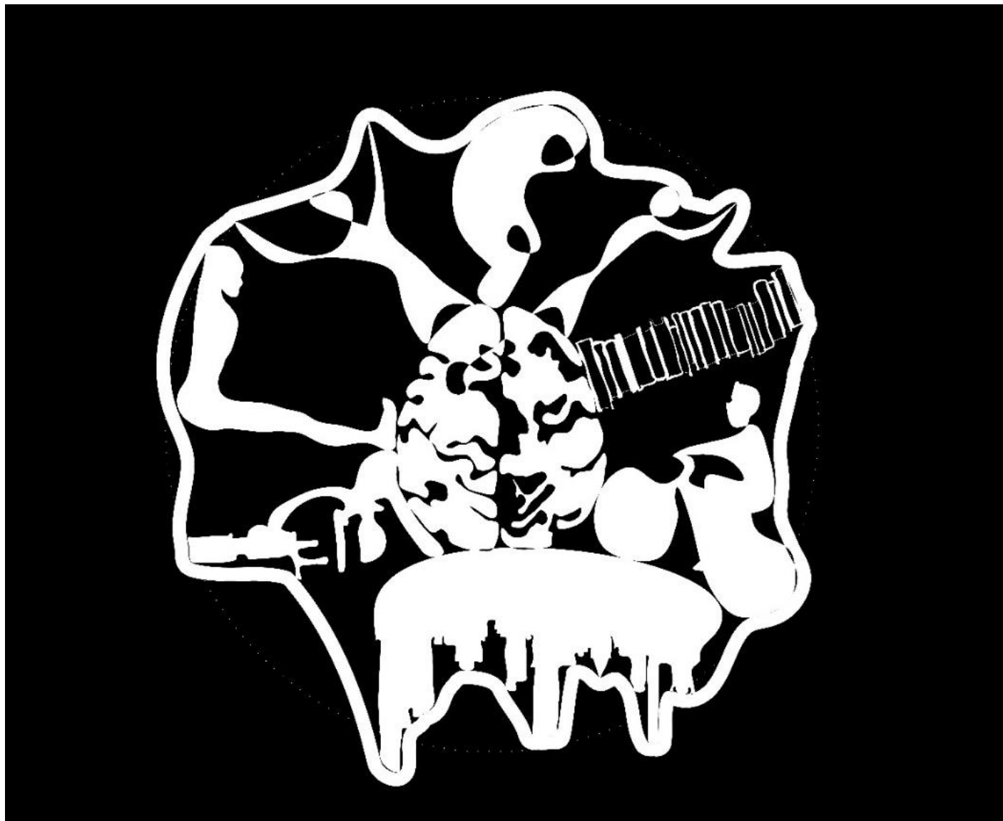
FIGURA 2 VENTRE AMORFO DELLA TERRA. Titaniche analogie nell'era del "Ri-". Operazioni conservative nel nuovo. Di Antonella Pettorruso.

L'analogia disegnata sta ad indicare quanto esplica il titolo, un'operazione titanica che l'uomo si trova a dover affrontare per provare a mantenere intatta l'immagine del mondo che si è già reso conto di aver modificato. Quello che rimane della vecchia immagine è la memoria di ciò che era, quello che si tenta di fare è conservare per quanto possibile "inalterata" e di diminuire quelle modifiche per ri-stabilire gli equilibri del passato.