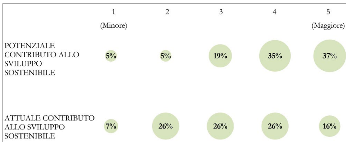
Figura 1. Contributo delle designazioni UNESCO allo Sviluppo sostenibile (scala da 1 a 5); elaborazione dati propria.

economiche, i temi emersi con maggiore ricorrenza e incidenza sono la scarsa sensibilità e attenzione delle istituzioni e dei decision makers locali rispetto all'operato delle designazioni UNESCO e la difficoltà di coinvolgere le comunità. Inoltre, i rispondenti provenienti dai paesi dell'Europa Orientale e da paesi extra-europei hanno espresso preoccupazioni per la percepita debolezza istituzionale, declinata in mancanza o inefficacia del sistema di gestione e in scarse capacità delle autorità competenti. Nel complesso, evinciamo che lo scostamento tra contributo attuale e potenziale allo sviluppo sostenibile non possa essere ricondotto