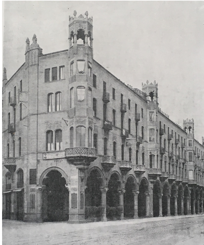
Figura 6: Fotografía de casa Bellia, Turín

al alquiler. El proceso de diseño, confiado a Carlo Ceppi 31 por la empresa de construcción Bellia, está influenciado fuertemente por factores de escala urbana, pero al mismo tiempo por factores arquitectónicos: la imposición de la diagonal sobre el lote, la reglamentación en materia de construcción en campo higiénico-sanitario y la introducción de las más modernas técnicas constructivas.