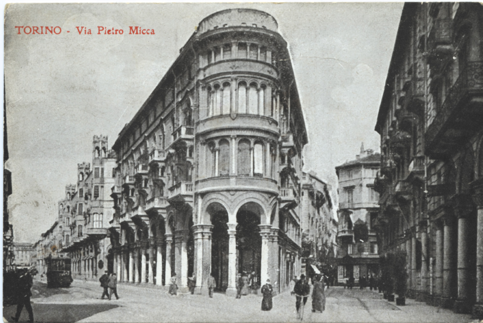
Figura 1: Tarjeta postal histórica que ilustra la entrada de piazza Castello desde via Pietro Micca a la izquierda, Turín, principio siglo XX

Esso fa sì che verso il centro della città si vadano disponendo gli uffici politici ed amministrativi, i circoli e i palazzi dei ricchi, i teatri, le chiese, i grandi alberghi, i magazzini di lusso; mentre le case delle famiglie meno agiate, le sedi delle aziende aventi grandi opifici e grandi magazzini, si dispongono verso la periferia. Ma, crescendo sempre di più la città, avviene che le classi ricche [...] trovandosi stipate nel centro, bramose di aria e di luce, desiderose di cingere le loro case d'un giardino, [...] cominciano ad emigrare dal centro verso la periferia. 6